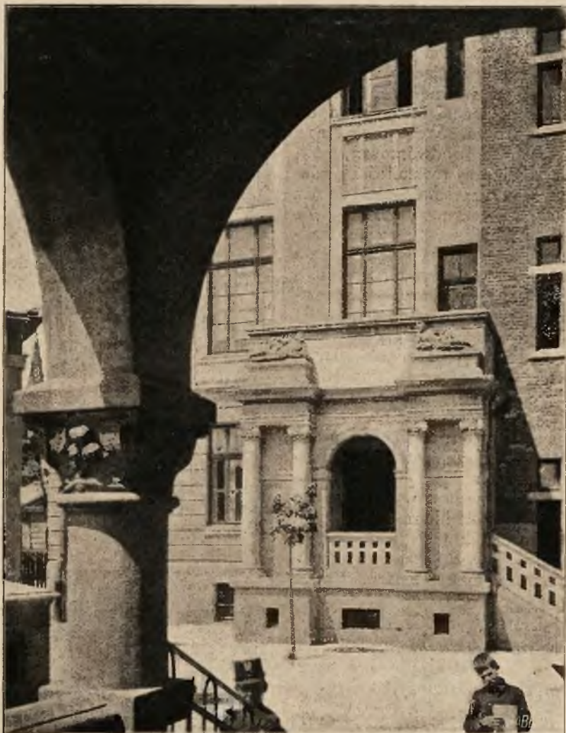
Malowniczy fragment architektoniczny w dziedzińcu Domu ludowego T. S. L. w Tarnopolu. Nad wejściem umieszczone dwie rzeźby włoskie z XVII w., zabytek, ocalony z grobowca rodziny Turkułów. Grobowiec ten znajdował się w Tarnopolu w kościele, który został w r. 1806 zburzony.

na 129.039 kor. I budżet szkolny tak olbrzymio wzrasta, tak wyczerpuje siły materialne T. S. L., że inne piekące potrzeby muszą pozostać niezaspokojone, że odłogiem musi leżeć wiele naturalnych pól pracy, a w szczególności oświata pozaszkolna, która przecież stanowi właściwe, zasadnicze pole działania naszej instytucji. Dzięki temu