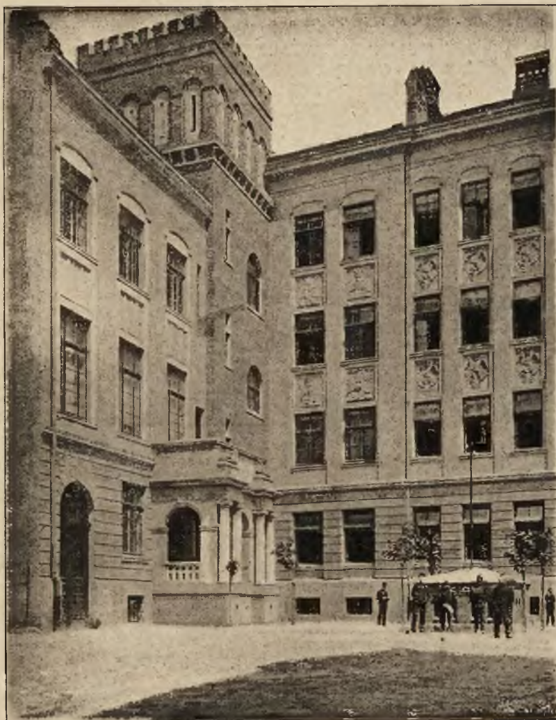
Bursa i Dom ludowy T. S. L. w Tarnopolu (widok od strony dziedzińca).

gimnazjum realne w Orłowej. Zakłady te ciążą olbrzymimi sumami w pozycji wydatków T. S. L. A wydatki na te zakłady są dopiero w zaczątku i z biegiem lat, z przybywaniem nowych klas, olbrzymio wzrosną.