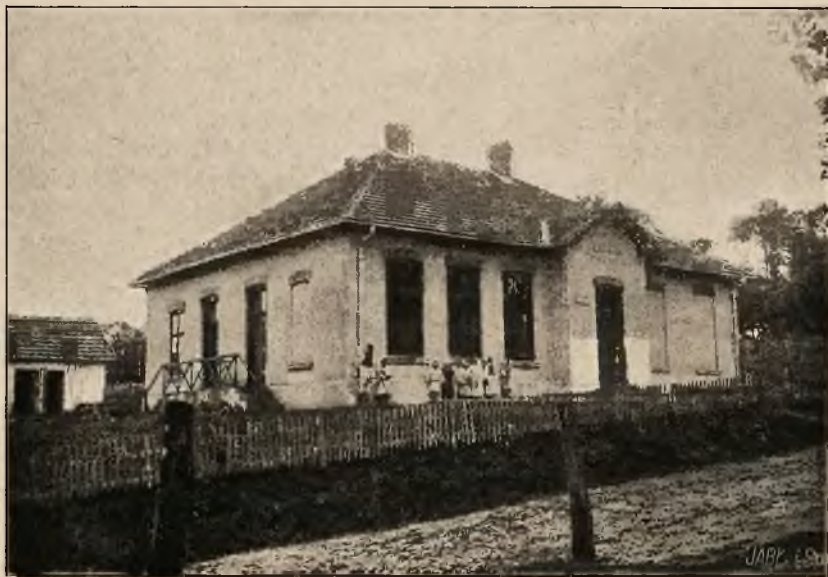
Szkoła polska T. S. L. imienia Laury z Dobrzańskich Pressenowej w Milatynie, utrzymanywana staraniem Koła T. S. L. w Gródku Jagiellońskim.

Nieco mniej rażąco przedstawia się w porównaniu z Niemcami nasza ofiarność. Jednak i ta pozycja wykazuje znaczne passywa. W tym samym czasie, złożyli Niemcy dla