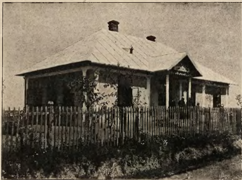
Szkola polska T. S. L. w Weleńnicy, zbudowana i utrzymywana przez Koło Pań T. S. L. w Stanisławowie.

Ogromna systematyczność, niesłychana bezwzględność i niecofanie się przed żadnymi