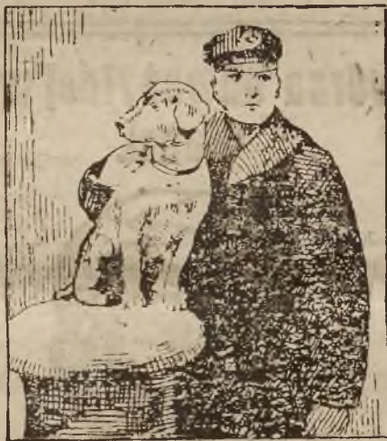
„Eppy“ i Kwatermistrz na Okręcie „President Roosevelt“.

Załoga każdego okrętu Linji Stanów Zjednoczonych ma swego faworyta, który na przynosić szczęście okrętowi. Ogólnie znanym jest faworyt całej floty Linji Stanów Zjednoczonych, składającej się z dwunastu okrętów, który sam dobrowolnie podjął się tej roli. Przechodzi on z jednego okrętu na drugi i nigdy nie odbywa podróży tam i z powrotem przez Atlantyk na tym samym okręcie.