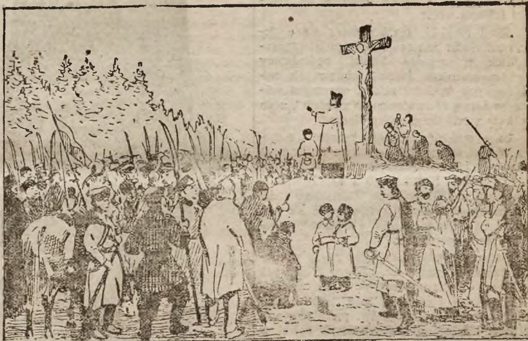
Blagosławieństwo powstańców przed bitwą.

Z tą chwilą rozpoczyna się praca tajemna, której celem zrzucenie tyranistwa, wywalczenie wolności. Powstało w Warszawie Komitet Centralny (którego duszą był Bronisław Szwarce), który wnet rozpada się na