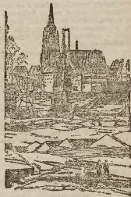
załamanie się mostu w Frankfurcie nad Menem.