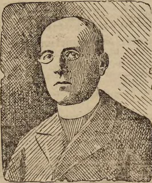
Prałat dr. Ignacy Seipel austrjacki kanclerz państwa.

wracał z obchodu poświęcenia sztandaru w jednej z miejscowości pod Wr. Neustadt. Sprawcą jest robotnik. Strzelił on dwukrotnie do kanclerza, raniąc go ciężko w płuca, a następnie strzelił do siebie, raniąc się bardzo ciężko.