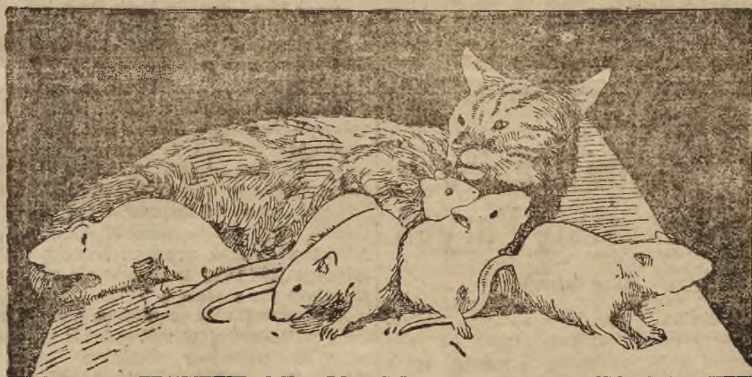
Rycina ta jest jedną z najciekawszych, jaką dotychczas widziano. Przedstawia ona kotkę, która karmi i wychowuje młode szczury.

mówił Herriot — że konsolidacja pokoju będzie najlepszą przysługą, jaką oddać możemy Polsce, która pozbawiona granic naturalnych, jakie posiada np. Czechosłowacja, musi dążyć do ustalenia ze swoimi sąsiadami normalnych stosunków, które byłyby gwarancją pokoju. Zapytany o sprawę nowego gabinetu Herriot odpowiedział, że w obecnej sytuacji politycznej nie odmówił podjęcia się misji utworzenia nowego gabinetu, jeżeli tylko będzie widzieć możliwość pożytecznej działalności dla kraju, a zgodnej z jego poglądami. Co się tyczy pogłosek o zamierzonych zmianach na placówkach dyplomatycznych, który to zamiar był mu przypisywany, stwierdził