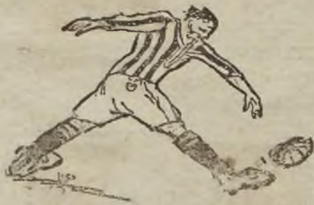
4 PP. Leg. (Kielce)—19 PP. OL.

Dzisiaj 20. bm. o godz. 3.30 popoł. na boisku I. LKS. Czarnych odbędą się zawody o mistrz. Armji pomiędzy powyższemi drużynami. Ze względu na dobrą formę 19-stki, która w ubiegłą środę pobiła pewnie 20 pp. (Kraków) Mistrza Armji — zawody zapowiadają się b. interesująco. W razie wygranej 19-stka walczyć będzie w Warszawie o tytuł Mistrza Armji.