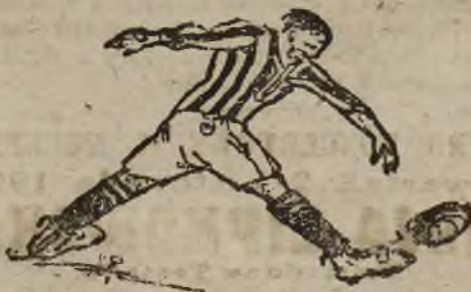
POGOŃ—19 PP. OL

Dzisiaj tj. we czwartek 25. bm. o godz. 4-tej popoł. na boisku Cytadeli odbędą się zawody