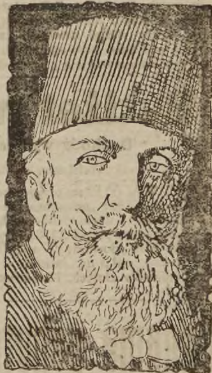
Abdul Medjid, zdeponizowany sultan turecki, który przeniósł obecnie swoją rezydencję z Territet koło Lozanny do willi Cimier koło Nicei.