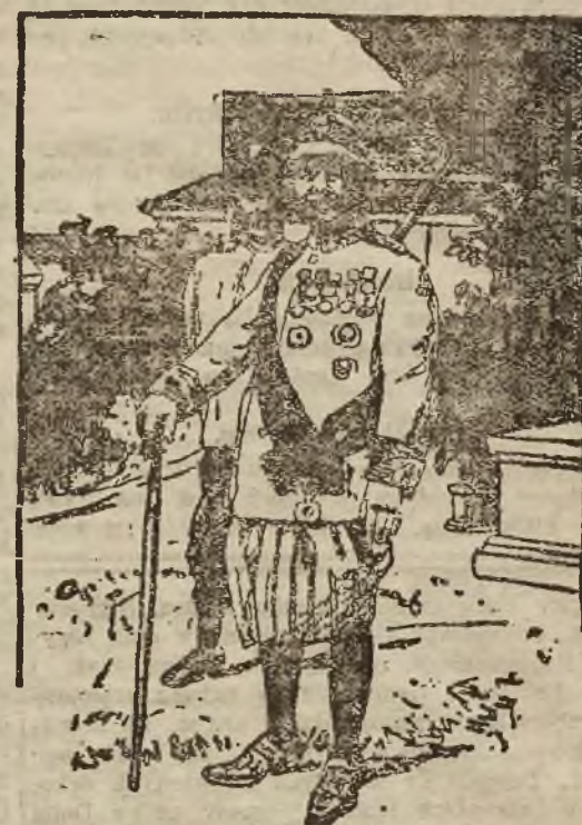
Najstarszy wiek em monarcha świata łączywa przez dzi.