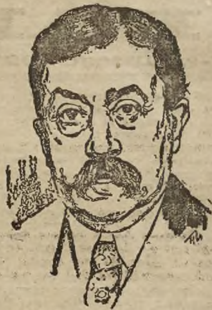
ponownie obrany prezydent francuskiej Izby deputowanych.