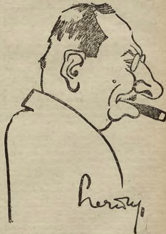
Z galerji karyktur Z. Czernańskiego.