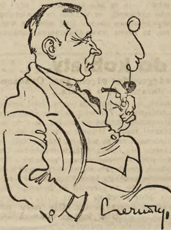
Z galerji karykatur Z. Czermańskiego.