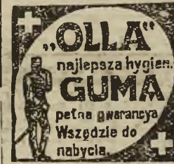
Adresy składów podane w plakatach. Cena 30 groszy szt.

Kooperatywa spożywcza ul. O. m.ajska 19 (róg ul. Grodzickich) poleca po cenach konkurencyjnych wszelkie gatunki maki zagranicznej i krajowej i różna wiktuały. Dla hurtowników i konsumentów większy rabat!