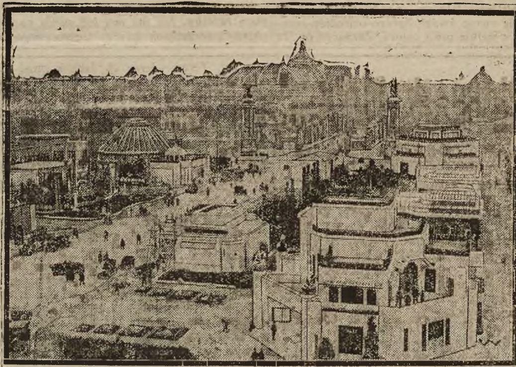
Ogólny widok wystawy.