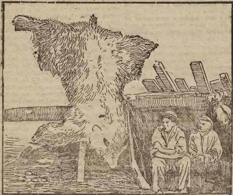
Skóra wielkiego niedźwiedzia brunatnego, zabitego w Bettles nad Upper-Kayukuk.