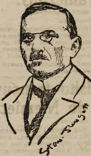
Min. Stanisław Thugutt.

Warszawa (z). Ustępujący min. Thugutt udzielił wczoraj dziennikarzom wyjaśnień w sprawie powodów tego ustąpienia. Minister oświadczył, że bezpośrednim powodem tego jego kroku była uchwała klubu pracy, istotnie jednak przyczyną tkwiącą w tym, że nie udało mu się, jako przewodniczącemu sekcji Rady Ministrów do spraw mniejszości narodowych, uzyskać solidarności w łonie gabinetu. Minister stwierdził, że nie szanowano Konstytucji i nie wykonywano ustaw, pomimo jego nawoływań.