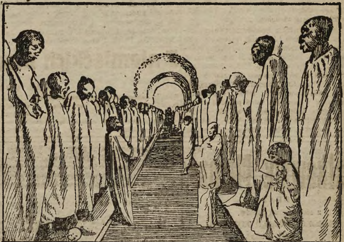
Indyjskie mumje w „Panteon Municipal” w Guanajuato (Meksyk), ukazujące grozę śmierci z straszliwą wyrazistością.