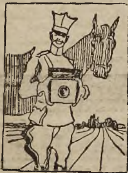
Barwik & Borzemski Lwów, Kopernika 18

Centralna Składnica Aparatów Fotograficznych Barwik & Borzemski Lwów — ul. Kopernika 18