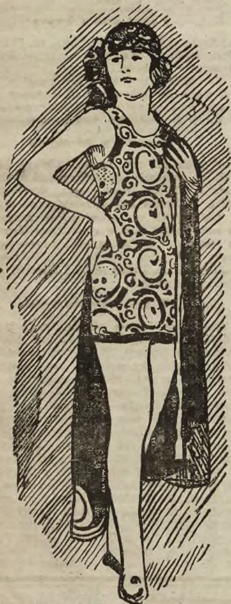
Najmodniejszy strój kąpielowy.