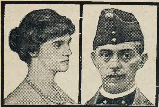
B. ces. aus r. Zyta i niedoszły małżonek węg. hr. Hunyady.