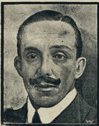
Król Alfons hiszpański obchodził 25-lecie swego panowania. Uroczystości jubileuszowe wypadły imponująco, a osławiony gen. Primo de Rivera wręczył królewskiemu jubilatowi w imieniu armji buławę marszałkowską.