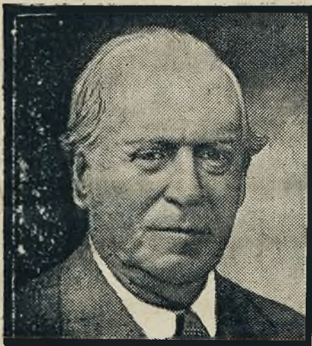
Dla osłodzenia klęski wyborczej liberalów angielskich, ich sędziwy przewodca Asquit, został dźwignięty do godności lordowskiej. Tytuł lorda of Oxford jest dziedziczny i wobec śmierci młodego Asquita podczas wojny światowej godność para przejdzie na wnuka.