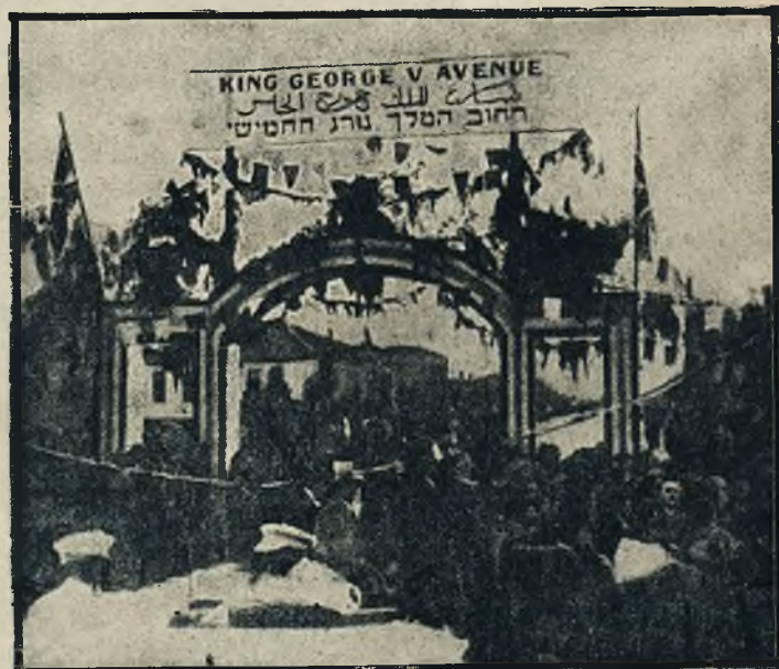
Jerozolima odwdzięcza się Anglii nazwaniem jednej z dzielnic imieniem króla Jerzego. Rycina nasza przedstawia bramę tryumfalną u wejścia do nowo poświęconej dzielnicy. Nad bramą powiewa transparent z napisem trójjęzycznym.