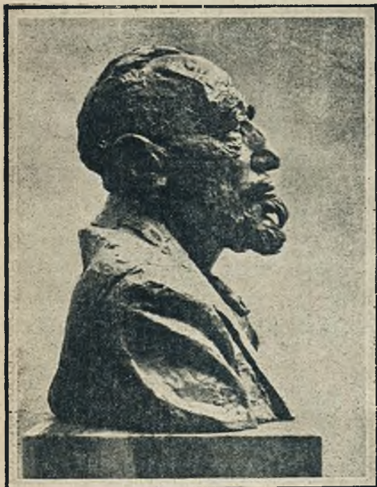
Popiersie znakomitego pisarza angielskiego, a rodaka naszego Korzeniowskiego-Conrada, wykonane przez Jakóba Epsteina, wybitnego rzeźbiarza angielskiego. O popiersie to toczą spór miasto Manchester i Nar. Galerja portretów zasłużonych anglików, znamiennem jest, że zarówno rzeźbiarz jak portretowany są Polakami.