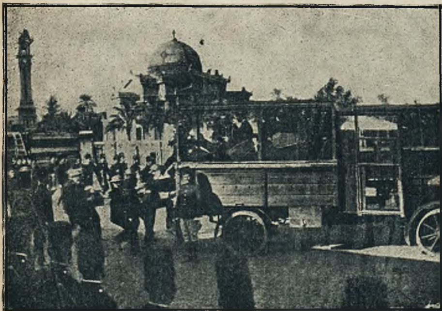
Patrol policyjna w stalowych hełmach i ze stalowymi tarczami udaje się do zbuntowanych części Kairu. Po ponurych dniach uśmierzenia Irlandji, przyszła teraz kolej na budzący się Egipt.