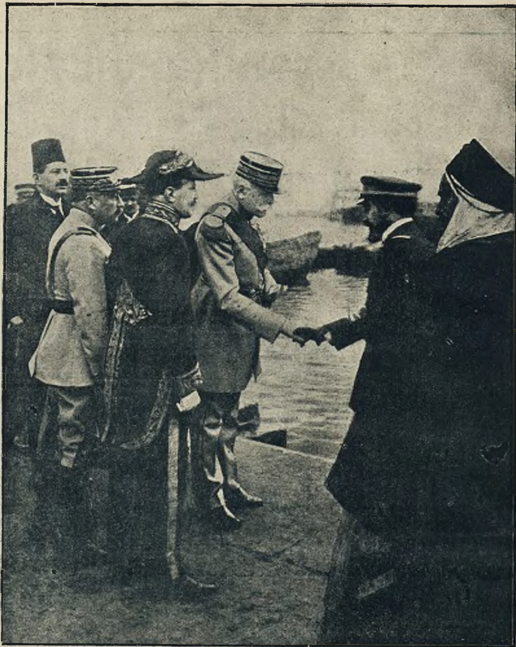
Przybycie gen. Sarraille'a, wysokiego komisarza Francji przy rządzie Stanów Syryi, na nowy posterunek. Przyjazd gen. zbiega się z faktem proklamacji zjednoczenia Stanów Syryi, uroczystie obchodzonego przez ludność Damaszku i Alepa