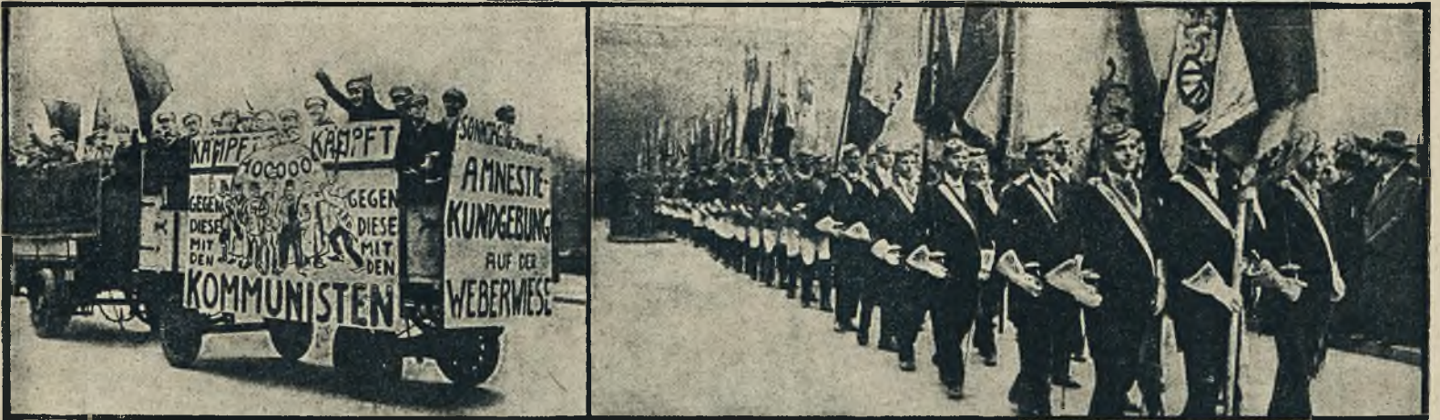
Komuniści niemieccy na swój sposób święcą rocznicę cesarstwa, ich wozy propagandowe przykuwają uwagę przechodniów.