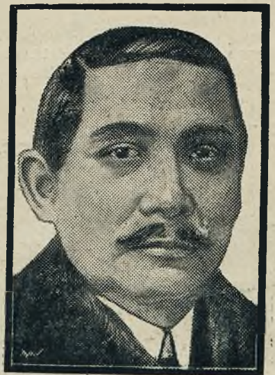
Duchowy wódz rewolucji chińskiej, dr. Sun Jat San zmarł w dniach ostatnich. Olbrzymi wpływ tego działacza na masy chińskie przejawiał się dobitnie po śmierci cesarzowej wdowy gdy wspólnie z Juaschikaj'em zorganizował rewolucję i detronizację dynastji Mandschu.