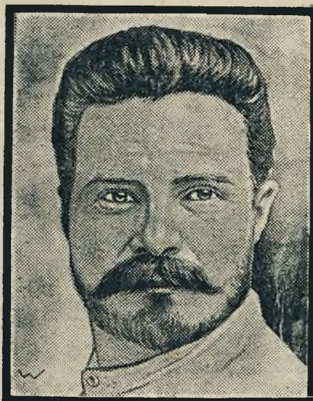
General Frunze następcą Trockiego na stanowisku wodza czerwonej armji.