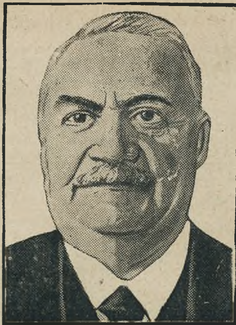
Prezydent Francji, Gaston Doumergue, przybędzie w początkach maja rb. do Polski z re wizytą. Podróż odbędzie na krążowniku pancernym „Lotaryngia“ do Gdańska i stąd specjalnym pociągiem uda się do Warszawy.