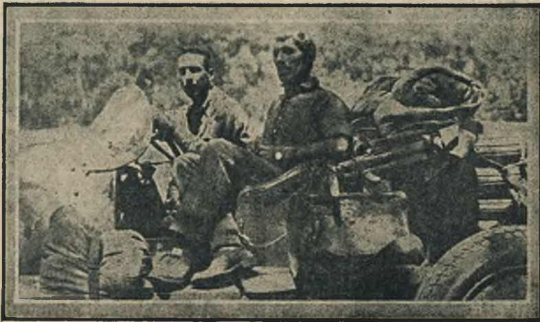
2100 mil angielskich w 9 dniach automobilem przez Australję.