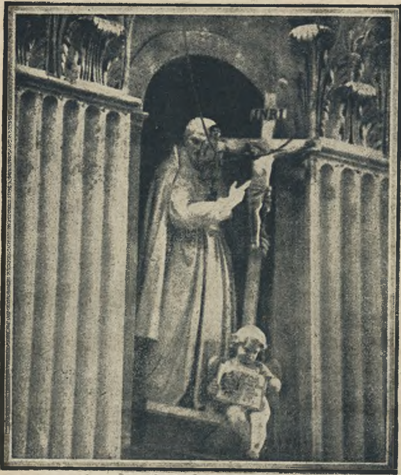
Gigantycznych rozmiarów statua marmurowa w kościele św. Piotra w Rzymie. O olbrzymich rozmiarach tej figury daje pojęcie postać włoskiego robotnika, który czyszcząc marmur ulokował się na ręce rzeźby i czyni wrażenie maleńkiej lalki.