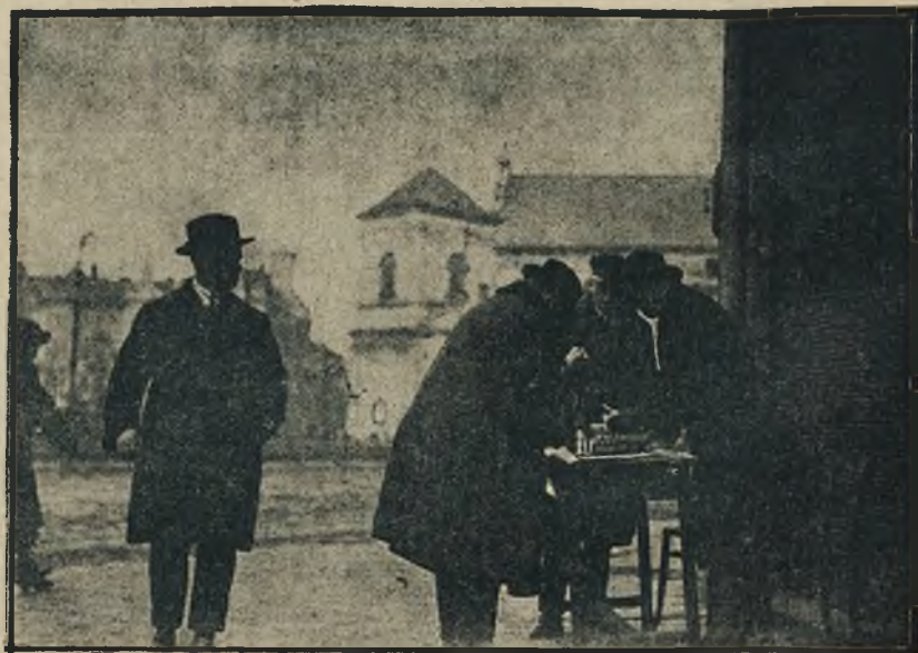
Samopomoc akademicka z niesłabnącą energią rzuca się na rozmaite eksperymenty dochodowe byle najprędzej uciąć dość grosza na budowę wł. dachu nad głową. Ryciny nasze przedstawiają sympatycznych sprzedawców herbaty „Seaster“, zachwalających pozatem szanse „pudełek szczęścia“.