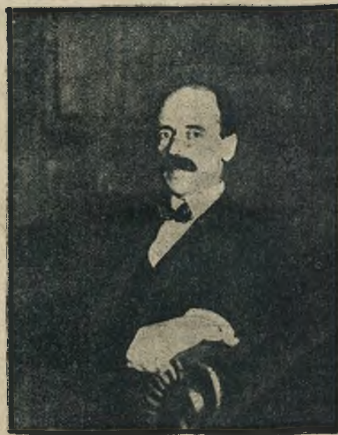
Węg. prez. min. hr. Bethlen w drodze do Genewy na sesję Ligi Nar. bawił we Wiedniu i konferował z austr. mężami stanu podobno na temat zawarcia gospod. związku między Austrią a Wę rami. Liga Nar. ma popierać ten projekt.