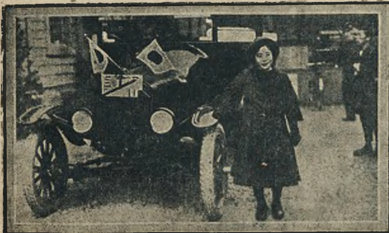
Na ulcach Tokio pojawiła się pierwsza japońska szoferka.