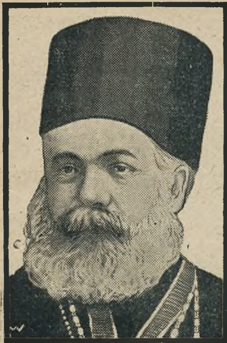
Konstantyn VI, patriarcha gr. ortod. Kościoła wydalony z Konstantynopoli przez władze tureckie. Banieja ta wywołała napięcie stosunków pomiędzy Grecją a Turcją.