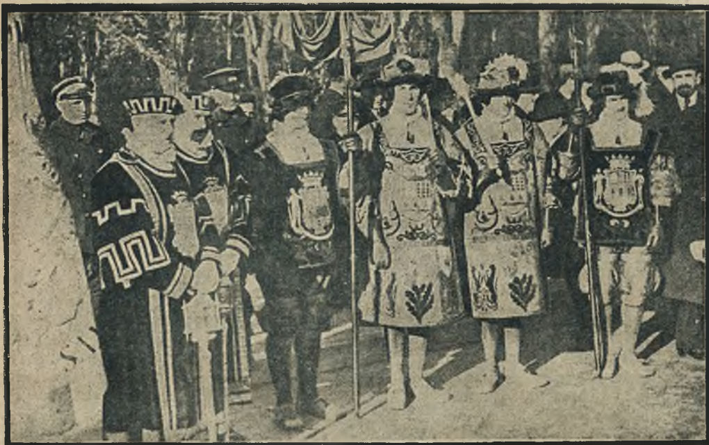
Atak głośniego pisarza hiszpańskiego, Blasco Ibanez'a, na króla hiszpańskiego, wywołał kontrademonstrację ludności hiszpańskiej, która ze wszystkich stron kraju pospieszyla z dowodami lojalności dla króla. Rycina nasza przedstawia fragment pochodu 9000 przedstawicieli poszczególnych powiatów Hiszpanji w nalownicznych strojach historycznych ze sztandarami, które wywoływały nieustanne oklaski ludności Madrytu.