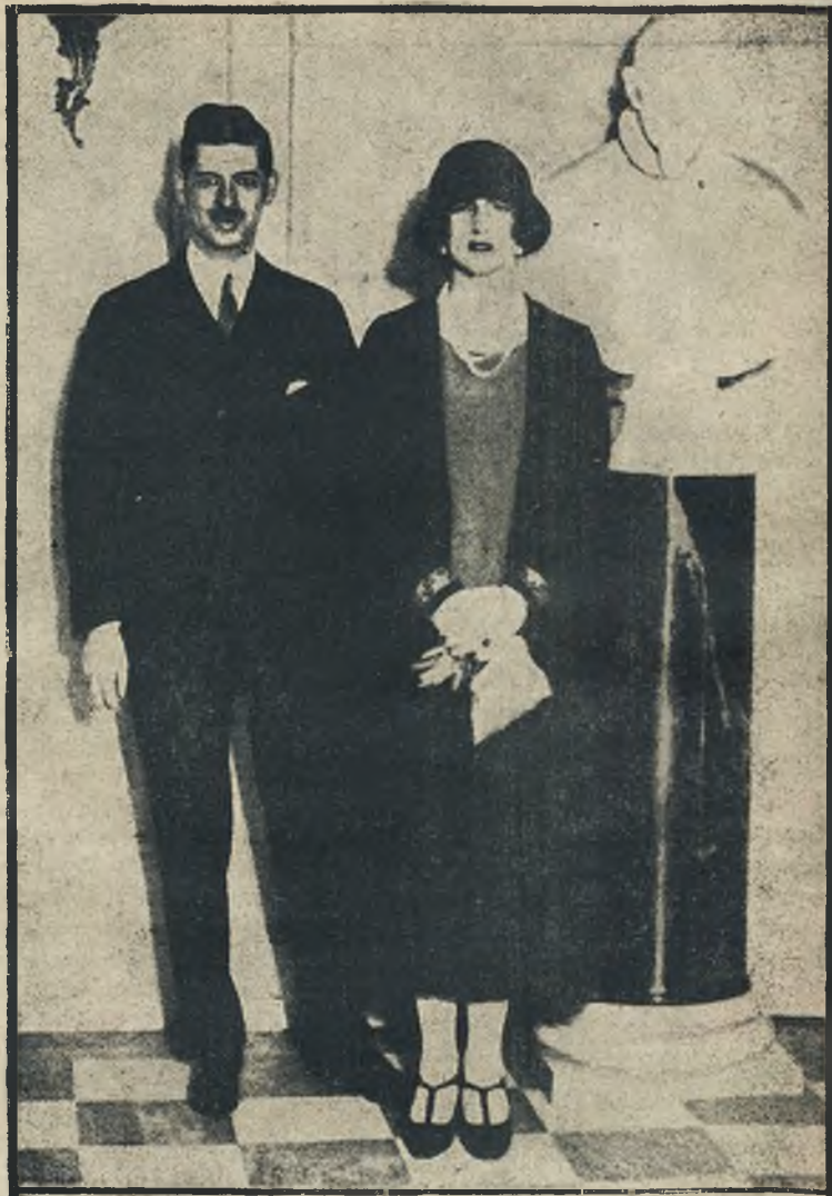
Rumuński następca tronu z małżonką — siostrą b. królowej greckiej — gościł przez dłuższy czas w Londynie.