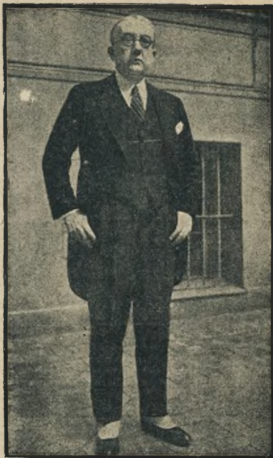
Al. B. Houghton nowo mianowany ambasador St. Zj. w Londynie.

Duchowy udział tramwajarzy lwowskich w pogrzebie nieodżałowanego dyrektora śp. Tomickiego przejawiał się we Lwowie w ten sposób, że ściśle o godzinie 11-tej przedpołudniem tj. w chwili wyruszenia konduktu pogrzebowego, zatrzymano w całym mieście ruch wszystkich wozów na 5 minut. Cała służba tramwajowa w żałobnych opaskach na ramieniu stanęła przed wozami i przez czas postoju pozostała z obnażonymi głowami. Rycina nasza odtwarza moment żałobnej manifestacji przed kawiarnią Wiedeńską.