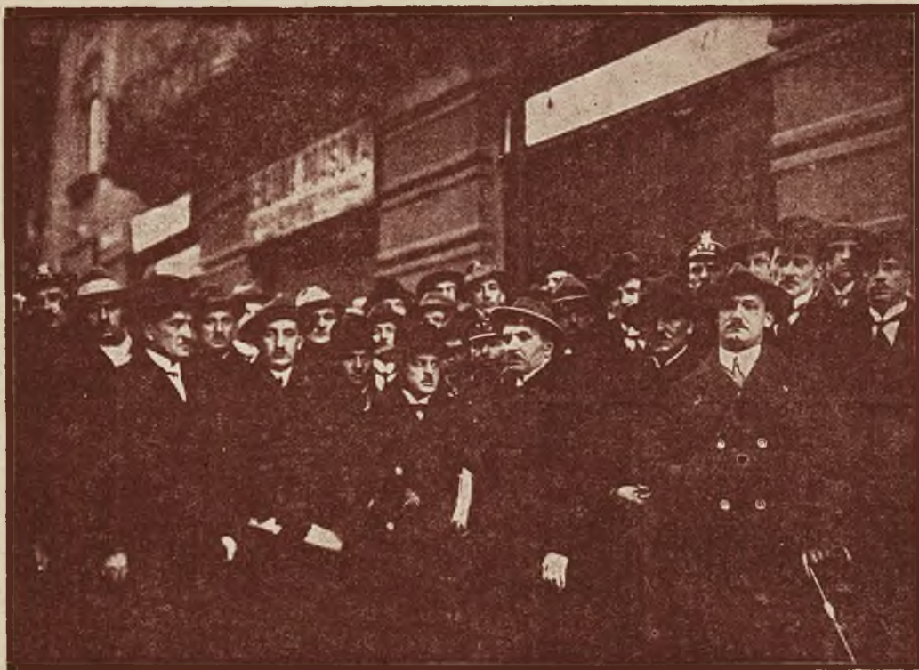
Specjalne zdjęcie dla „Wieku Nowego“.