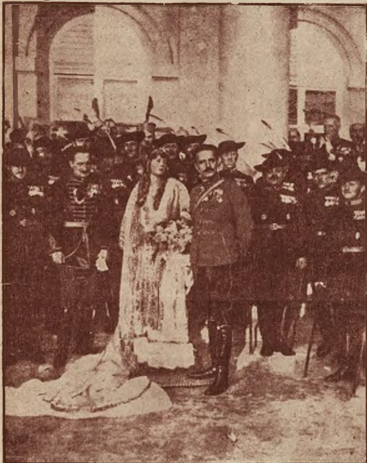
Rycina powyższa przedstawia scenę z uroczystości weselnej węg. magnata hr. Semsey'a z hr. Klarą Karolyi w Budapeszcie; charakterystycznym momentem tej uroczystości jest wystąpienie w orszaku ślubnym własnej armii nowożeńca, który zafundował sobie własne wojsko i umundurował je w średnio-wieczne stroje. Zabawy we własne wojsko powtarzają się wśród węg. margnatów coraz częściej.