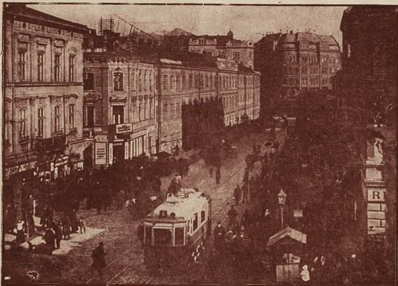
Specjalne zdjęcie dla „Wieku Nowego“.