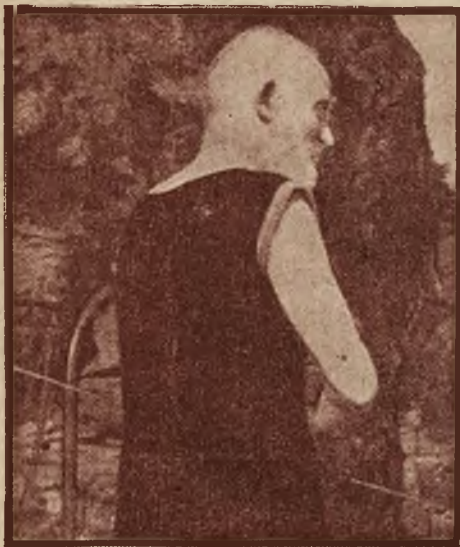
Bernard Shaw zażywa kąpieeli słonecznej na Madeirze.