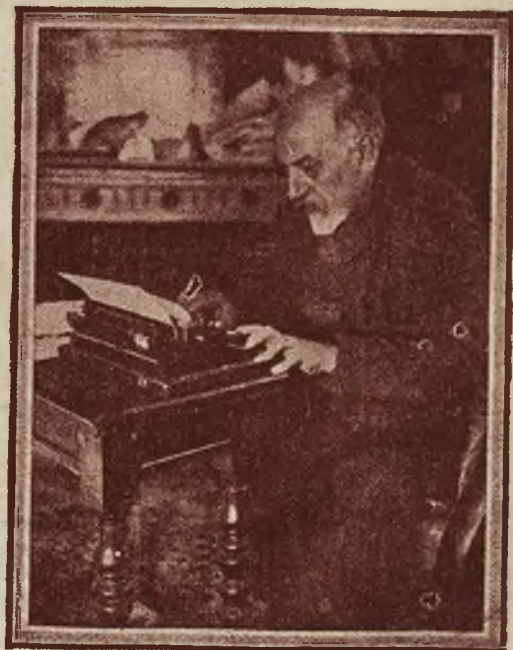
Włoski autor dramatyczny, Luigi Pirandello.