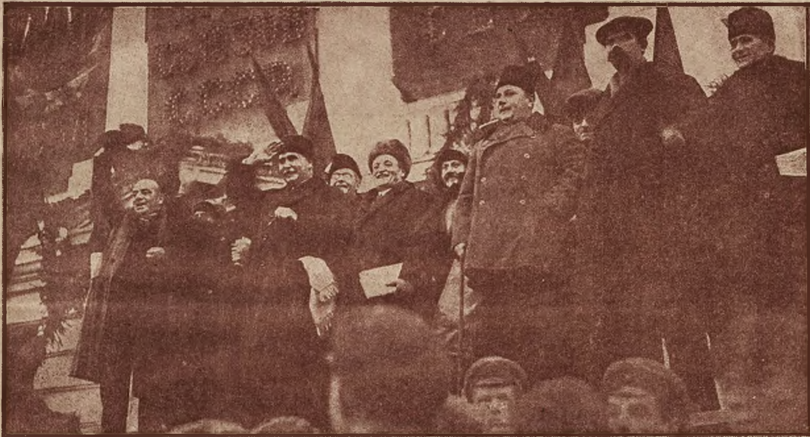
Angielscy przywódcy zawodowych związków robotniczych na VI kongresie bolszewickich związków zawodowych w Moskwie.