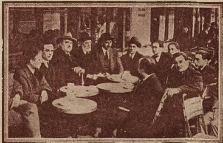
Główny pisarz Blasco Ibañez i światowej sławy uczony Unamuno zmuszeni drakońskimi rządami Primo de Rivero do ucieczki z Hiszpanji, znaleźli schronienie we Francji. Na rycinie naszej widzimy 2 wieki banitów ze swoimi strażnikami w jednej z kawiarni paryskich. — Tradycje emigracji są nieśmiertelne.