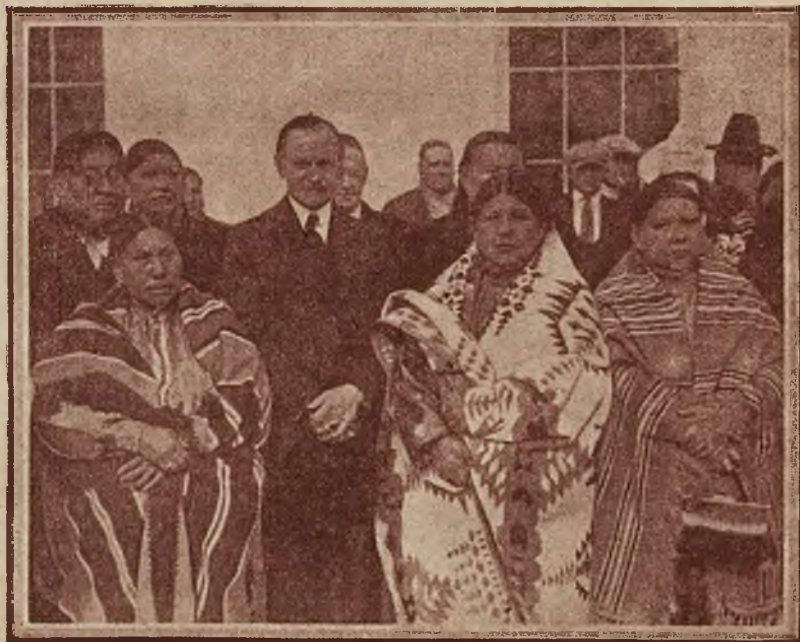
Delegacja półn.-ameryk. Indian zjawiła się z prośbą o posłuchanie w Białym Domu; prezydent St. Zj. Coolidge przyjął egzotycznych gości bardzo życzliwie i jak widać na rycinie — chętnie się z nimi fotografował.