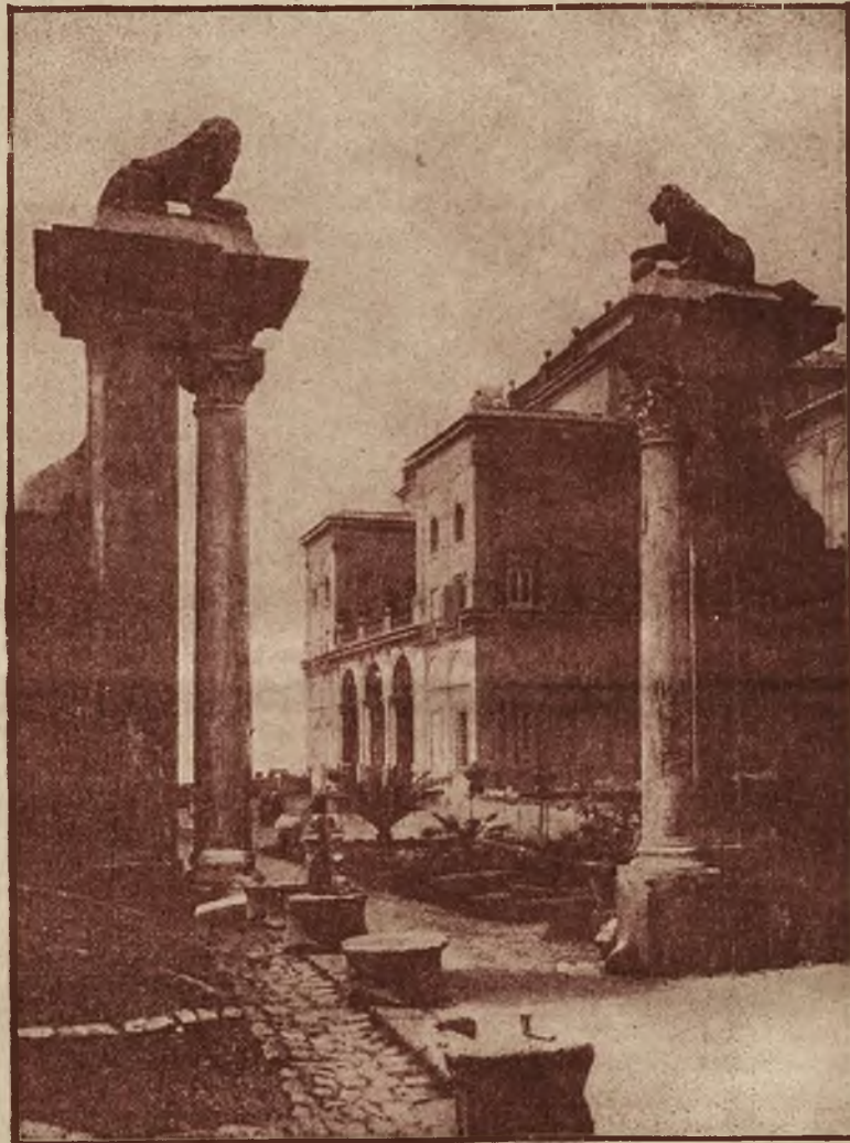
Prześlizna willa Falconieri we Frascati koło Rzymu ofiarowana przez rząd Mussoliniego wielkiemu poecie i patriocie Gabryelowi d'Annunzio.