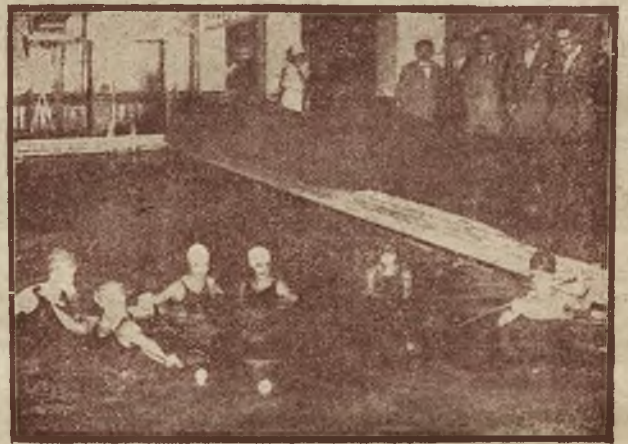
Najnowszym sportem w Ameryce jest gra w bilard na wodzie. Rycina nasza przedstawia taką grę w hotelu „Ambasador“ w Atlantic City.