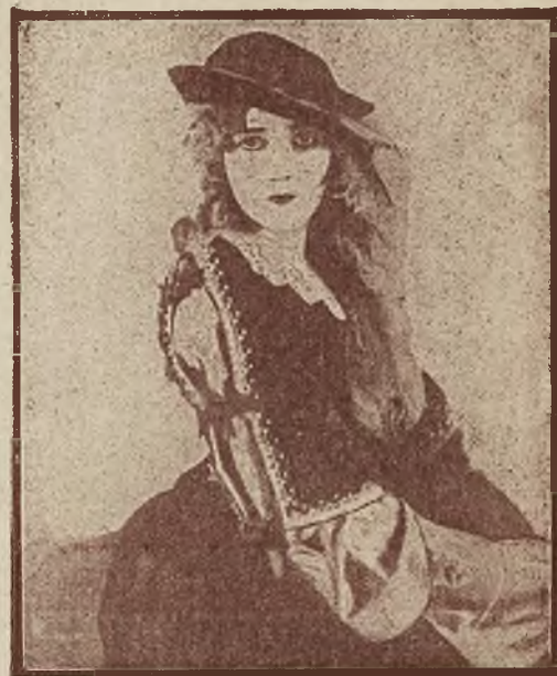
Słynna amerykańska artystka filmowa Mary Pickford w filmie „Dorota Vernon“.