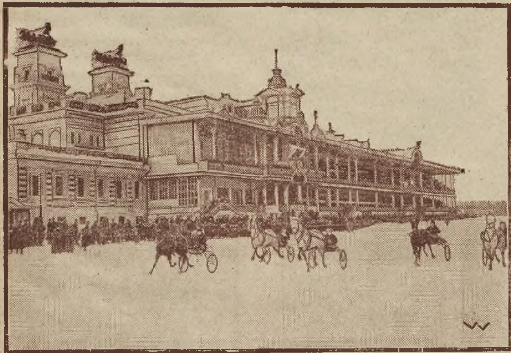
Wyścigi traberów w Moskwie. W Rosji uprawiano zawsze sport traberów. Wyścigi odbywają się cztery razy tygodniowo w lecie i zimą. Rycina nasza przedstawia pole zwycięstwa przed trybuną, równającą się swoją wielkością, trybunom wyścigowym miast zachodnich.