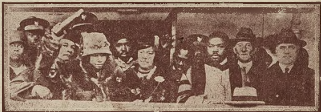
„Prezydent“ Afryki, Markus Garvey, murzyn, na pokładzie statku udaje się w podróż do Afryki.