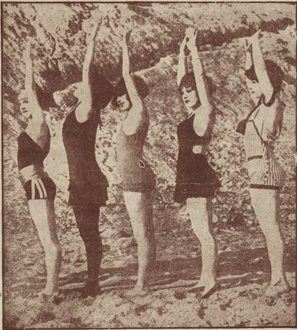
Wyuczasy letnie w Ameryce. Gdy u nas zaczęła się zima, piękne nimfy amerykańskie zażywają kąpieli w morzu w miejscowości Venice (Kalifornia).