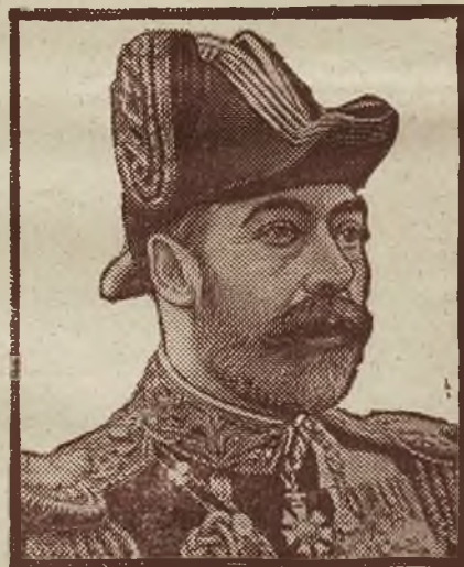
Król Jerzy angielski, który przebył niedawno ciężką chorobę grypy i zapalenia płuc.