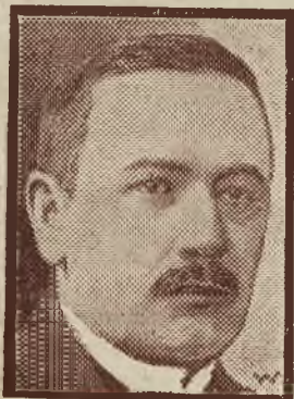
Nowy prezydent Finlandji dr. Relander.