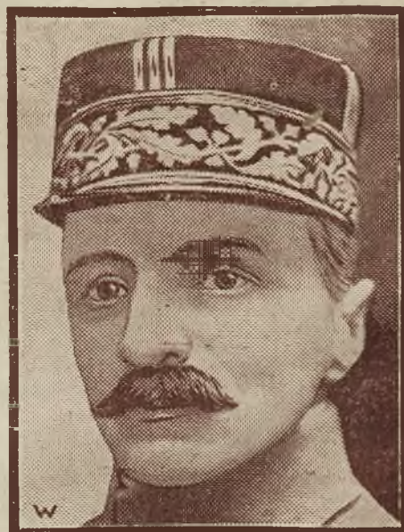
Przewodniczącym międzysojuszniczej komisji wojsk. został wybrany generał Desticker — przedstawiciel umiarkowanego militarystyki francuskiego.