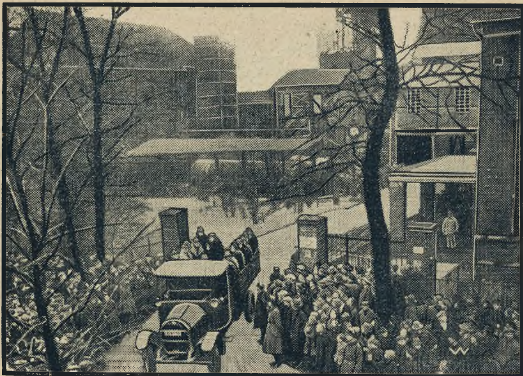
Katastrofa w kopalni w Dortmund, gdzie zginęła wielka ilość robotników Polaków. Rycina nasza przedstawia moment odstawiania kilku uatowanych ze szybu „Minister Stein“.