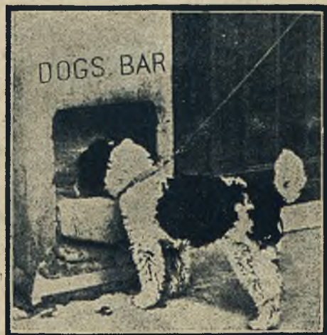
W Paryżu utworzono tzw. „Dogs Bar” dla psów, przy Champs Elyseés. Psy znajdują tam wedkę i posiłek.