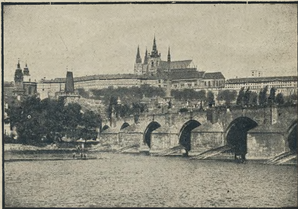
Umowa polsko-czeska. Prezes ministrów Republiki Czesko-słowackiej Antoni Svehly (rycina górna) i Dr. E. Benesz (rycina z lewej strony), czesko-słowacki minister spraw zagr., którzy podpisali niedawno umowę czesko-polską. Rycina z prawej strony przedstawia widok Hradczynu w Pradze.