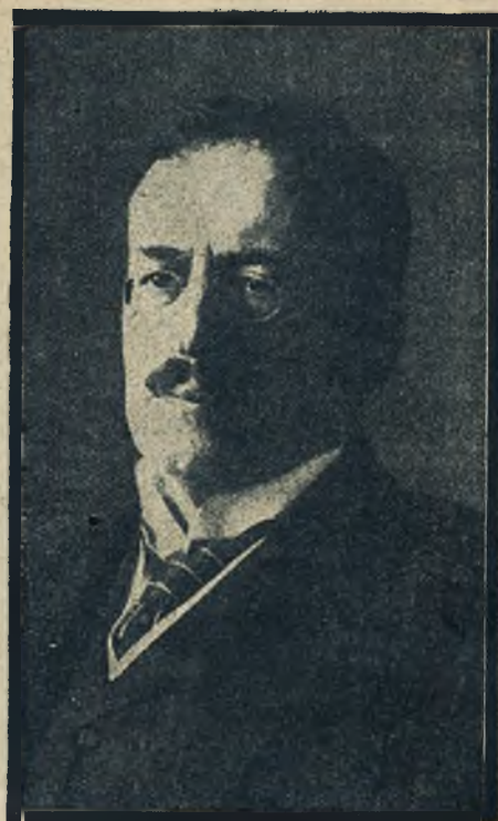
Sven Hedin, szwedzki podróżnik, który wystąpił przeciw polsk. podróżnikowi Ossendowskiemu.