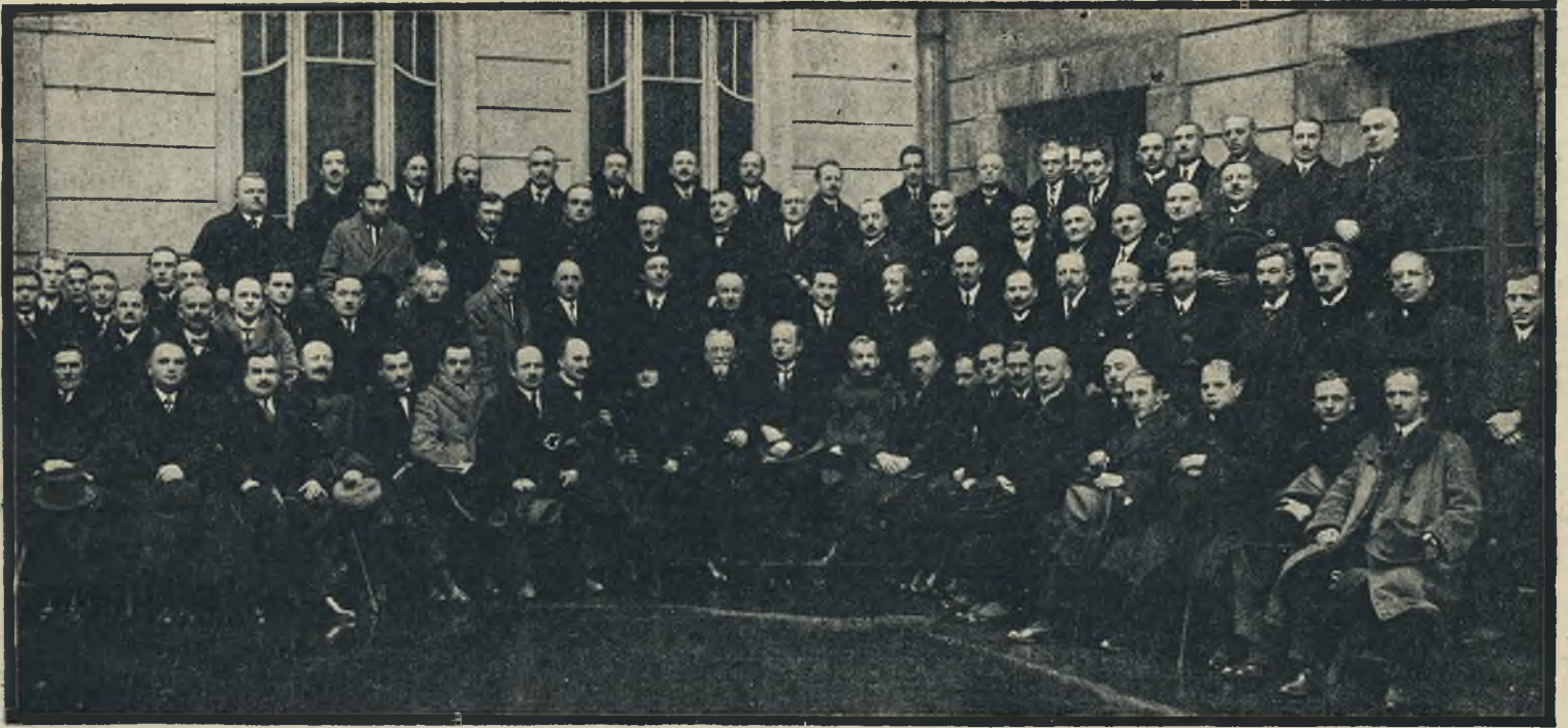
Grupa uczestników Zjazdu złotników, jubilerów i zegarmistrzów z całej Polski, który odbył się we Lwowie d. 28 lutego i 1 marca 1925.