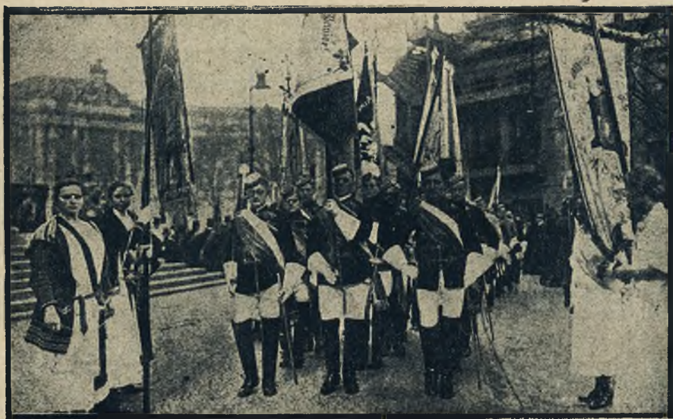
Korporacje studentów niemieckich w Berlinie biorą uroczysty udział w swoich mundurach w procesji koło kościoła Jadwigi w Berlinie.