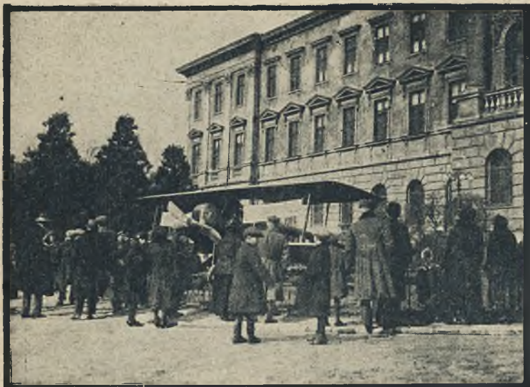
Tydzień Lotniczy we Lwowie. Ubiegłego tygodnia studenci Politechniki lwowskiej urządzili propagandę na cele rozwoju lotnictwa. Przed Politechniką był ustawiony samolot, sporządzony przez samych studentów.