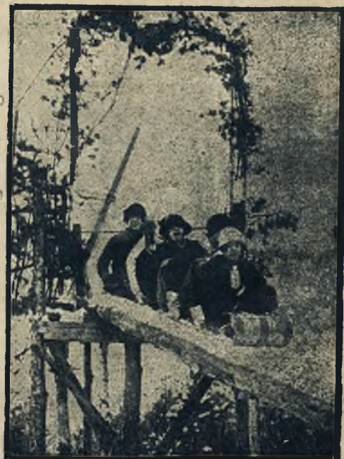
Osobliwy sport zimowy. Studentki uniw. w Bostonie używają jazdy na saneczkach Toboggan.