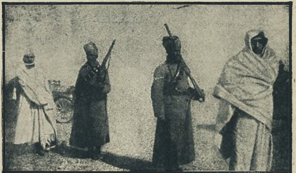
Dwaj mordercy generalnego gubernatora Sudanu, Sir Lee Stacka, aresztowani w Hamman w pobliżu granicy trypolitańskiej.