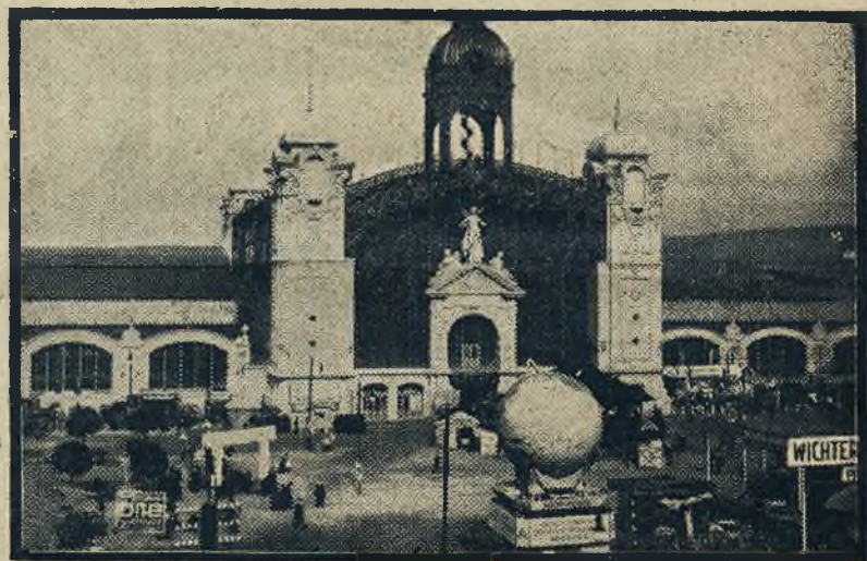
Targi praskie. Ryciny nasze przedstawiają główny plac i Pałac Targów, otwartych obecnie w Pradze.