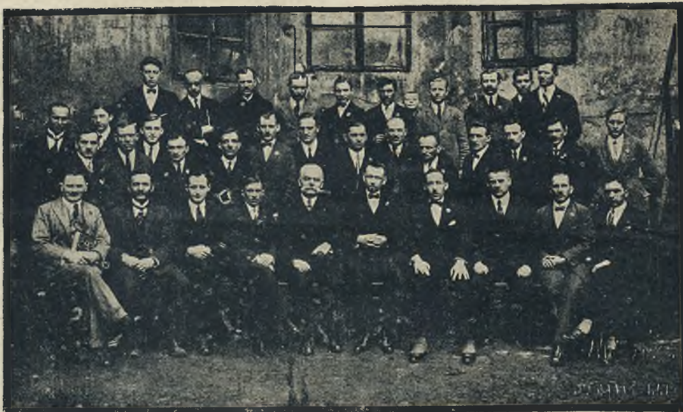
Zjazd delegatów Związku Leg. Okr. Lwów. (8. marca 1925).