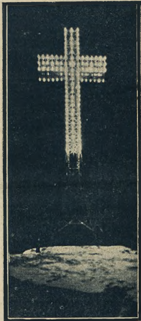
Rzeczy techniczne w Ameryce wyraża się także w budowie olbrzymich krzyży elektrycznych.