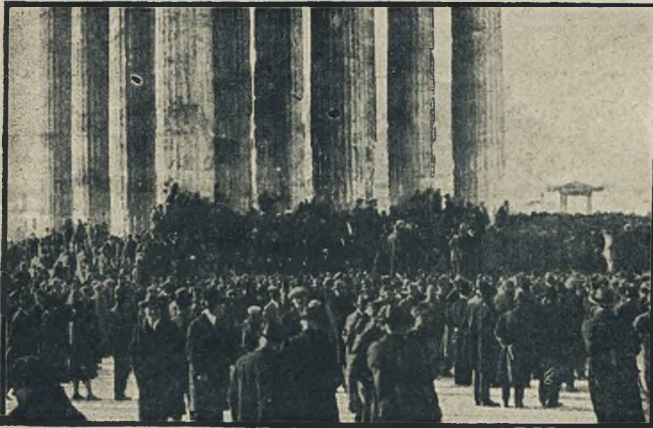
Ateńczycy zaprotowali niedawno energicznie przeciw wypędzeniu z Turcji patriarchy greckiego Konstantyna. Rycina nasza przedstawia ludność Aten, zebraną przed kolumnadą Jupitera i manifestującą swoje uczucia sympatji dla duchowego przywódcy, patriarchy Konstantyna, wypęłzonego z Konstantynopola.