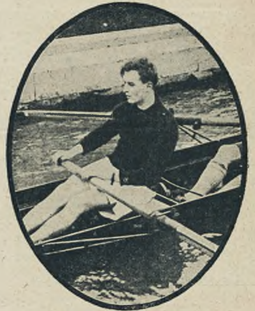
Następca tronu norweskiego, książę Olaf, jako student uniwersytetu w Oxfordzie, bierze udział w zawodach wioślarskich.