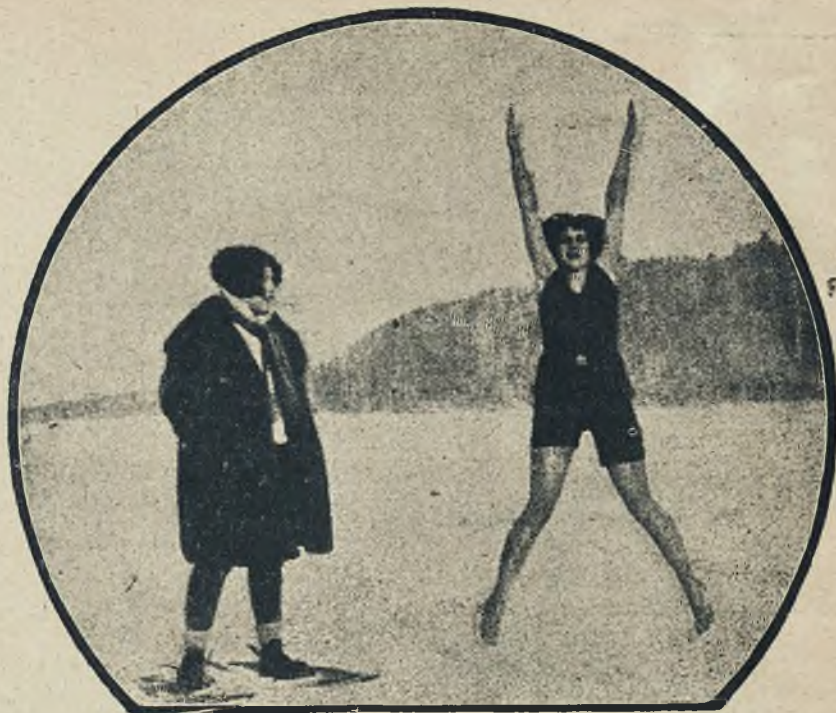
Sport zimowy w kostjumie kąpielowym. Ćwiczenia g'mn. na śniegu przy 30° C w poł.