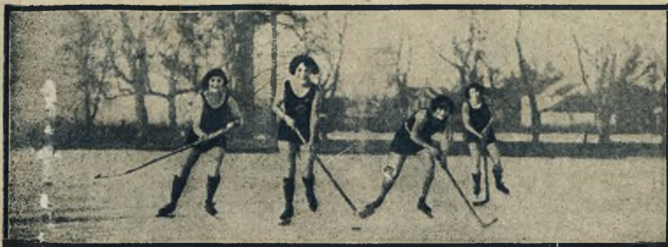
Sport zimowy w kostjumach kąpielowych. Hokej na lodzie na jeziorze St. Paul koło Mineapolis w Ameryce.