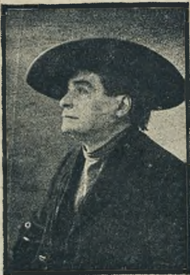
Arystyd Bruant, słynny piosenkarz cyganerji paryskiej na Montmartre, zmarł niedawno w Paryżu w sześćdziesiątym trzecim roku życia.