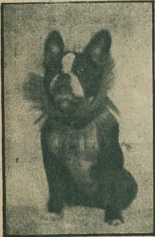
Najulubiejszy przyjaciel znakomitej polskiej artystki filmowej Poli Negri, 1 najczystszej rasy buldog francuski.