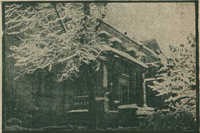
Uroczystość imienin Marszałka Józefa Piłsudskiego. Ryciny górne: Rodzice Marszałka. Rycina środkowa: Marszałek jako Naczelnik Państwa. Ryciny środkowe (boczne): Marszałek w wieku szkolnym (z lewej), Marszałek na zesłaniu w Syberji (z prawej). Ryciny dolne: Marszałek w otoczeniu rodziny (z lewej) i dom rodzinny Marszałka.