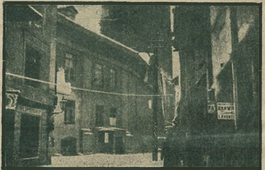
Gimnazjum w Wilnie, do którego uczęszczał Marszałek Józef Piłsudski.