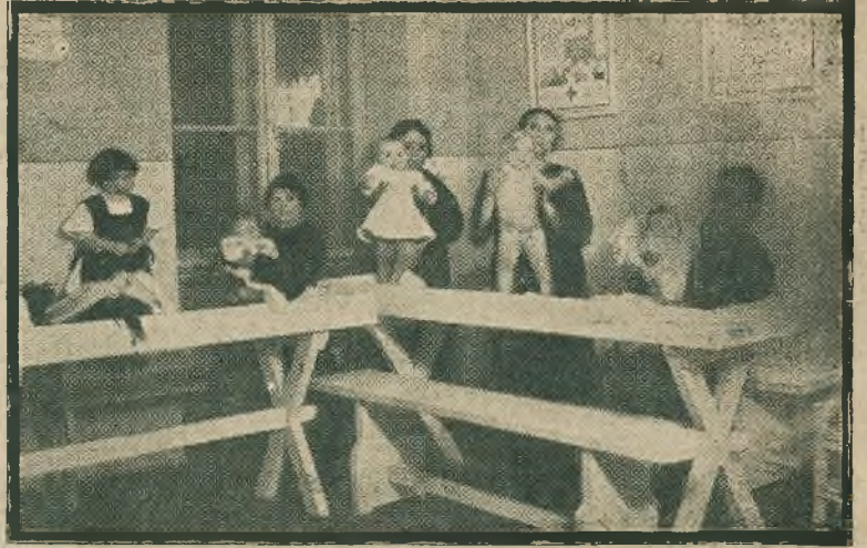
Trojaczki we Lwowie. — Ryciny nasze przedstawiają trojaczki (dwóch chłopców i dziewczynkę) urodzone we Lwowie, a znajdujące się obecnie w Stacji opieki nad matką i dalekiem. Trojaczki te zostały wychowane dzięki Stacji, instytucji humanitarnej, działającej we Lwowie.