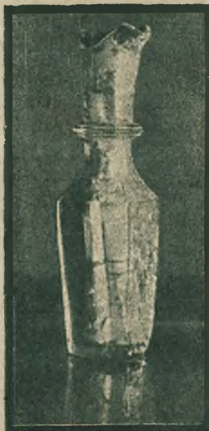
Historyczny fiakon, w którym p. Masaryk, dzisiejszy czesko-słowacki minister, przesłał w roku 1915 z Szwajcarii swoje tajne zlecenia p. Beneszowi w Austrii, uspiwszy tem czujność policji austriackiej w Pradze.