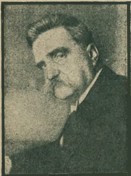
Hjalmar Branting, znany szwedzki socjalista i prezydent ministrów zmarł niedawno w Sztokholmie.