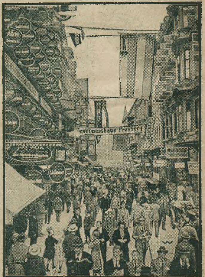
Lipskie targi wiosenne r. 1925. „Petersstrasse” główna ul. Targów.