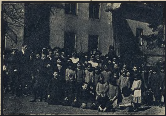
Grupa uczenic Państw. Szkoły zawodowej żeńskiej we Lwowie, po złożeniu darów świąt. w Zakł. sierót przy ul. Wronowskich.