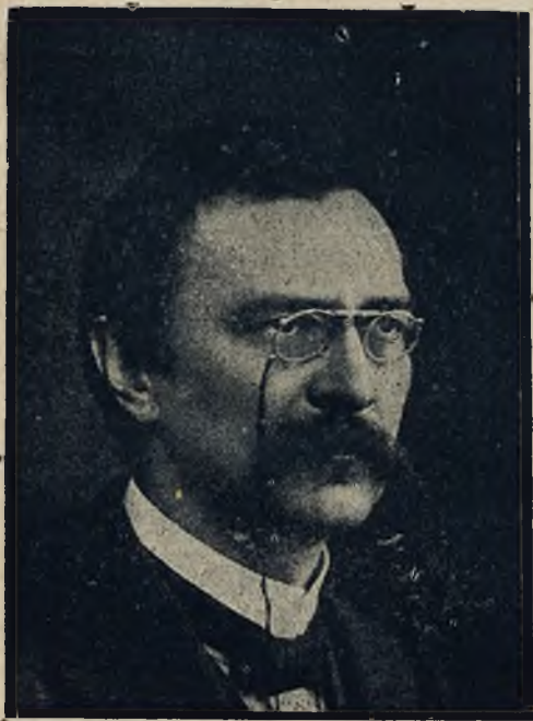
Nowy minister oświaty w Polsce: P. Stanisław Grabski.