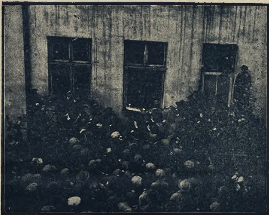
Chwila losowania nagród. Tłum osób, biorących udział w rozwiązaniu, na podwórzu gmachu „Wieku Nowego“ przypatruje się losowaniu.

Losowanie nagród za rozwiązanie Szarady Wielkanocnej „Wieku Nowego“