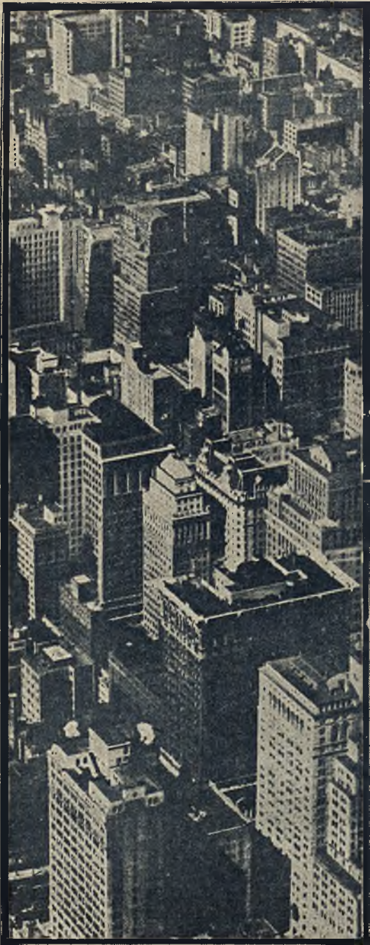
Widok na dzielnicę „drapaczy chmur“ w Nowym Yorku.