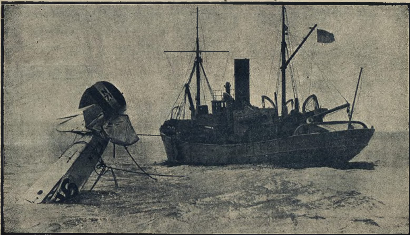
Samolot angielski, który wpadł do morza koło Spi-head, został wydobyty zapomocą specjalnego statku do wylawiania samolotów „Adastral”.