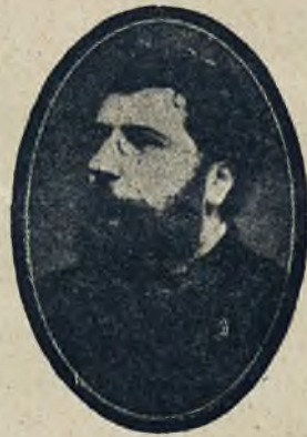
Jerzy Bizet, twórca opery „Carmen“ która została przed 50 laty wystawiona poraz pierwszy w teatrze.