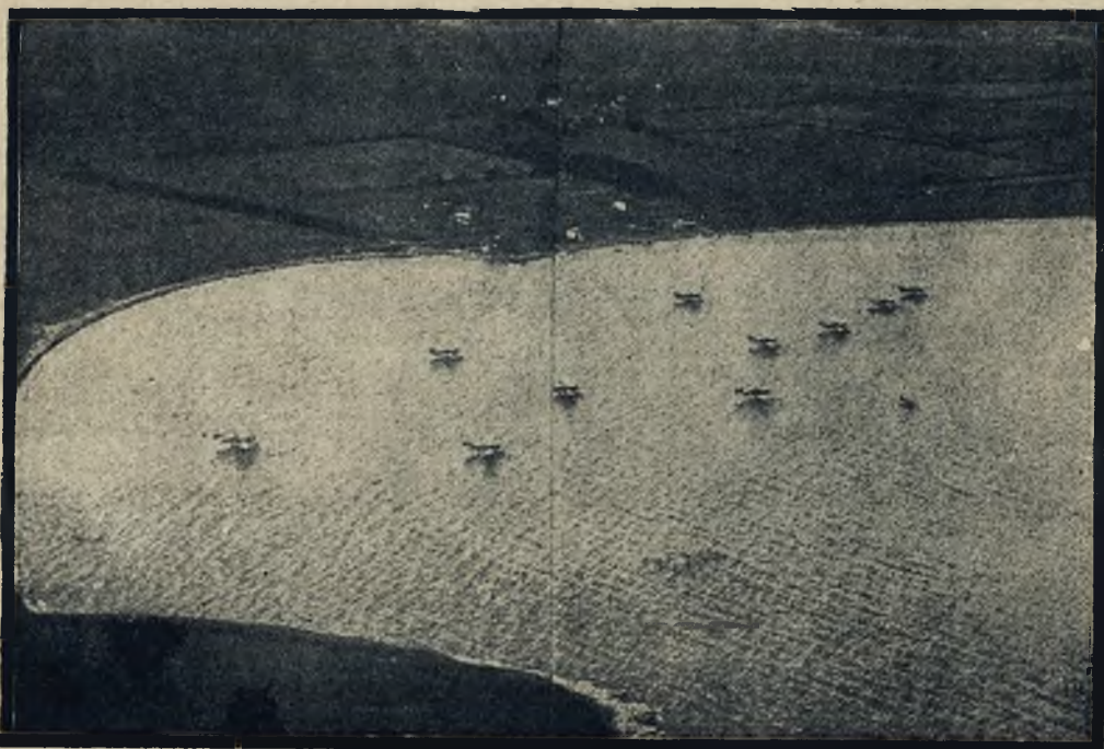
Samoloty amer. eskadry lotn. złożonej z miotaczy bomb i torped, odbyły manewry na Oceanie Spokojnym.