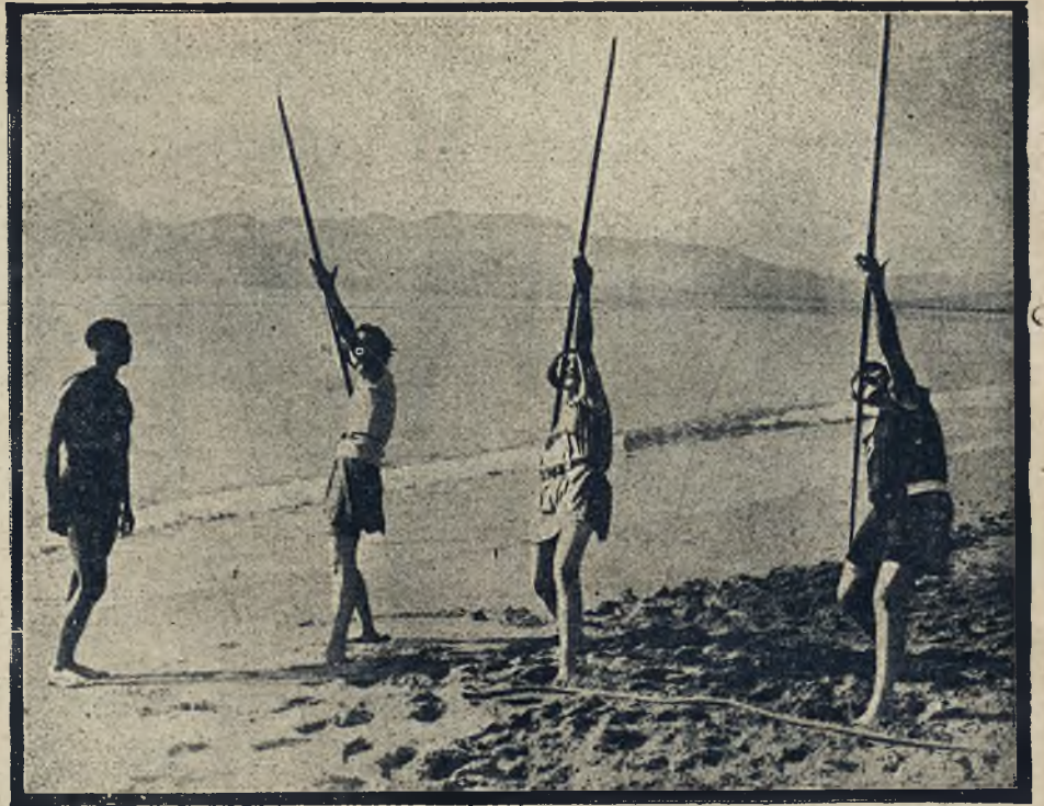
Sporty zimowe w Ameryce. Hokej na lodzie w kostjumach kąpielowych na jeziorze St. Paul w Minneapolis, w Ameryce.