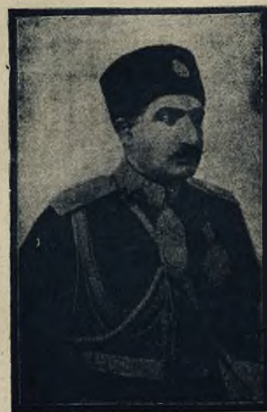
Reza-Khan, zwany Sordar-Sepach, prezydent ministrów i dyktator Persji, który rządzi w miejsce przebywającego w Europie szacha.