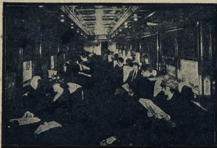
Wytworne urządzenie najnowszych luksusowych pociągów amerykańskich. Rycina nasza przedstawia czytelnię w pociągu.