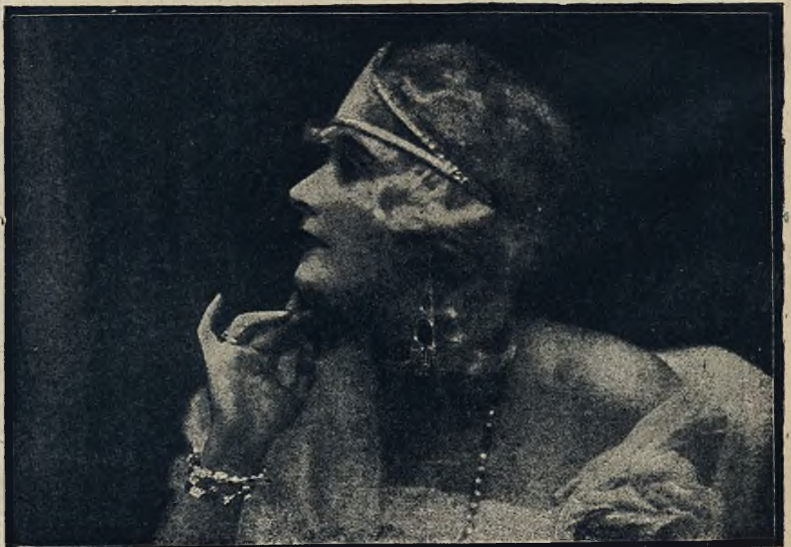
Z krainy mody: Najnowsza biała peruka do sukni wieczorowej, przystrojona dżademem kulczykami.