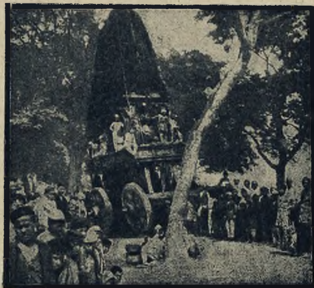
Z życia na dalekim Wschodzie: Malownicza procesja ku czci boga Matsyendre-Nath w Katmandoo, w Indjach.