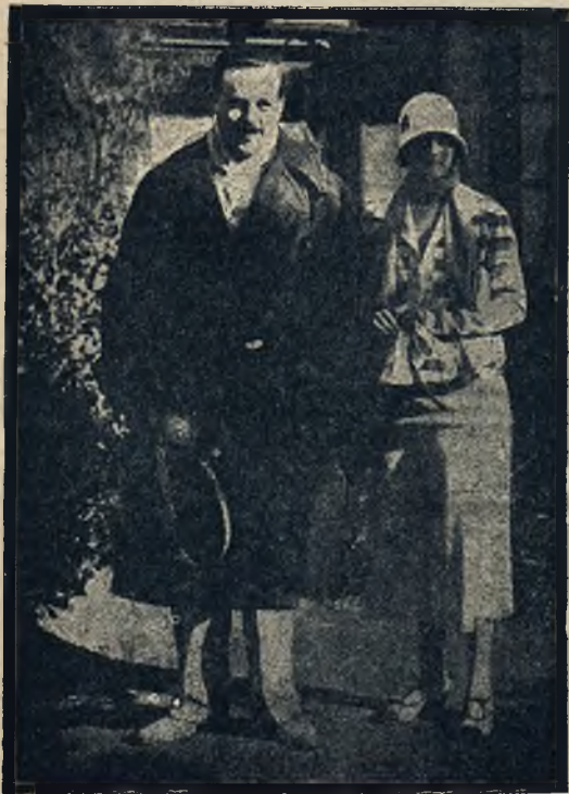
Ex-król Manuel portugalski gra obecnie w tenisa na Riwierze. Obok niego królowa.