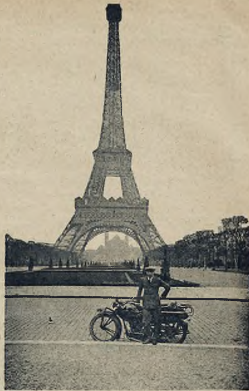
Znany sportowiec lwowski, p. Leon Dubieński, który udał się przed 2 mies. w podróż okrężną motocyklem, przybył 25 marca b. r. do Paryża. — Rycina przedstawia p. D. w Paryżu na tle wieży Eifla.