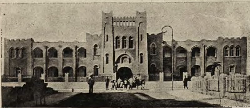
Gimnazjum hebrajskie w Tell-Awiva, największym mieście żydowskim w Palestynie, zbudowanym na piaskach.