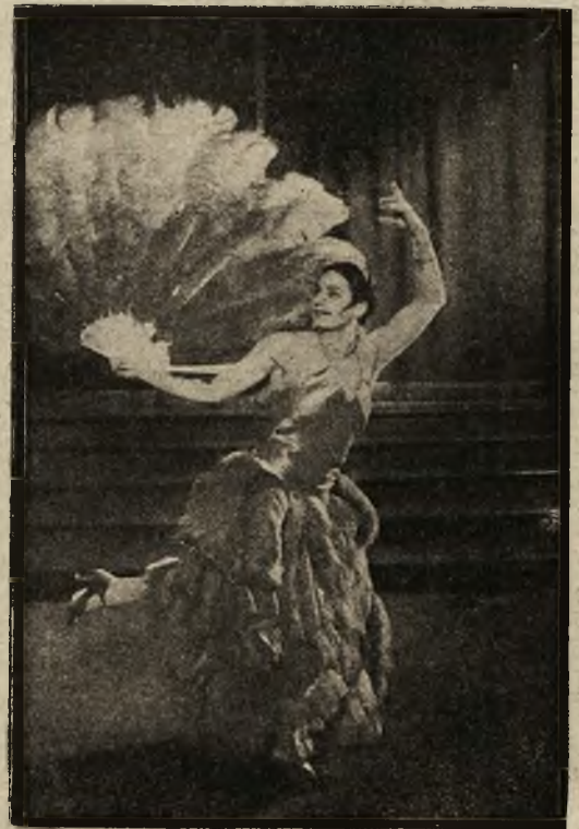
Tancerka panna Terpsichire z kabaretu londyńskiego w drogocennym kostjumie ze strusich piór.