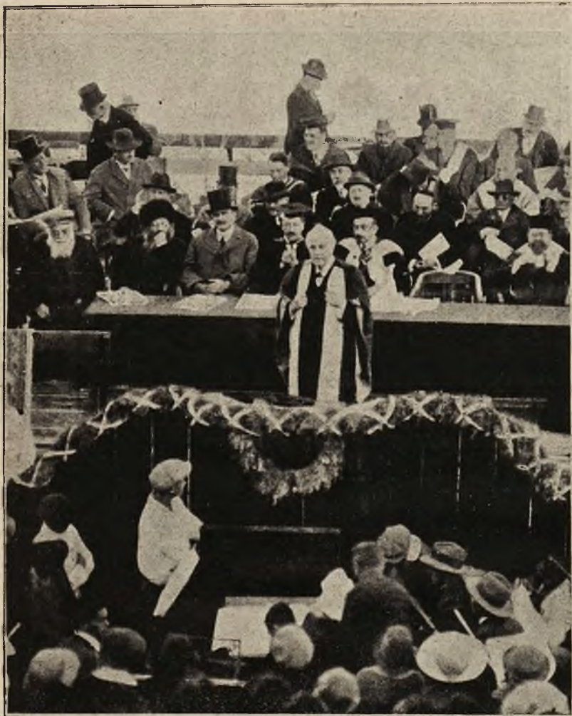
Lord Balfour w Damaszku, przemawia w czasie otwarcia uniwersytetu hebrajskiego w Jerozolimie. Siedzą z lewej: dr. Weizman i lord Allenby.