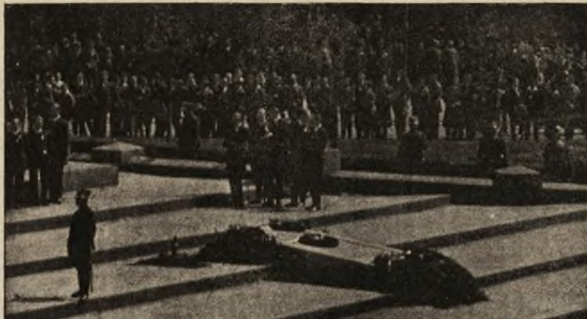
Płyta kamienna z napisem „Nieznanemu Żołnierzowi”, złożona w nocy dnia 3 Maja b. r. przez nieznanych ludzi na stopniach pomnika Mickiewicza na pl. Marjackim we Lwowie.