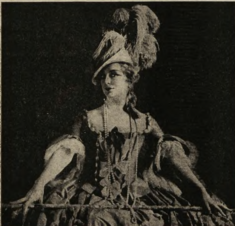
Znakomita artystka francuska, panna Cecylja Sorel z komedji francuskiej, najwybitniejsza dzisiaj aktorka w Paryżu.