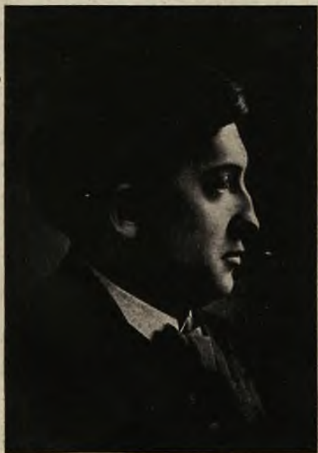
Ludomir Różycki, znakomity polski kompozytor, twórca opery „Casanova“.