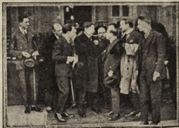
Premier nowego gabinetu francuskiego p. Painlevé, udziela wywiadu dziennikarzom w sprawach aktualnych polityki francuskiej.