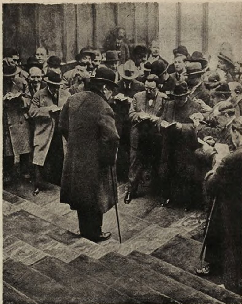
Epizod z codziennego życia politycznego we Francji: Polityk, któremu powierzono utworzenie gabinetu (tutaj p. Briand) udziela wywiadu zgromadzonym na schodach pałacu Elizejskiego dziennikarzom.