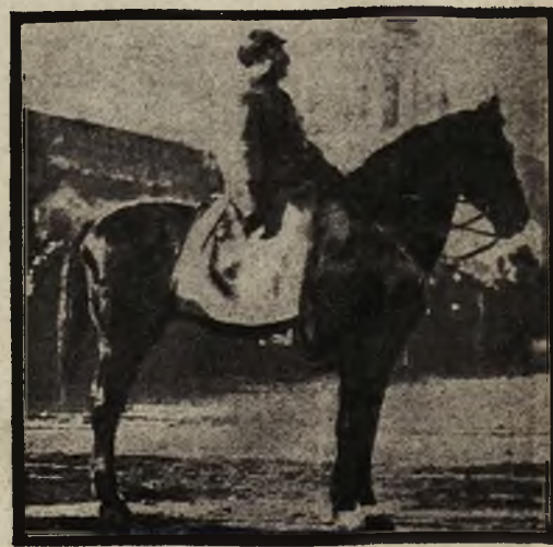
Nowy naczelny dowódca wojsk sowieckich Michał W. Frunze, w czasie parady na Czerwonym Placu.