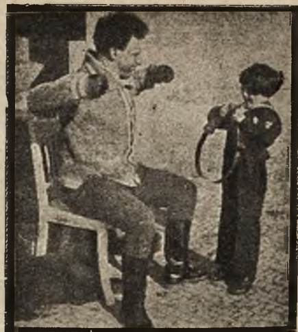
Niezwykły siłacz Zygmunt Breitbart, występujący we Lwowie, trenuje synka w rozrywaniu łańcuchów