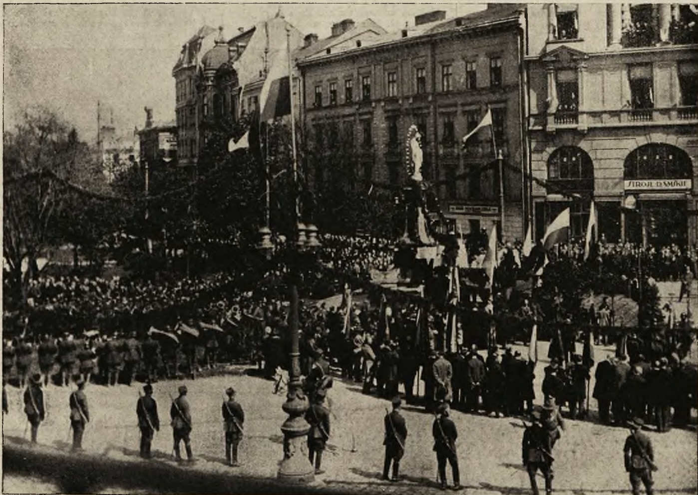
Nabożeństwo na placu Marjackim przed statua Matki Boskiej.