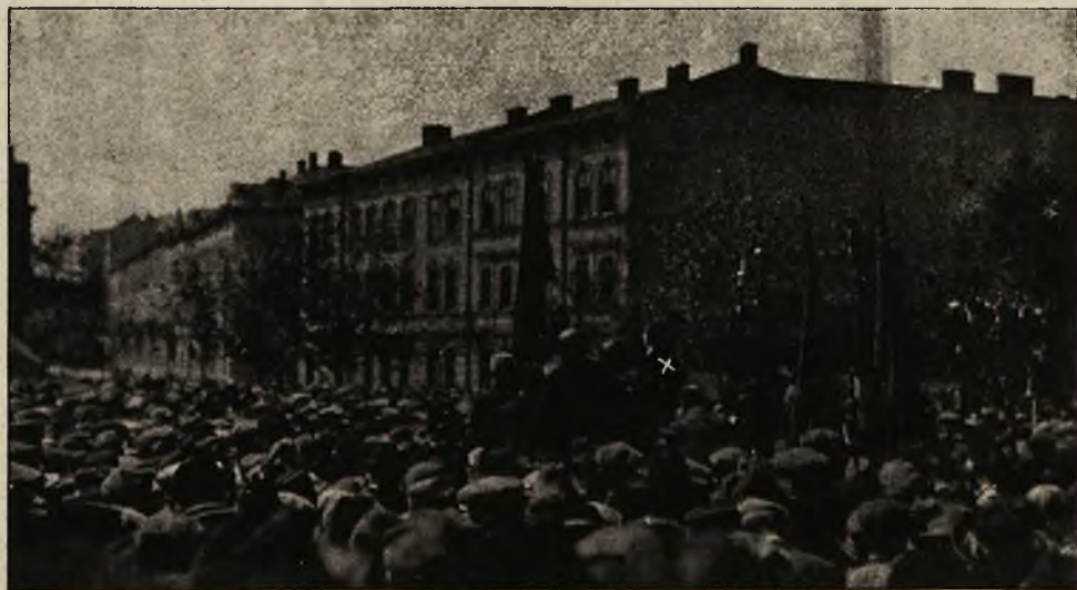
Zgromadzenie robotnicze na placu Gosiewskiego w chwili, gdy przemawia (x) poseł Hausner.