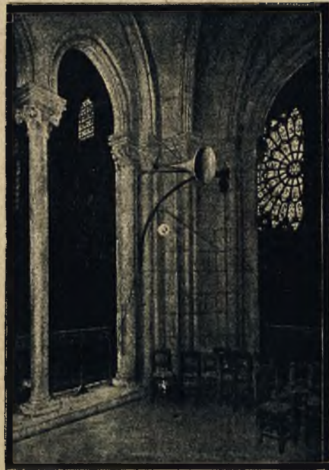
Radjo w kościele Notre Dame w Paryżu, służy do przenoszenia zapomocą tub umieszczonych w nawach kościoła kazania księdza do wszystkich zakątków, zapelnionych słuchaczami.