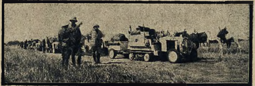
Samochodem przez pustynię Sacharę. Ostatnia wyprawa francuska przez pustynię na postoju w okolicy Tourbanguida.