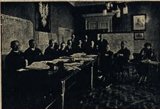
Polsko-węgierska konferencja kolejowa odbyła się niedawno we Lwowie. Obrady toczyły się nad rozszerzeniem komunikacji.