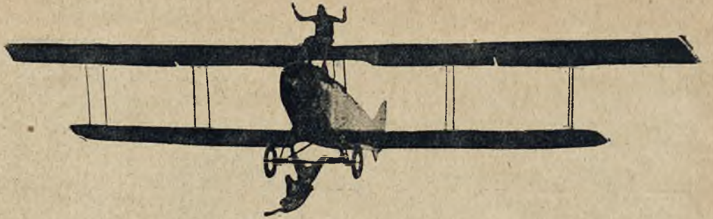
Dreszcz grozy budzące produkcje akrobatów amerykańskich Bud Westa i Auggie Pedlara na samolocie.