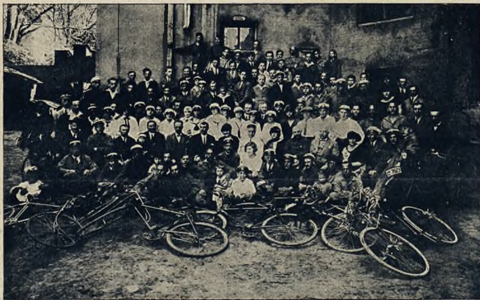
Grupa uczestników uroczystości otwarcia sezonu Lwowskiego Tow. Kolarzy i Motorzystów w dniu 10 maja b. r. na Strzelnicy miejskiej.