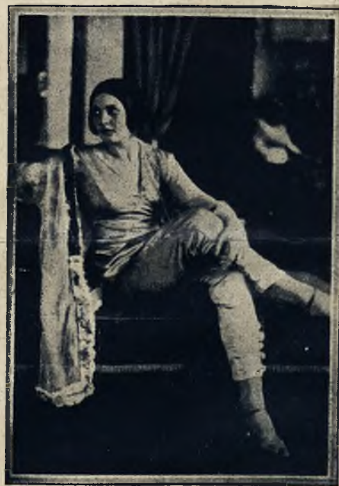
Moda w teatrze: Jedna z artystek teatrów londyńskich w najnowszym „smokingu” dla kobiet.