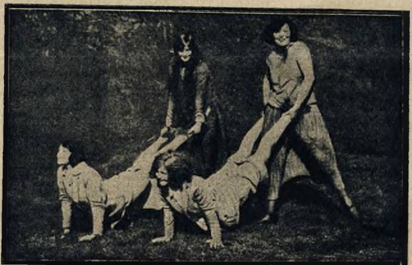
Oryginalne zawody w Ameryce tzw. „taczki“ w czasie święta baletowego w Parku Central w Nowym Jorku.