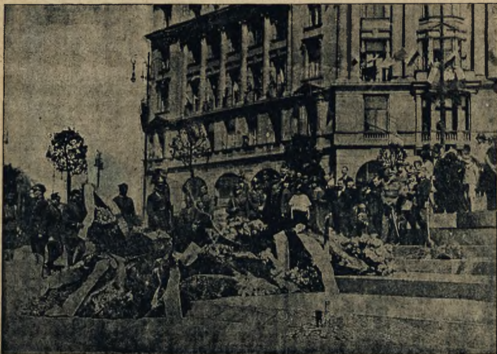
Hold Nieznanemu Żołnierzowi we Lwowie. W niedzielę dnia 10 maja delegacje garnizonu lwowskiego, policji, Związku oficerów rezerwy, inwalidów i gminy Lesienic złożyły wieńce na płycie Nieznanego Żołnierza. Zdjęcie powyższe przedstawia jeden moment tej uroczystości.