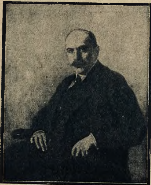
Prof. August Wassermann, sławny badacz na polu medycyny, zmarł niedawno w Niemczech.