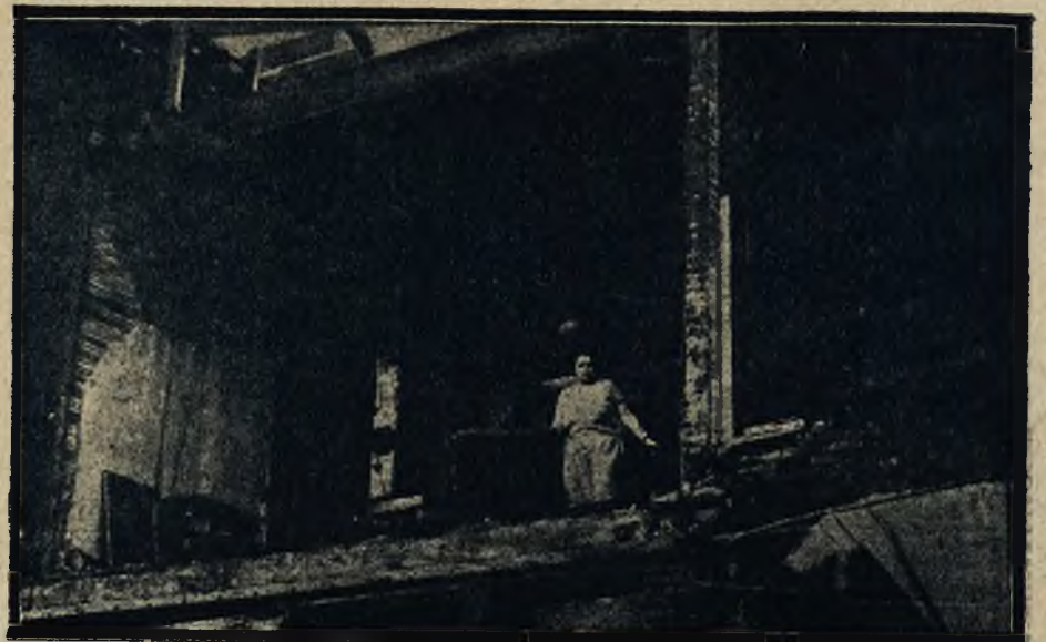
Tornado w Ameryce: Bezdomny mieszkaniec na ruinach rozerwanego wiatrem swego domu.