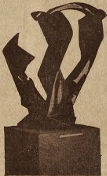
Rzeźba berlińskiego art. Bellinga nazwana „Trójdźwięk“.