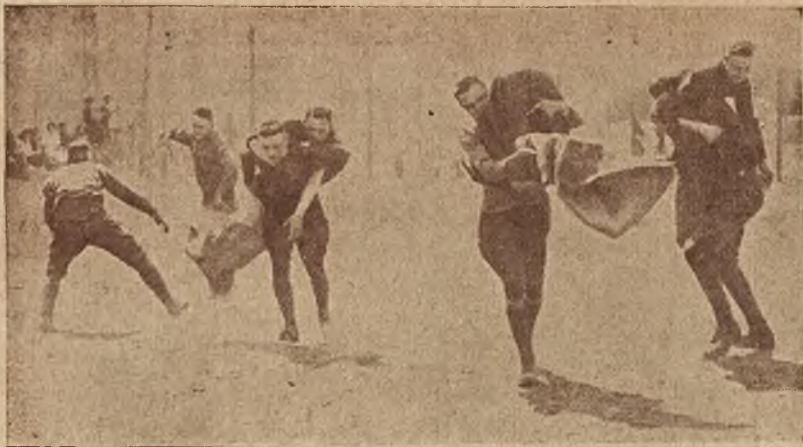
Nowości sportowe. Wścigi w workach, w czasie których biegących muszą nieść na plecach na krótką metę najbliżsi współzawodnicy.