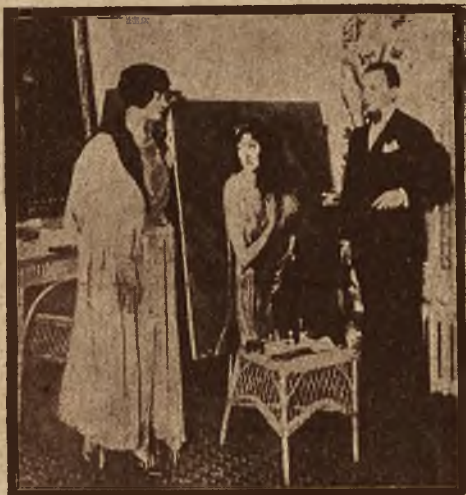
Polski malarz T. Styka utrwalił na płótnie typ piękności amerykańskiej