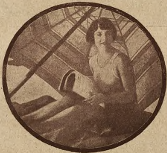
Najulubiejsza, amer. diva filmowa Betty Compson w miejscowości kuracyjnej Miami we Florydzie.