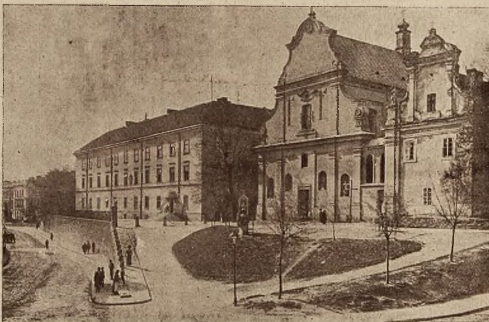
Usiłowany zamach w starym budynku Uniwersytetu: Część budynku w którym dokonano zamachu i kościół św. Mikołaja.