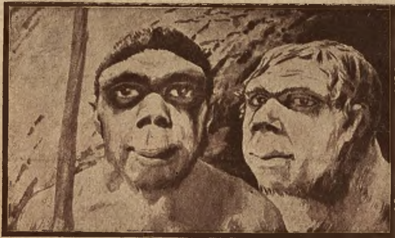
Podobizna pierwszych ludzi, którzy drogą ewolucji wykształcili się z małpy.