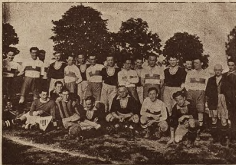
Match Vrsovice—Pogoń, odbył się w ubiegłym tygodniu we Lwowie. Rycina przedstawia obie drużyny.