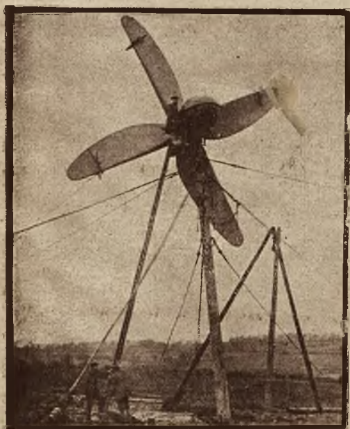
Wiatrak, wytwarzający prąd elektryczny, znajduje się w nowoczesnej farmie koło Oxfordu.