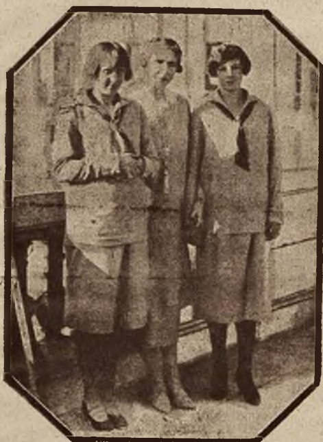
Królowa hiszpańska Wiktorja z dwiema córkami, infantkami Marją Krystyną (z lewej strony) i Beatrix, na balkonie zamku królewskiego w Madrycie.