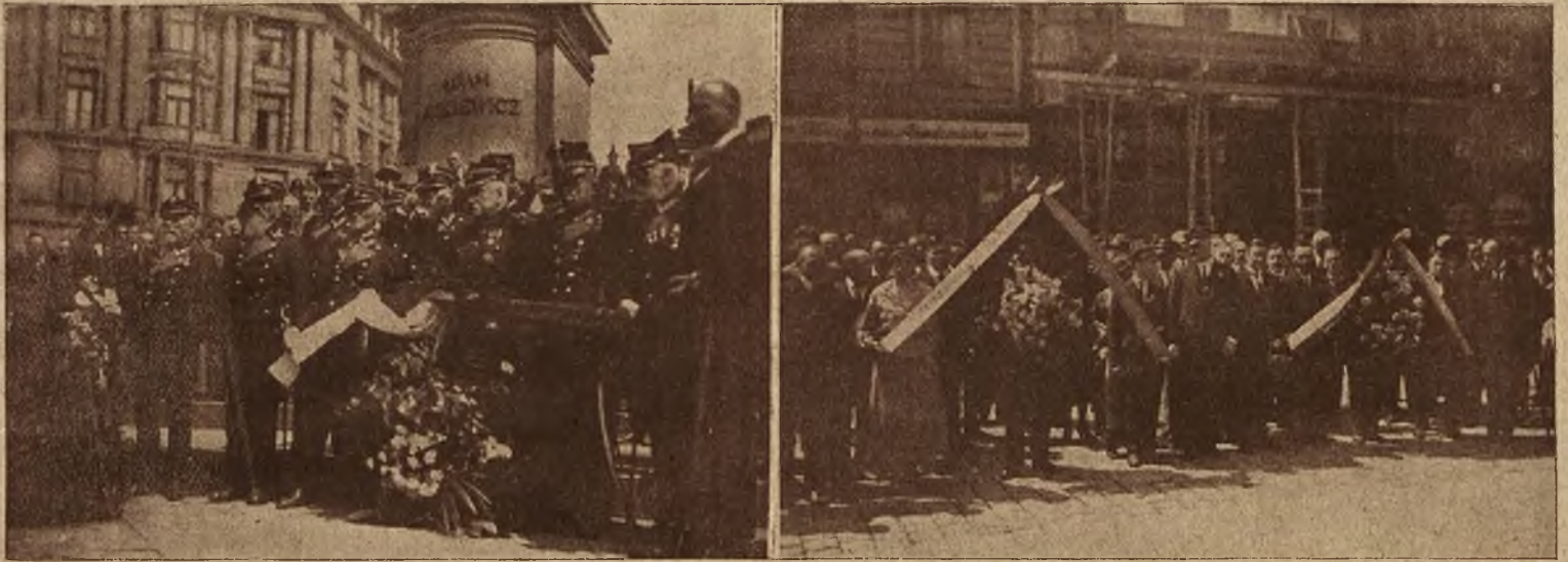
Wieńczenie płyty Nieznanego Żołnierza przez Powstańców 1863 r., obrońców Lwowa oraz inwalidów.