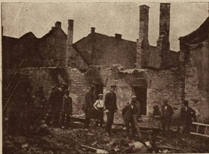
Straszny pożar na Bogdanówce we Lwowie, dnia 18-go maja b. r. Jeden ze spalonych budynków.