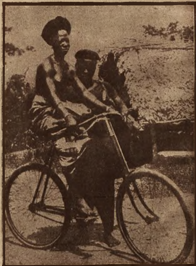
Zwycięstwo cywilizacji. Murzynka z plemienia Goło w Afryce uczy się jazdy na rowerze.