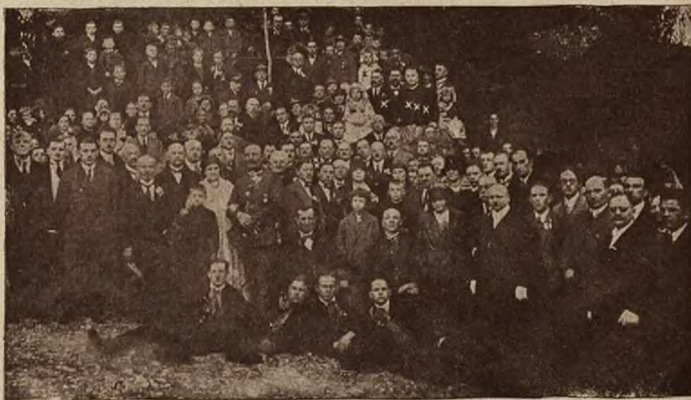
Obrońcy Lwowa na Górnym Śląsku: grupa obrońców Lwowa z miejscową ludnością na Kalwarji w Wielkich Piekarach.