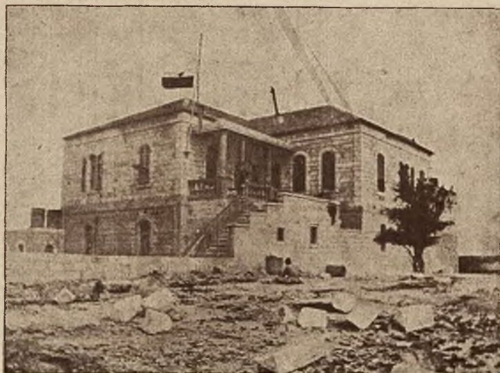
Konsulat polski w Jerozolimie.