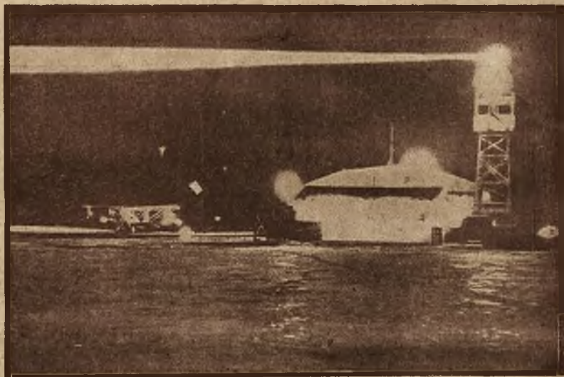
Miejsce dla lądowania samolotów w Joura City, w Stanach Zjednoczonych oświetlone w nocy silnymi reflektorami.