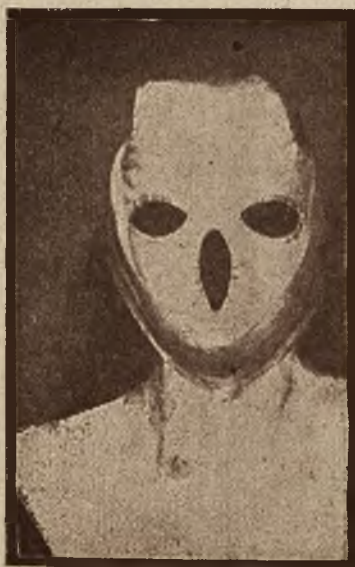
Maska chemiczna w pracowni chemicznej w czasie dokonywania niebezpiecznych eksperymentów.