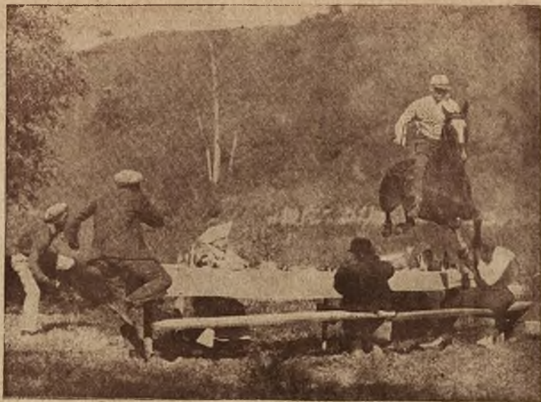
Ze świata kinematografji: Skok przez stół z biesiadnikami. Doskonałe zdjęcie z miasta filmowego Hollywood w Ameryce.