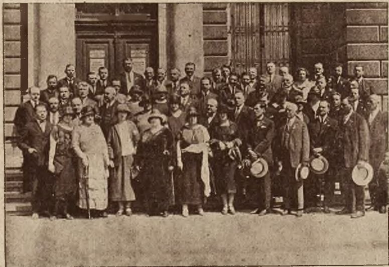
Wycieczka rumuńskich kolejarzy we Lwowie. Rycina nasza przedstawia gości rumuńskich przed Muzeum Przemysłowym