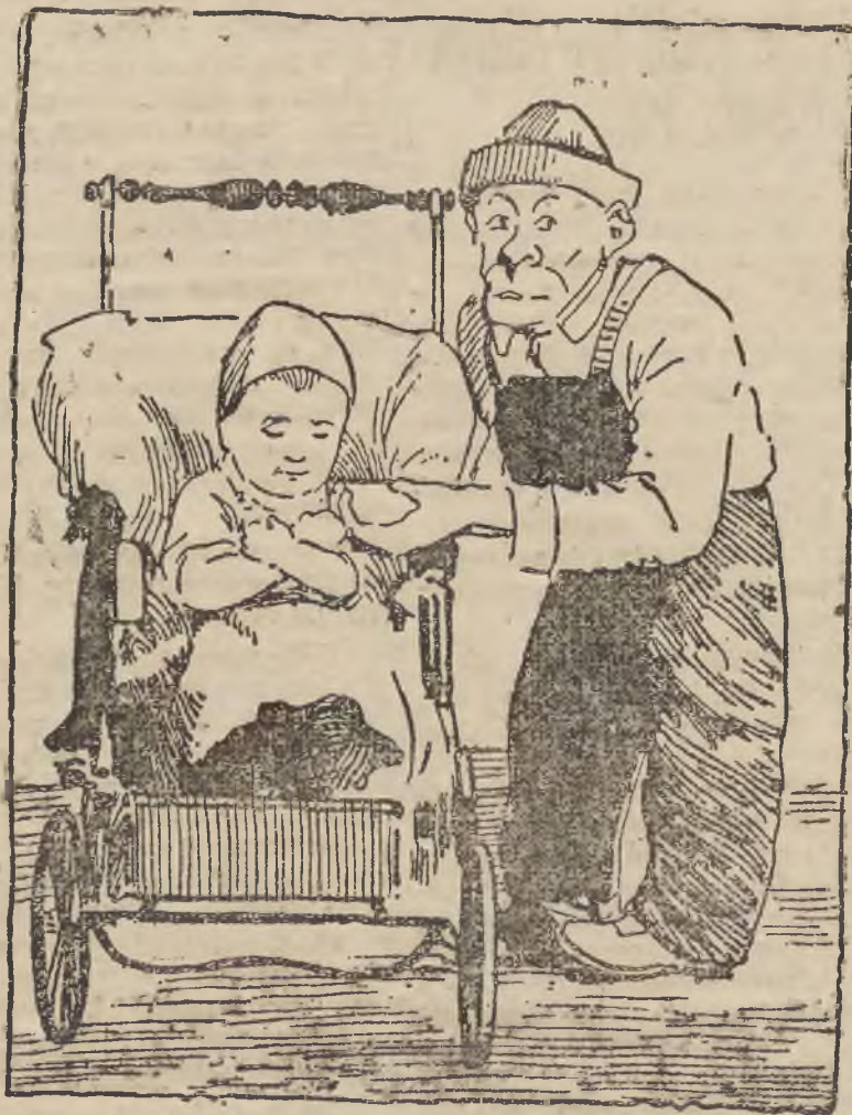
Szympan, jako niania, gra z powodzeniem swoją rolę do filmu długiego 100 tys. m.