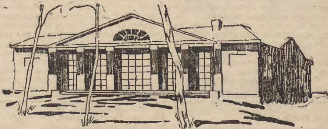
BUDYNEK ADMINISTRACYJNY D. TARGOWY W SCHODNICH.

Paryż. (Pat) Włoski poseł w Paryżu doręczył rządowi francuskiemu notę swego rządu z propozycją porozumienia się z rządem Rosji, w celu wysłania przedstawiciela na konferencję w Wenecji, na którą ma również wysłać przedstawicieli Grecja i Portugalia. Zadaniem tej konferencji będzie omówienie preliminarzów pokojowych. Podobną notę wysłano również do rządu greckiego. Jeżeli Angora nie postawi niemożliwych warunków, konferencja odbędzie się w drugiej połowie września.