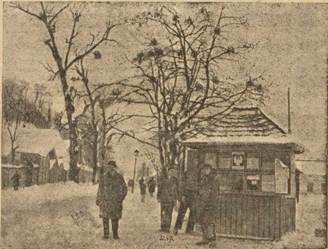
(d.) Powyższe zdjęcie przedstawia widok (od ulicy Kopernika) ulicy Pełczyńskiej, pokrytej grubą powłoką śniegu. Widoczne na rycinie stare drzewa są po raz ostatni świadkami wesołej rozrywki na sąsiednim torze żywiarskim L. T. Ł., z wiosną bowiem będą ścięte z powodu przeprowadzenia tamtędy linii tramwajowej. Na pierwszym planie ryciny budka inwalidzka Br. Patynka.