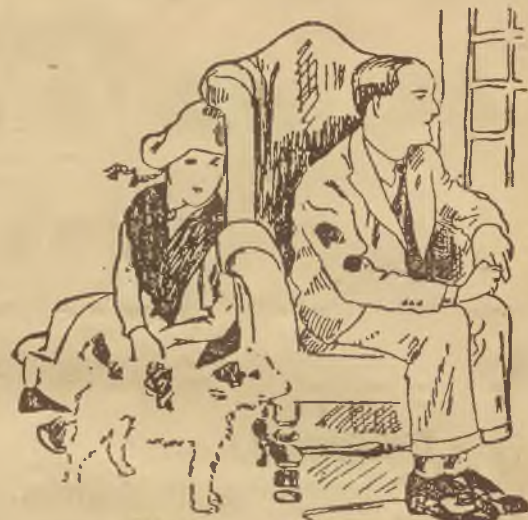
Marion Davies — Owen Moore