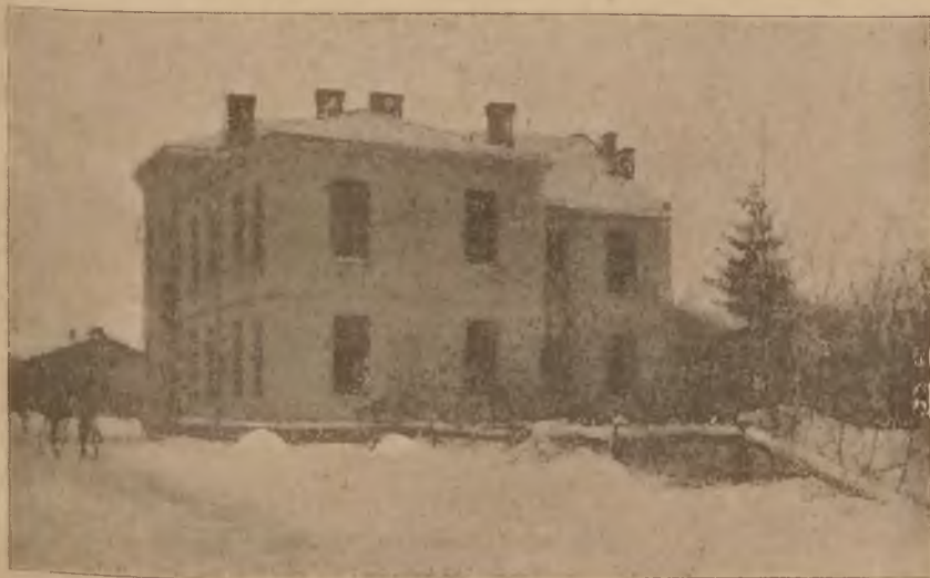
Dom Polski T. S. L. w Grzymałowie.

mój lud i odruszczać go. Do pieśni polskiej wielką wagę przykładałem. Dla dzieci szkolnych kazałem wydrukować śpiewniki nabożne — a organiście poleciłem naukę pieśni pobożnych w szkole. Zrazu nauczyciele się zżymali, że organista niby w skład ich wchodzi — ale z czasem przyzwyczaili się do niego, a mnie było przyjemnie, że dziatwa szkolna podczas mszy św. już po polsku śpiewać się nauczyła. Nie mając funduszu, dla ludu parafialnego kazałem wydrukować na kartkach pieśni pobożne i świeckie. Pobożnych pieśni