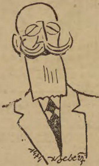
senator Ch. Nar. p. Stecki.