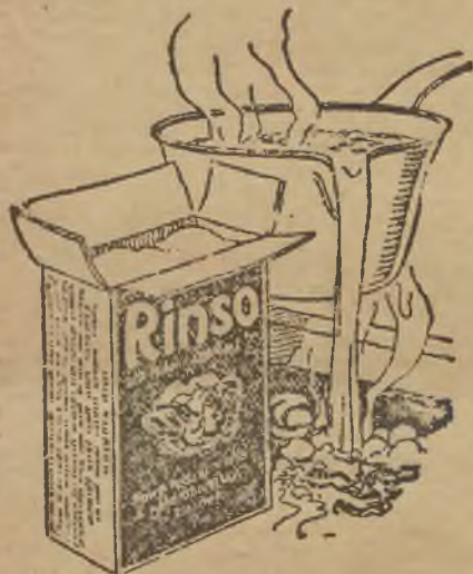
Sprzedaż w zielonych paczkach. Lever Brothers Limited, Anglia.

BARANICA , dryling, sztućcer do sprzedania. Kochanowskiego 42, I piętro — drzwi 5. Oglądać od 4—6 popołudniu. 40677