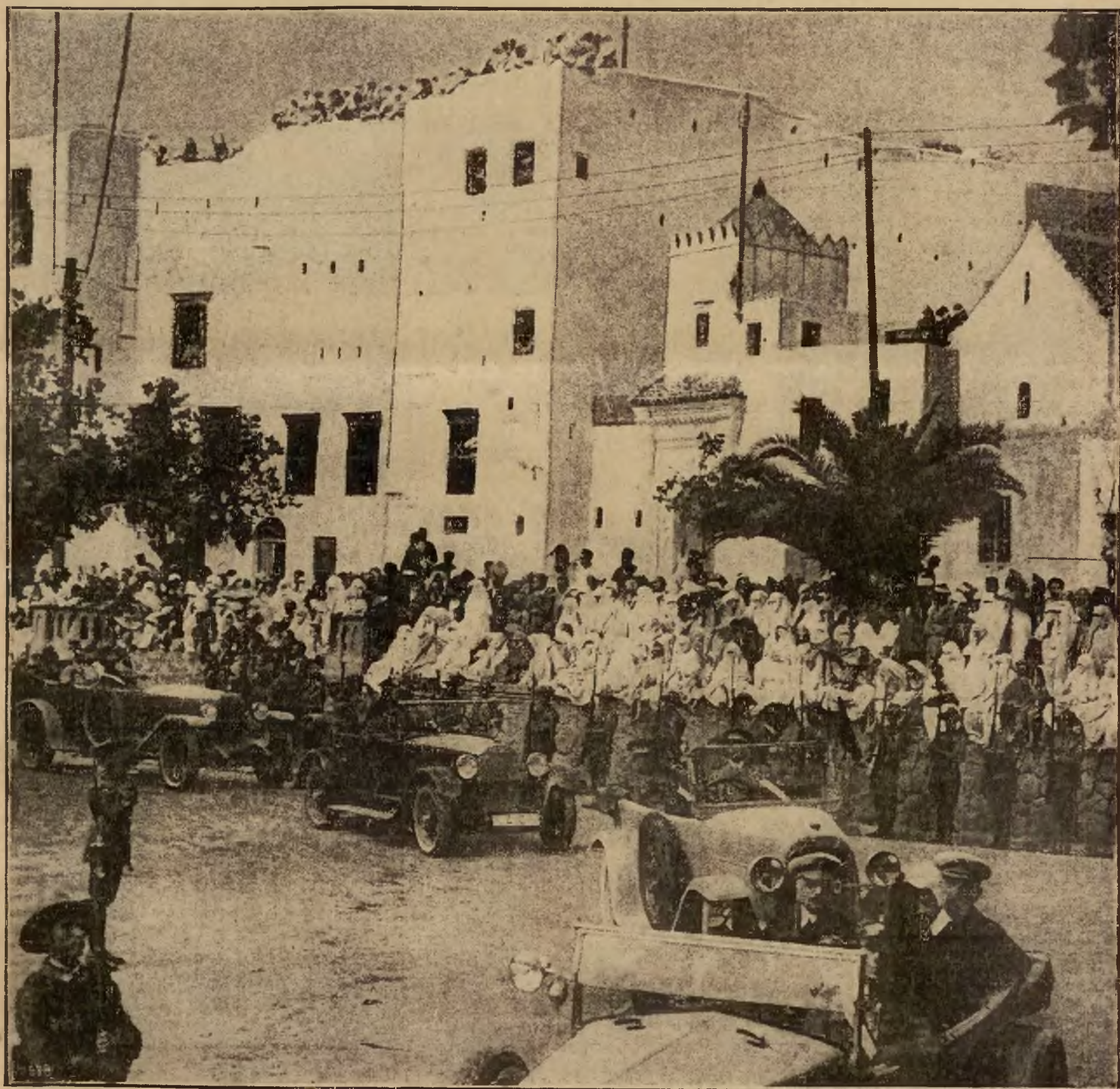
Po zwycięskim zakończeniu wojny w Marokku odwiedziła niedawno hiszpańska para królewska Tetuan, stolicę hiszpańskiej strefy wpływów w Maroku. Król Alfons i królowa zostali przyjęci przez arabską ludność bardzo serdecznie. Rycina nasza przedstawia malowniczy widok przyjęcia pary królewskiej.