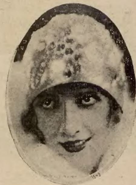
Uroczą artystką filmową Kathryn Carver, która wyszła z zamąż za znanego komika Adolfa Menjou.