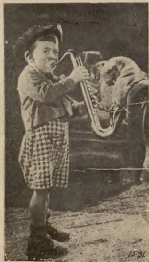
W nowojorskim teatrze dziecięcym gra mały „Harry“ po mistrzowsku na saksofonie.