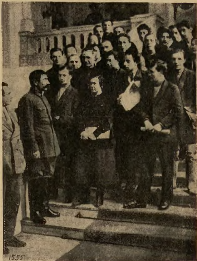
Ataman Budienny, znany z wojny polsko-bolszewickiej, obecnie naczelny wódz jazdy bolszewickiej, przyjmuje w Moskwie młodych komunistów.