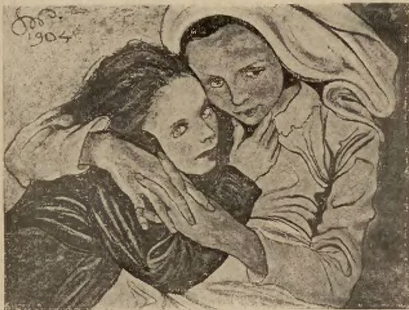
Z twórczości malarskiej Stanisława Wyspiańskiego 1) (w górze) słynny witraż „Polonia”, przedstawiający Polskę w niewoli, który był wykonany przez „artystę dla Lwowa. 2) jeden z najbardziej znanych obrazów pastelowych „Caritas”.