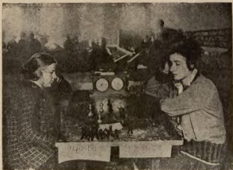
Walka o mistrzostwo gry w szachy w Rosji sow.: 2 uczestniczki zawodów w moskiewskim domu robotniczym w czasie rozgrywania partii.