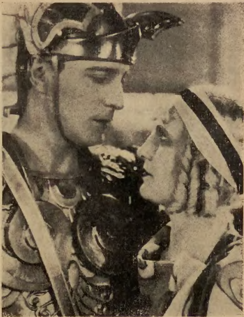
Maria Corda jako Helena i Ricardo Cortez jako Parys w najnowszym filmie „Życie prywatne Heleny Trojańskiej”.