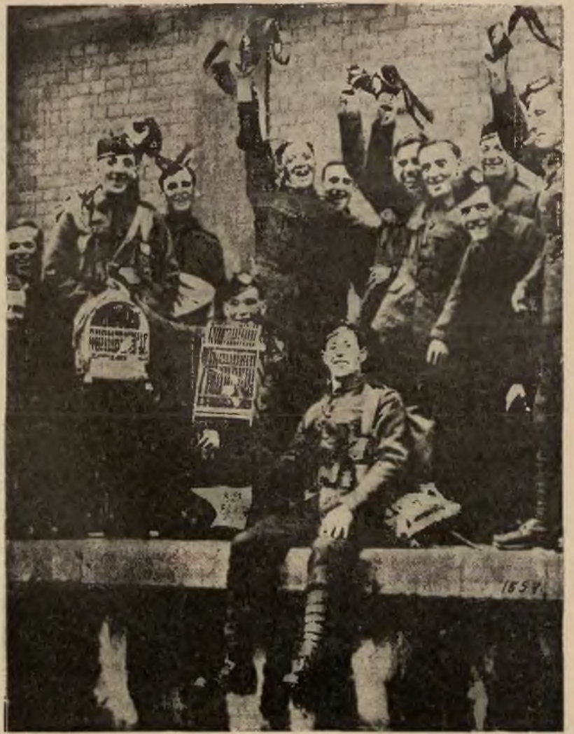
Wojna w Chinach. Strzelcy szkoccy, którzy brali udział w ekspedycji anglo-chin, wracają do Anglii, wioząc z sobą na pamiątkę chińskie słowniki.