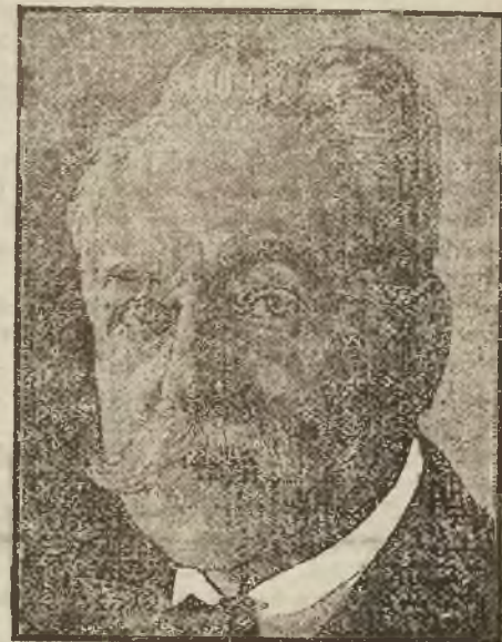
General Sarrail, franc. gubernator.

i oborach. Znalezione 20 zabitych i kilkanaście rannych koni oraz tylec krów. Z całej wsi pozostał jeden kof.