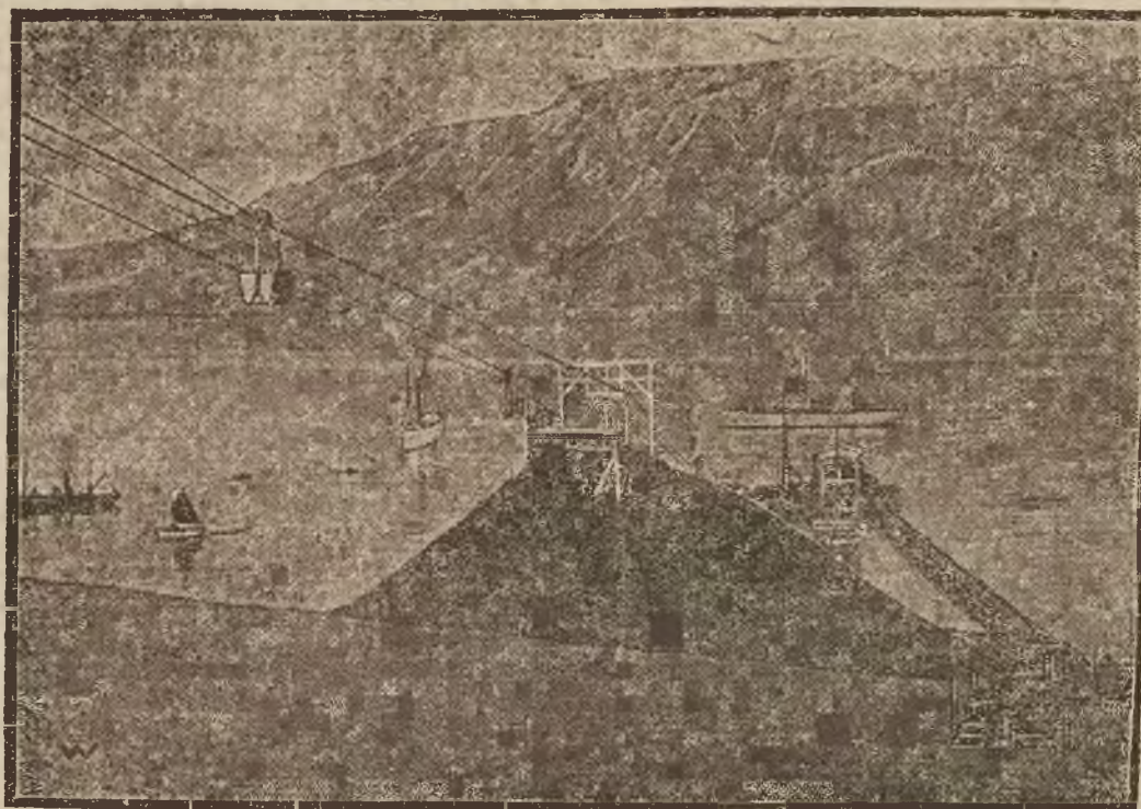
Rząd norweski zajął w tych dniach oficjalnie Spitzberg. Rycina nasza przedstawia jeden z portów tamtejszych.