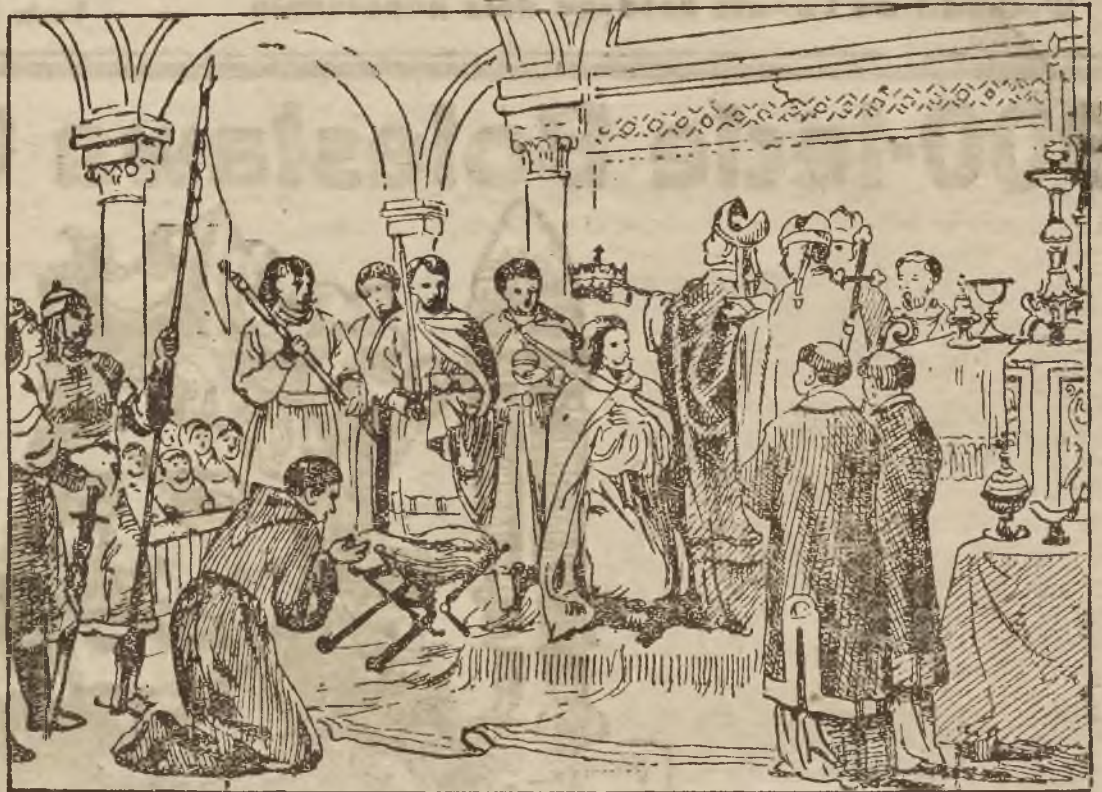
Koronacja Bolesława Chrobrego.

Oto po dziewięciu wiekach zjawia się przed oczyma duszy polskiej ta potężna, promienna, aureolą sławy i zasług dziejowych owiana postać Mocarza - Króla! Postać Ry-