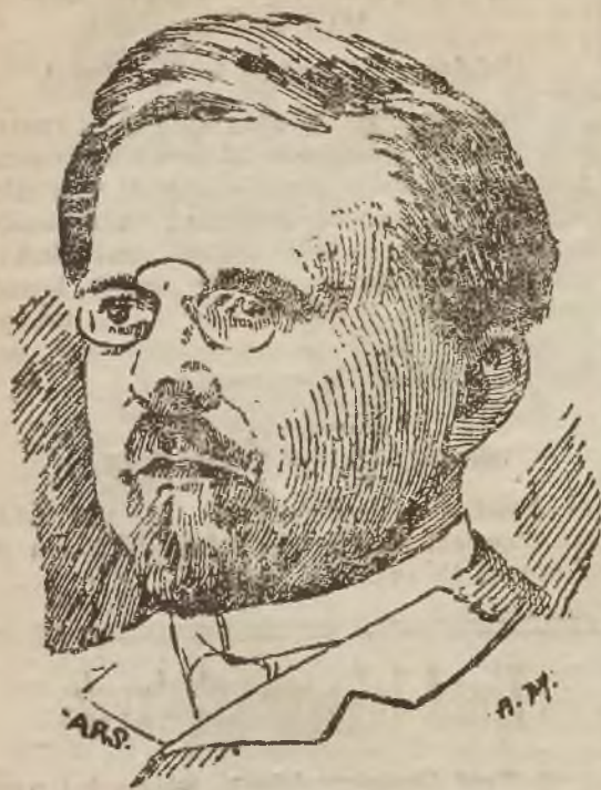
STAN ZDROWIA REYMONTA