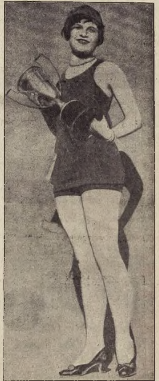
Sezon kąpielowy w Ameryce: Zdobywczyni I. nagrody w Konkursie piękności nimf morskich.