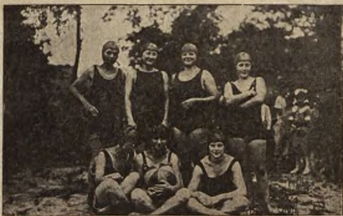
Z ostatnich zawodów pływackich na Świtezi: Sekcja Pań lwow. A. Z. S.