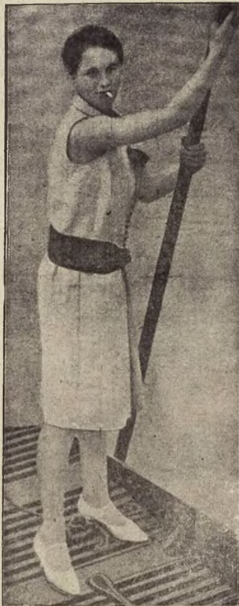
Dzisiejszy sport kobiecy: Gładkie uczesanie, krótka sukienka, krótkie rękawy, papieros w ustach.