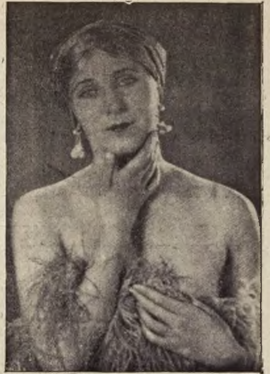
Słynna artystka filmowa Marja Corda.