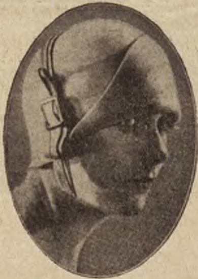
Modny kapelusz zapięty na sprzączkę.