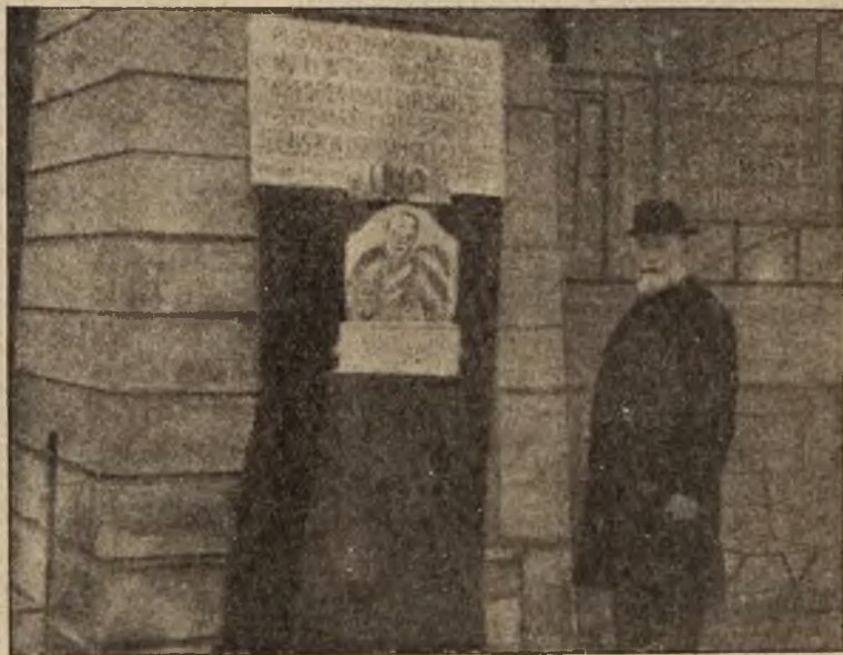
Jeden z rzeźbiarzy francuskich, któremu odmówiono przyjęcia rzeźb na wystawę Akademii, urządził wystawę swych rzeźb przed drzwiami Salonu.