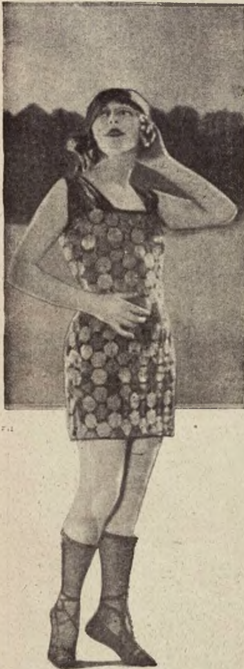
Najmodniejszy kostjum kąpielowy z jedwabnego, haftowanego trykotu.