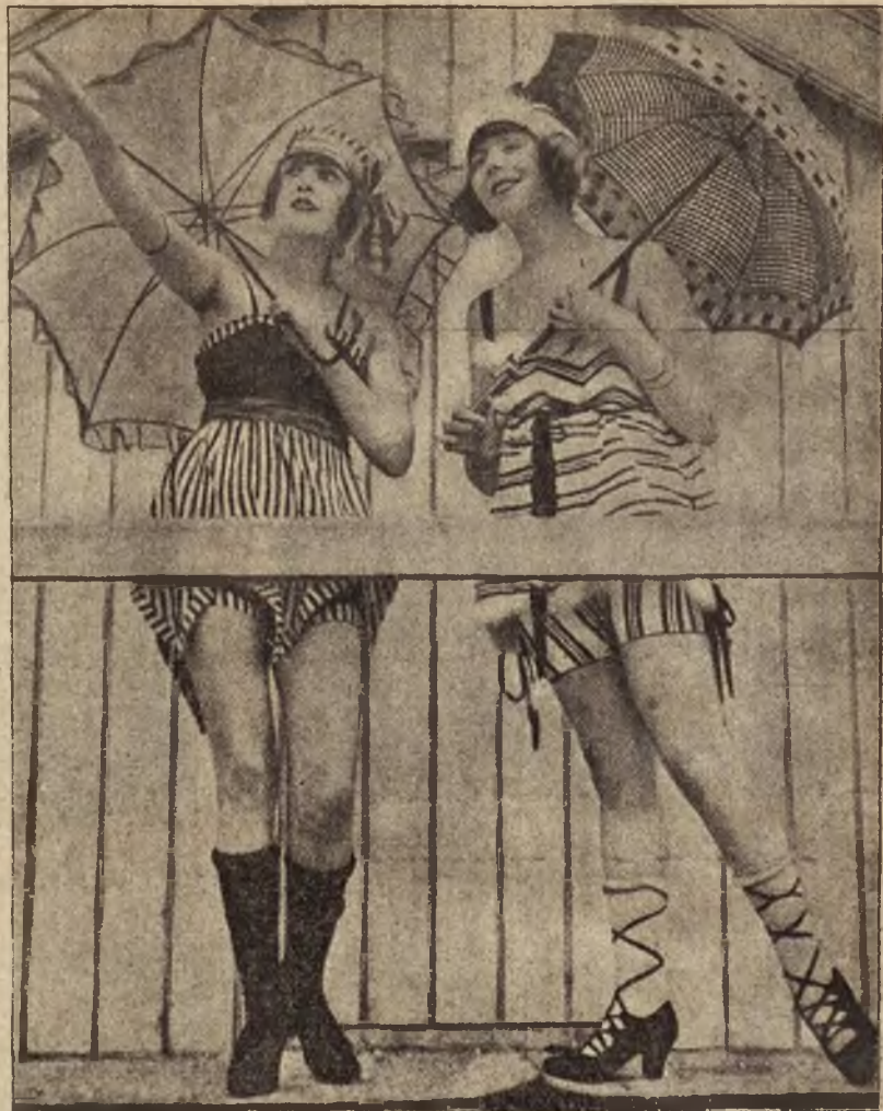
Najmodniejsze kostjmy kąpielowe.