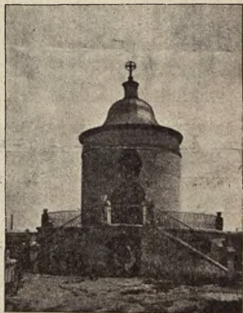
Kaplica i grobowiec ofiar masowego mordu ukraińskiego w Złoczowie.