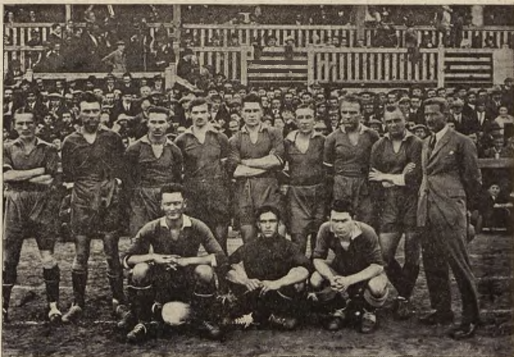
L. K. S. „Pogoń“ zdobył po raz trzeci zaszczytny tytuł Mistrza Polski w piłce nożnej.