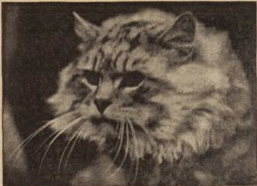
Wspaniały kot Angora.