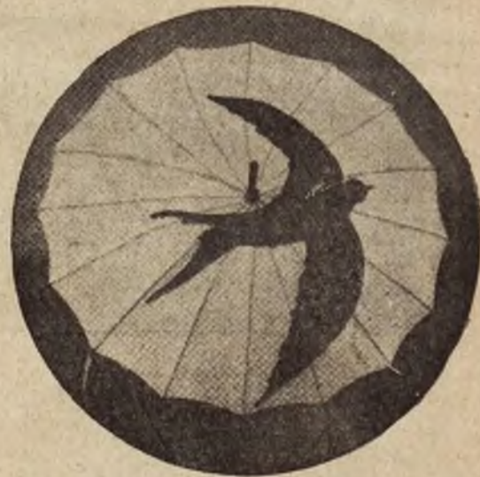
Jaskółka na parasolce, ostatni „krzyk mody“ ang.