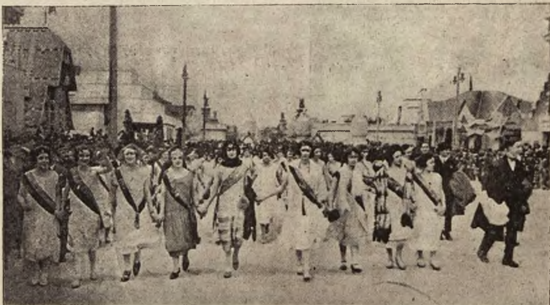
Święto prowincyj francuskich na Wystawie sztuk dekoracyjnych w Paryżu: Królowe Paryża.