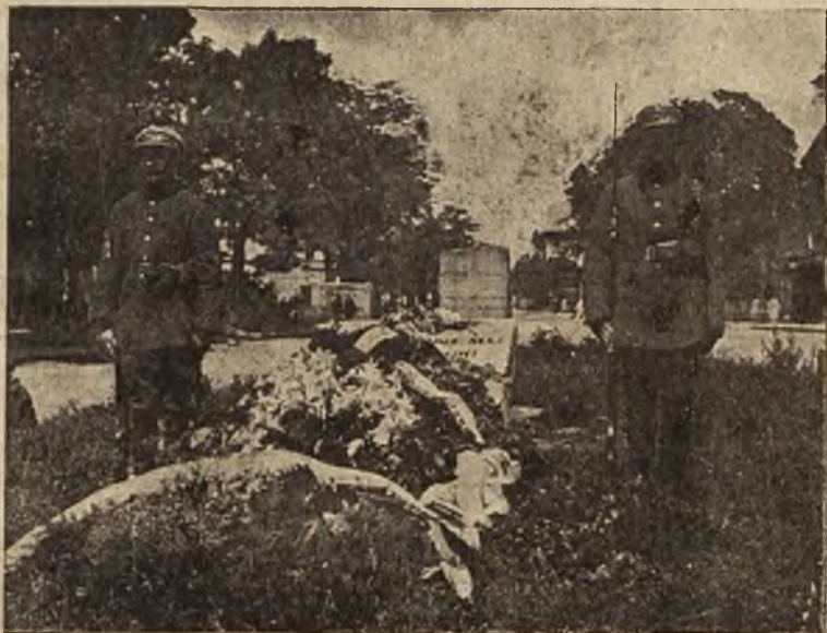
Honorowa straż Tow. strzeleckiego przy płycie „Nieznanego Żołnierza” w Tarnopolu.