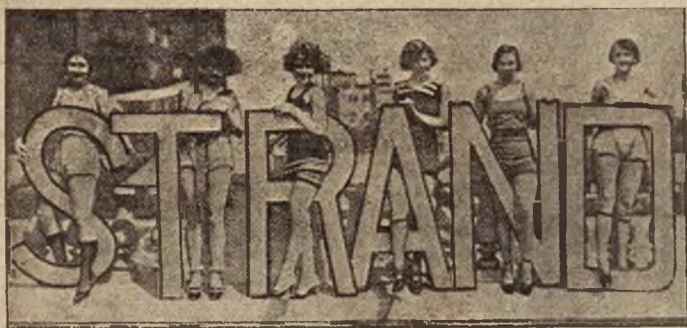
Żywa reklama jednego z amerykańskich hoteli nadmorskich.