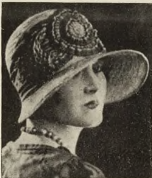
Letni kapelus z borty słomianej.