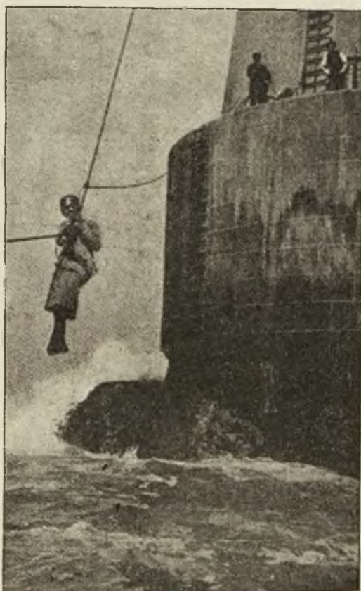
W jaki sposób można dostać się na latarnię morską?