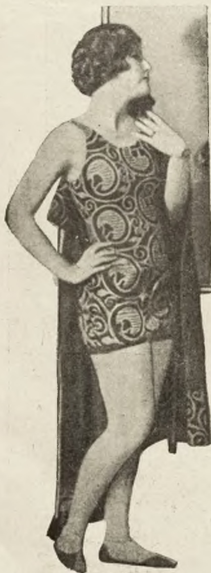
Modny, kostjum kąpielowy z jedwabnego trykotu z krzyżkowym haftem.