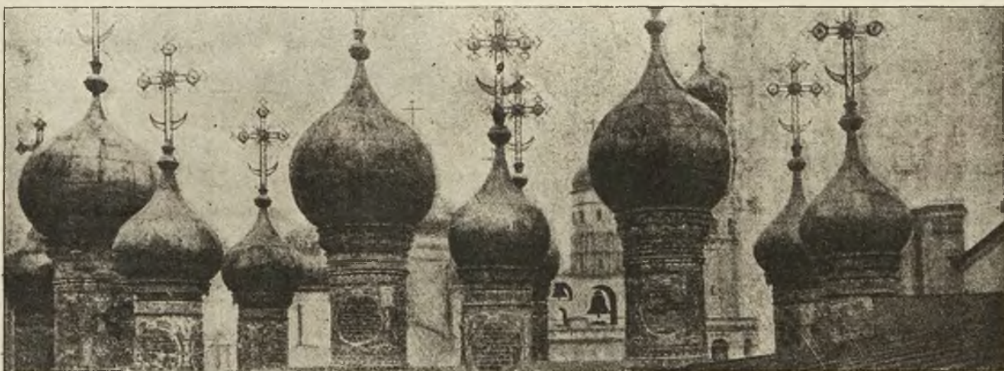
Kopuły na Kremlu w bolszewickiej Moskwie.