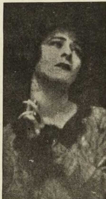
Królowa ekranu: Alla Nazimowa.