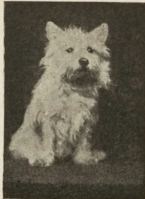
Modne psy: Westhighland-Terrier.