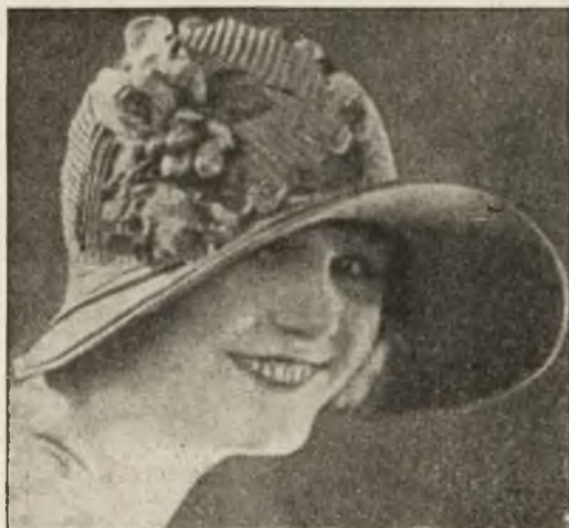
Letni kapelus z borty słomianej.