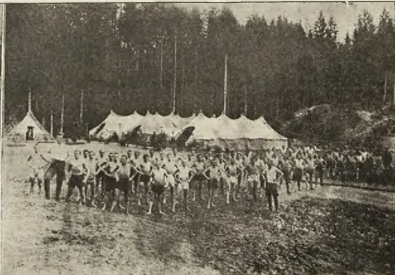
Poranna gimnastyka II. obozu.