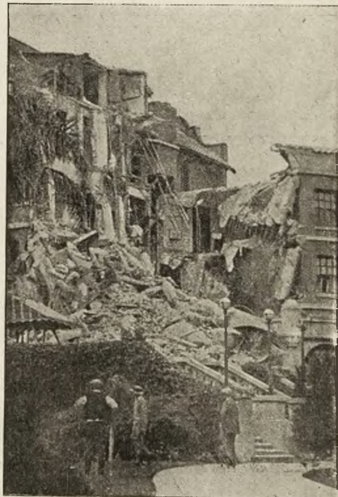
Kalifornijskie miasto San Barbara, zwane „Amerykańską Mentoną“ uległo trzęsieniu ziemi. Rycina nasza przedstawia ruiny hotelu „Kalifornja“ oraz kilkupiętrowego, monumentalnie zbudowanego gmachu.