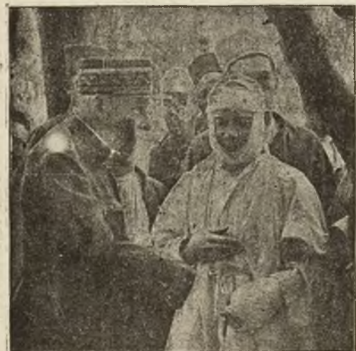
Z placu boju w Marokko: General Pau zwiedza szpital wojskowy w Casablance.