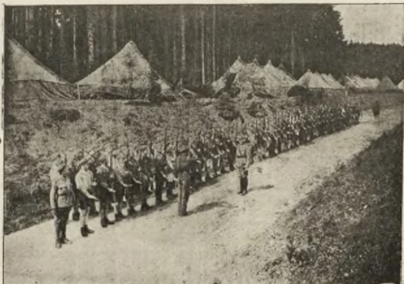
Raport III. obozu.