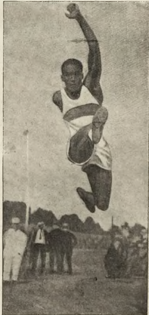
Murzyn Hublard, mistrz świata w skoku w dal.