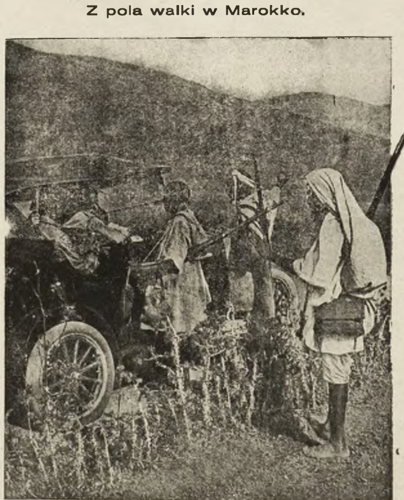
Partyzanci, udzielający informacji oficerom wojsk francuskich.