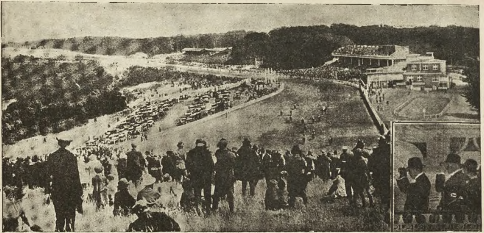
Wyścigi konne w Anglii: Arena wyścigowa w czasie zawodów w Goodwood. Z prawej strony król angielski Jerzy przygląda się przez lornetkę wyścigom.