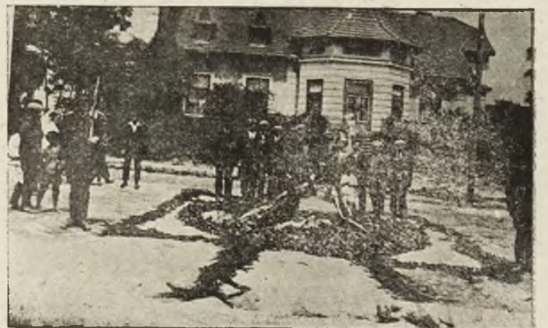
Grób „Niezanego Żołnierza“ w Czortkowie.