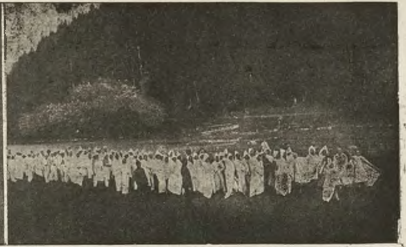
Ku-Klux-Klan w Polsce? Nie, nie jest to żadna tajemnicza sekta, ale uczestnicy obozów, udający się do Oporu dla prania prześcieradeł.