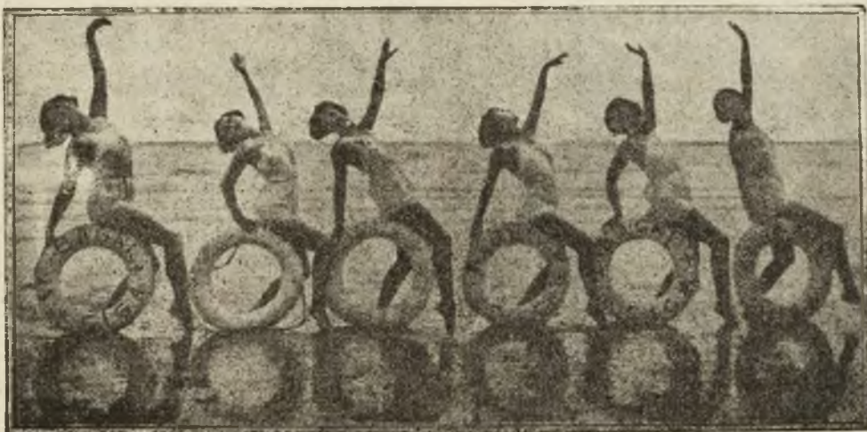
Wyczasy na morzu: Balet na wodzie.