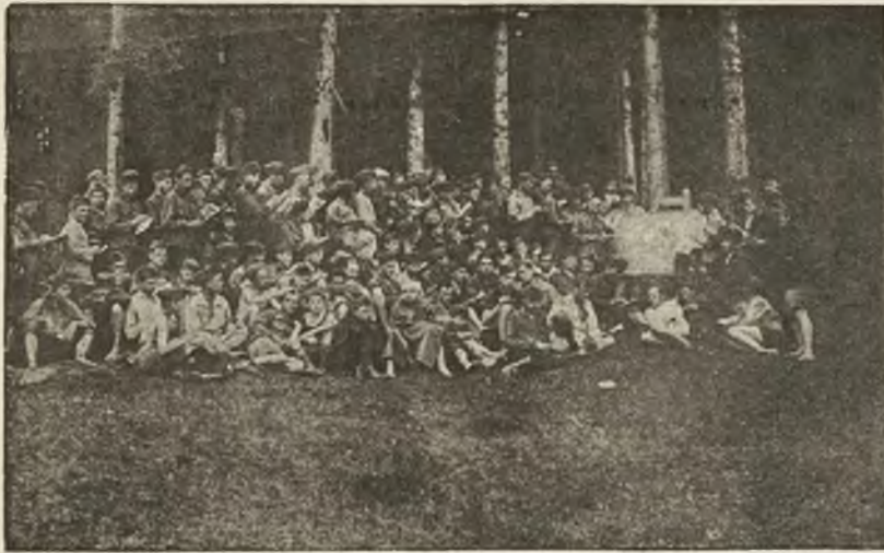
Nasza młodzież w obozach wojskowych nad Oporem: Wykład o służbie łączności w obozie II-gim w Skolem.