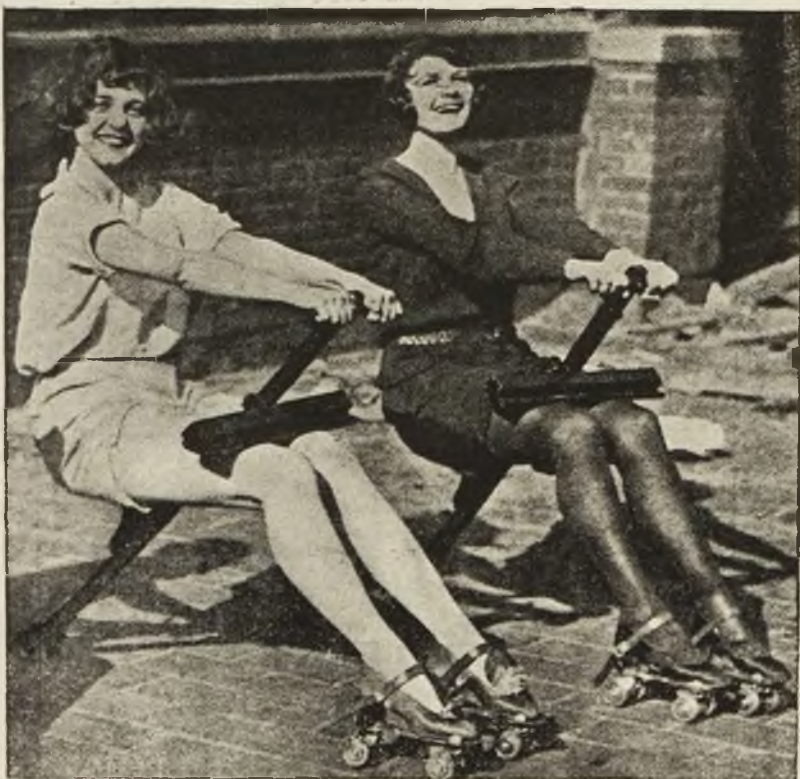
Ćwiczenia na nowych aparatach sportowo-gimnastycznych.