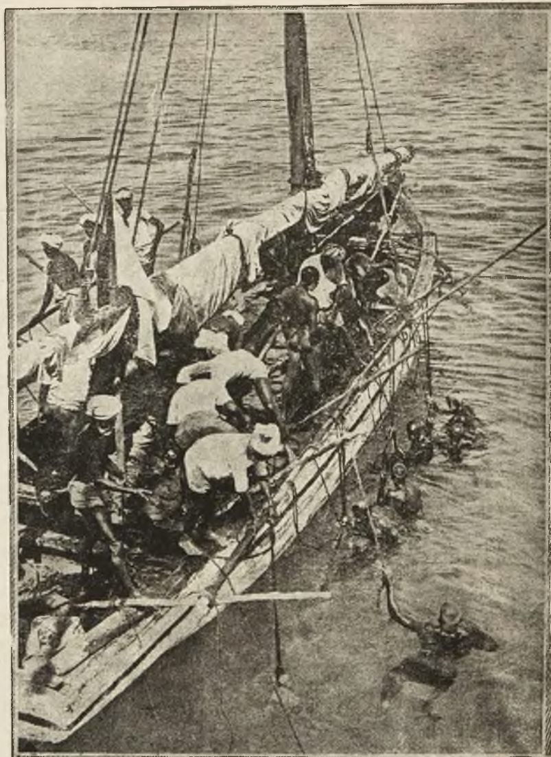
Polawiacze pereł w Indiach, gotowi do zanurzenia się w morzu celem szukania kosztownych muszel.