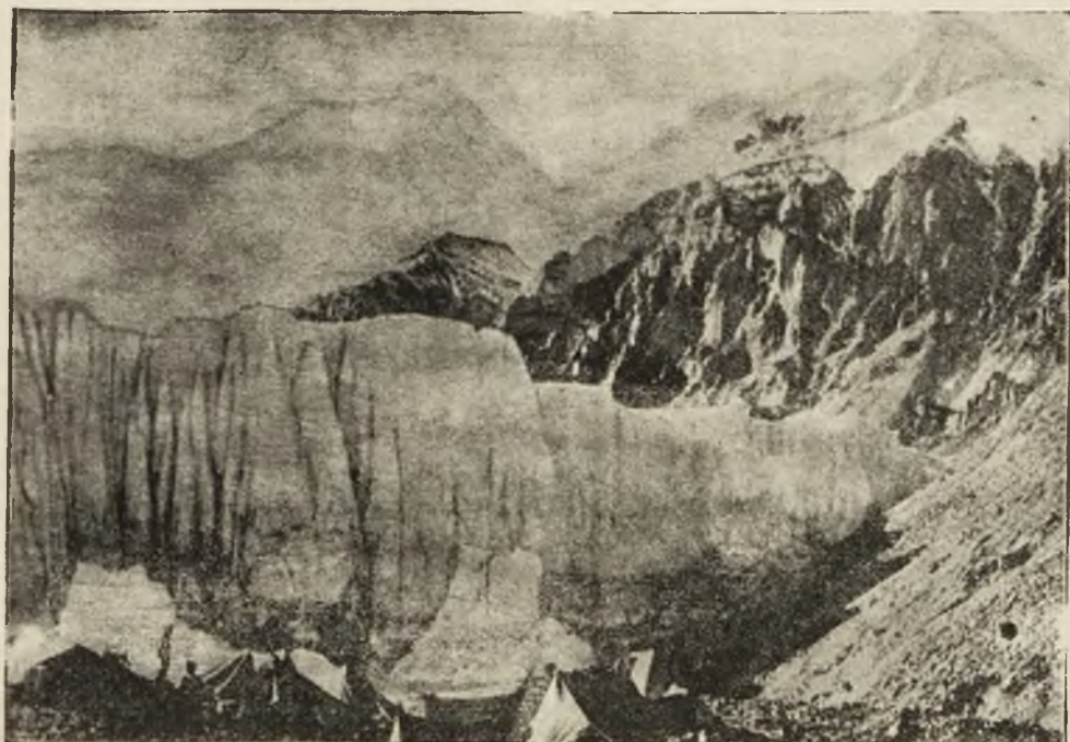
Niedostępne szczyty i przepaści Mount Everestu, największej góry na świecie.