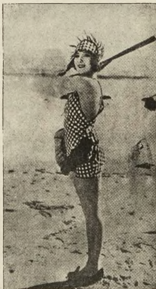
Piękna amerykanka w najmodniejszym kostjumie kąpielowym.