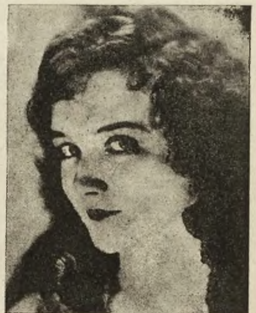
„Gwiazda” filmowa: ang. artystka Mary Philbin.