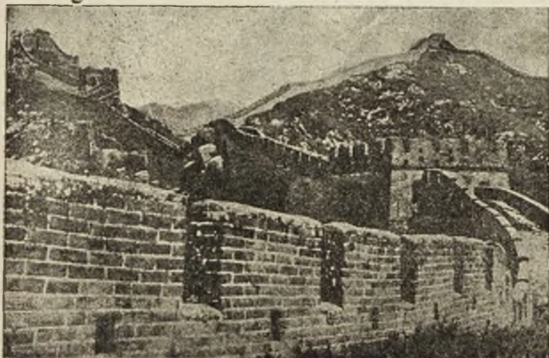
Słynny mur chiński, który rząd pekiński zamierza obecnie rozebrać.