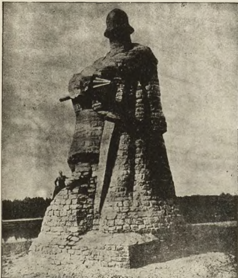
Posąg bohatera czeskiego: W Sudomirze, w Czechach, odsłonięto posąg wodza czeskiego Žižki, który przyczynił się w wielkim stopniu do wyzwolenia Czechów z pod panowania Niemiec.