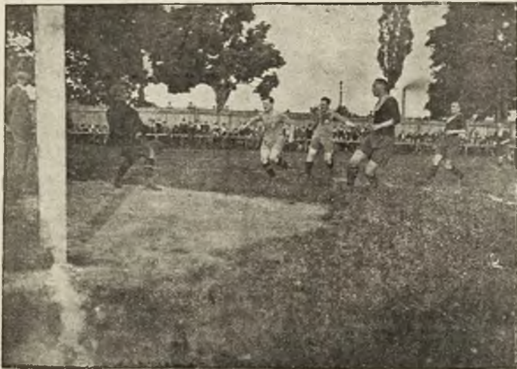
Moment z matchu Pogon—Vienna: Przed bramką „Pogoni“.