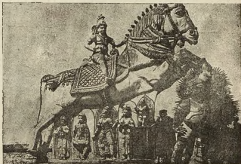
Olbrzymi posąg bożka hinduskiego przed jedną z świątyń w Kalkucie.