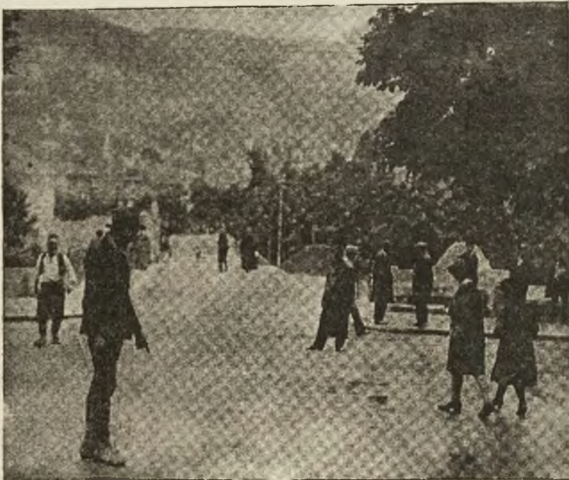
W jedenastą rocznicę wojny światowej: Miejsce w Sarajewie, w którym zamordowany został arcyksiążę austriacki Franciszek Ferdynand.