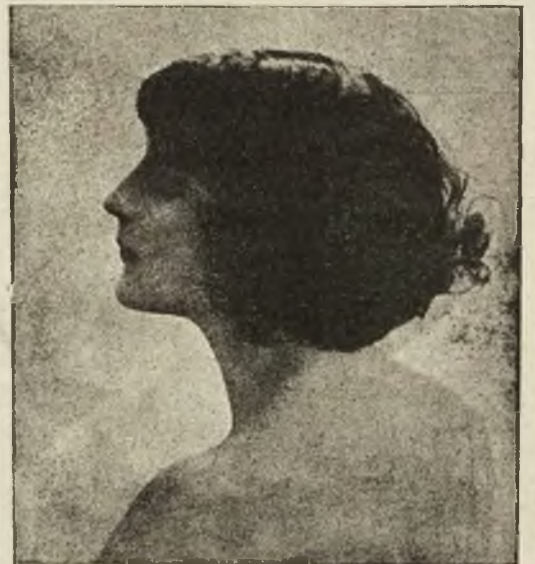
Słynna wiedeńska tancerka kabaretowa Grete Plachota.