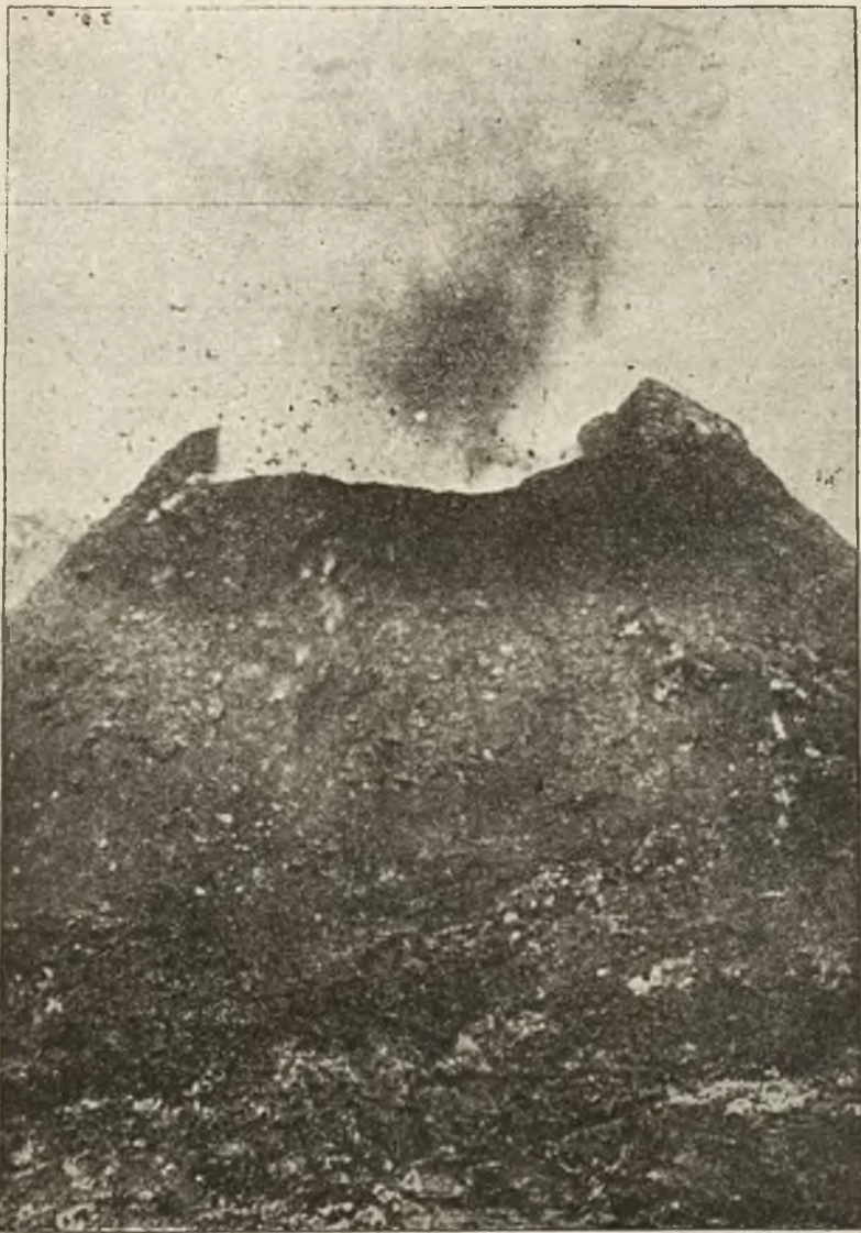
Wezuwjusz w czasie ostatniego wybuchu.