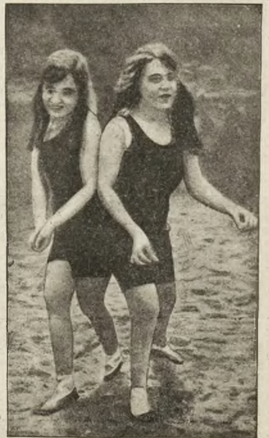
Zrosnięte siostry Daisy i Violet Hilton na plaży.