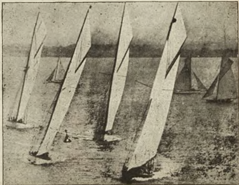
Regaty królewskie w Anglii odbywają się co roku w obecności króla.