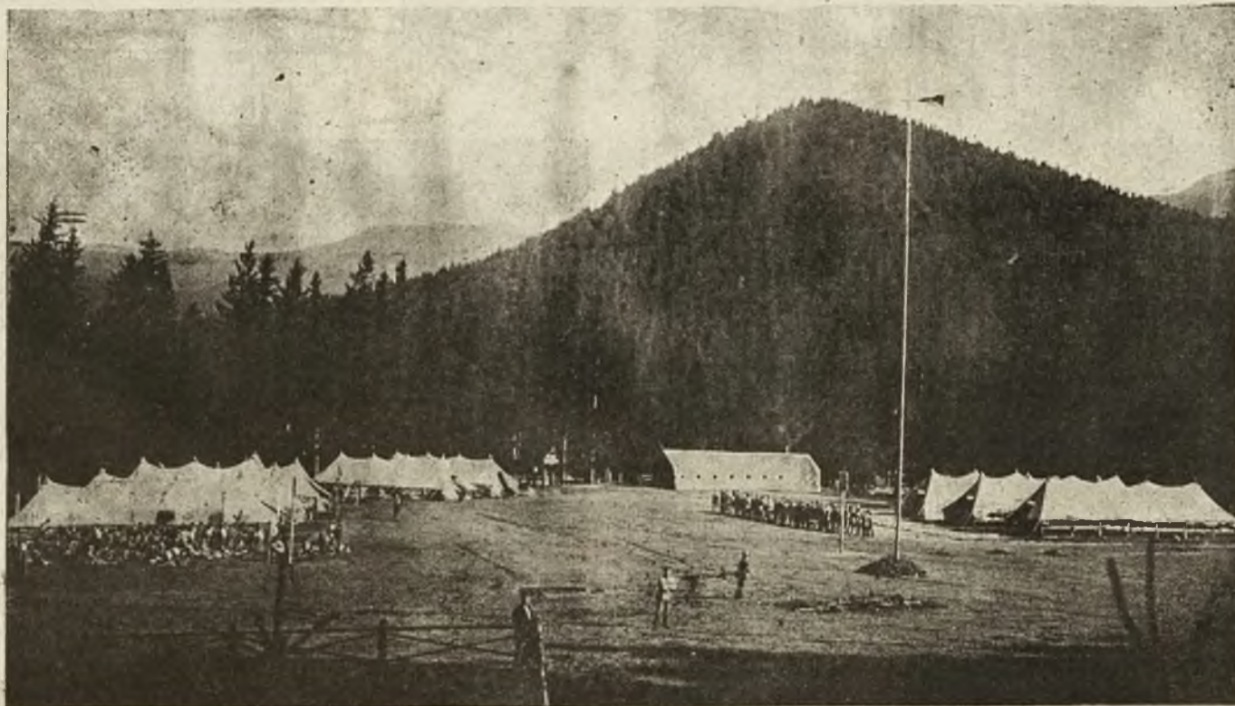
Nasza młodzież w obozach wojskowych nad Oporem: Ogólny widok obozów grupy I-szej w Zelemiance.