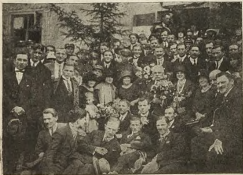
Grupa strzelców i gości w dniu poświęcenia kłalu Związku strzel. na Sygniówce.