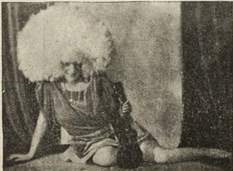
Artystka teatrów wiedeńskich Zerlina Balten w oryg. peruce.