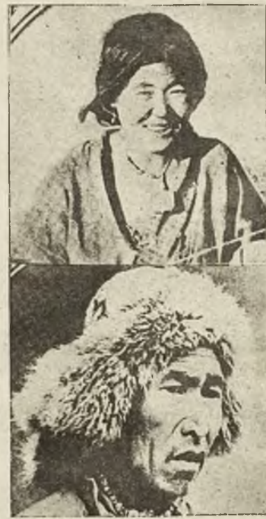
Pod szczytem Everestu: typy tybetańskich kobiet i mężczyzn.