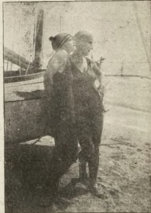
Piękne Lwowianki na gorącej plaży w Alasio.