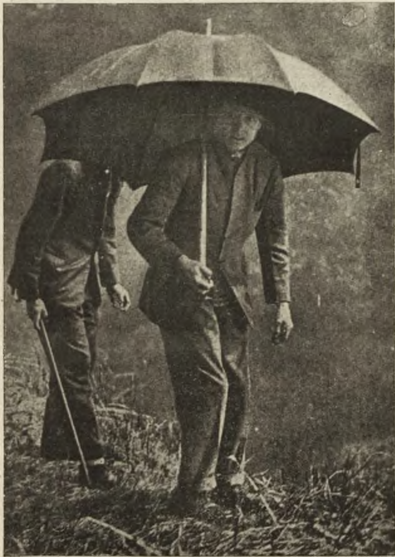
Księżę Walji zwiedza słynne wodospady „Wiktoria“.