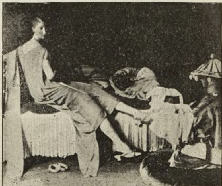
Nowe manekiny na Wystawie Sztuk Dekoracyjnych w Paryżu.