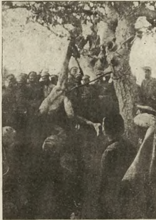
Krwawe dokumenty: Męczeńska śmierć kap. Rosińskiego, zamordowanego w okrutny sposób przez bolszewików dnia 15/7 1919, w Orszy. Ryciny nasze wykonane są według zdjęć fotograficznych.