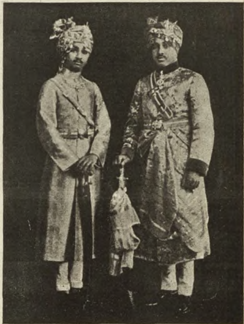
Najbogatszy książę indyjski, maharadża Jodpuru, przyjechał do Londynu.