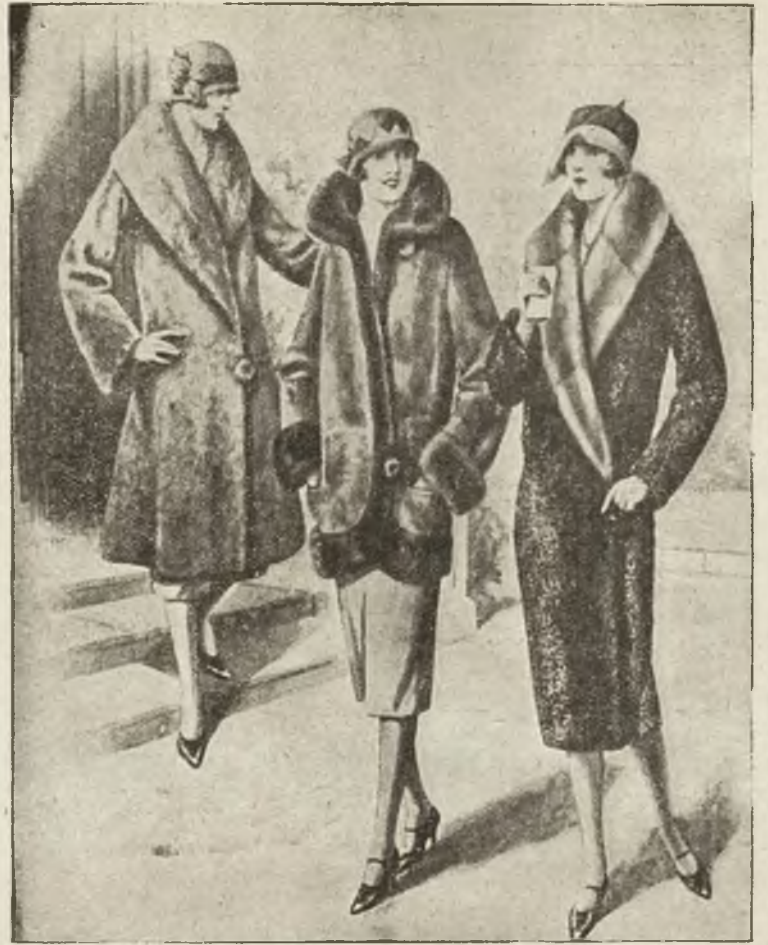
Najnowsze mody zimowe dla pań: Ostatnie angielskie kreacje futer.