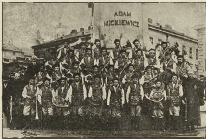
Kapela wychowanków (sierót) zakładu Braci Misjonarzy Kresowych z Dubna, ziemia Wołyńska, we Lwowie przed pomnikiem Mickiewicza.