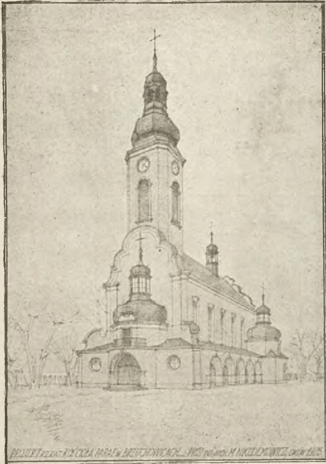
Projekt rzym. kat. kościoła paraf. w Brzuchowicach, wykonany przez inż. M. Nikodemowicza we Lwowie.