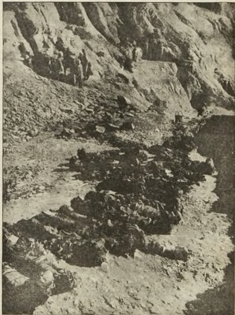
Nowe wykopaliska w Egipcie. — Francuska ekspedycja naukowa odkryła niedawno w Tebach, zwanych „miastem o stu bramach” kilka nowych grobowców i świątyń egipskich. Rycina nasza z lewej strony przedstawia wnętrze grobowca rzeźbiarza Nefer-Rempita, z opoki Ramzesa, rycina z prawej strony 27 mumji wielkiej rodziny egipskiej.