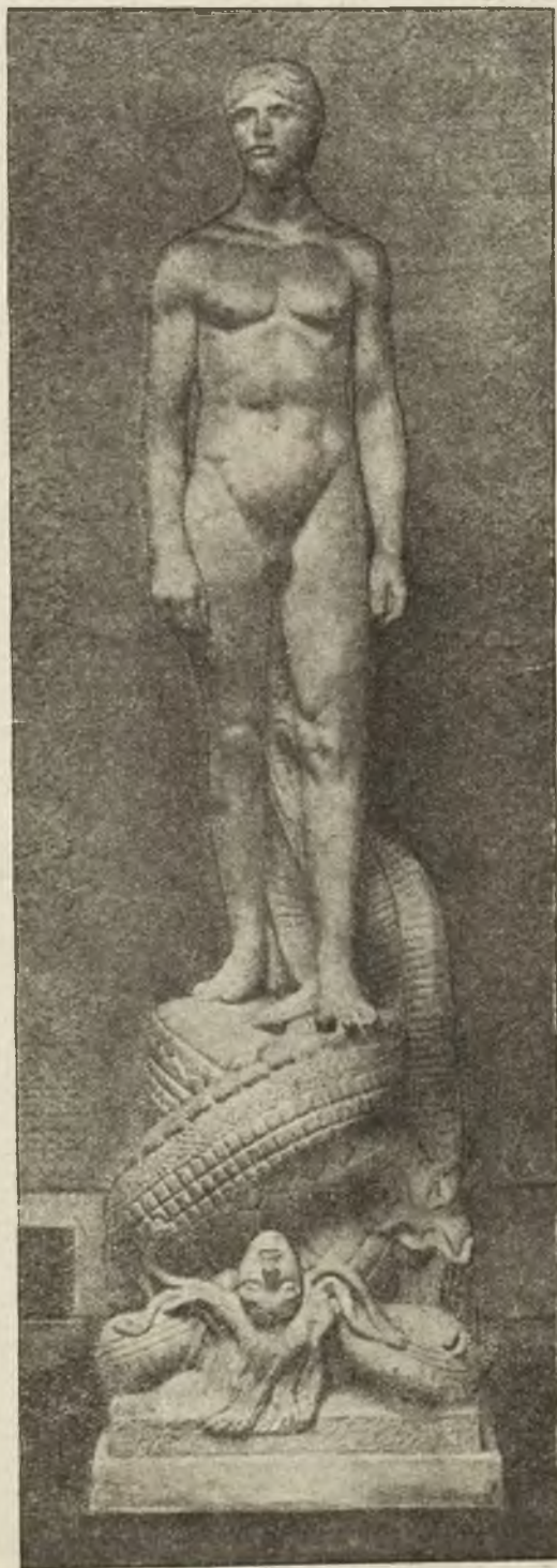
Rzeźba Pawła Landowskiego „Bohater“ na Wystawie Sztuk Dekorat. w Paryżu.