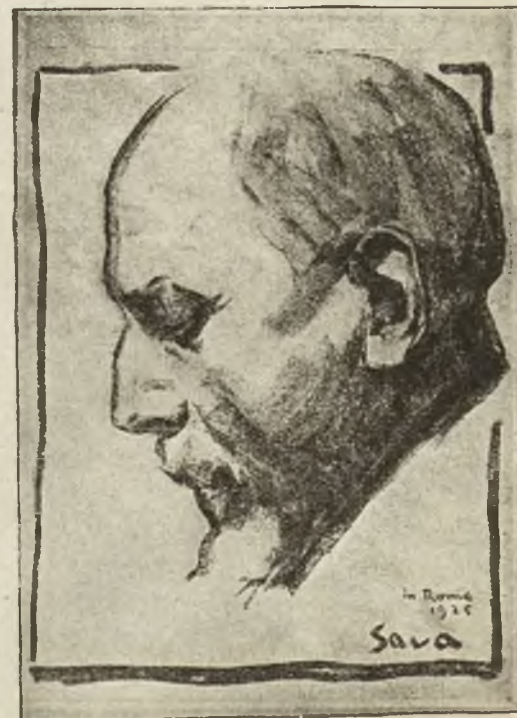
Luigi Pirandello, najwybitniejszy pisarz dramatyczny współczesnych Włoch (do artykułu wewnątrz numeru).