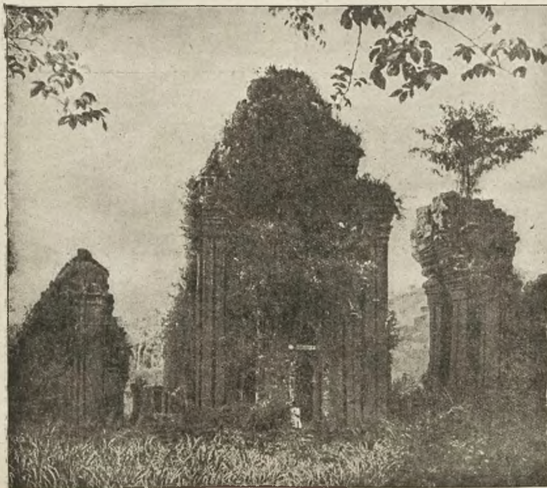
Zapomniana świątynia w Annamie: ruiny świątyni Mi—Son.