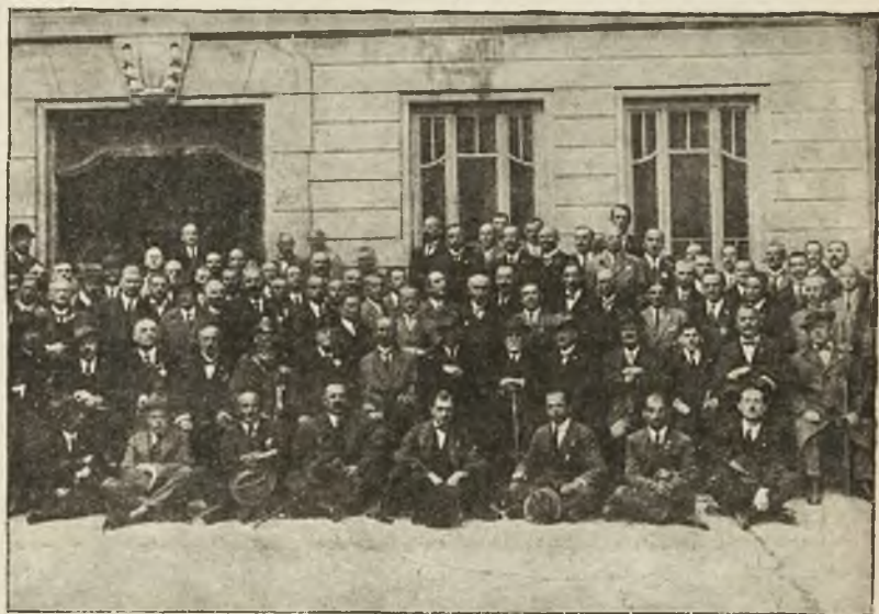
Zjazd oficerów rezerwowych odbył się w dniach 5 i 6 września we Lwowie.