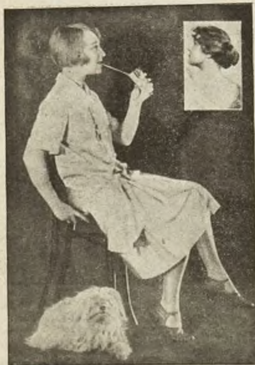
Krótkie czy długie włosy? Artystka teatrów wiedeńskich Elsa Eckenberg w podwójnym uczesaniu.