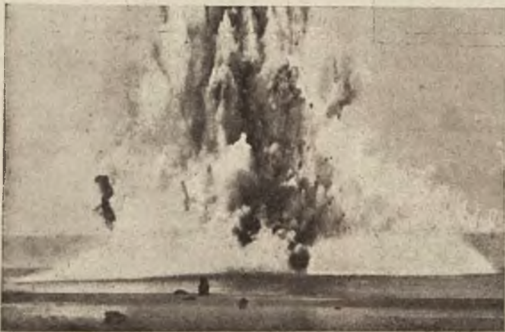
Wysadzenie w powietrze niemieckiej łodzi podwodnej U. 20.