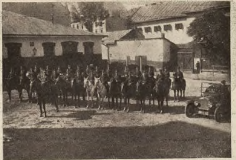
b) Pluton Konny Policji Państwowej we Lwowie.