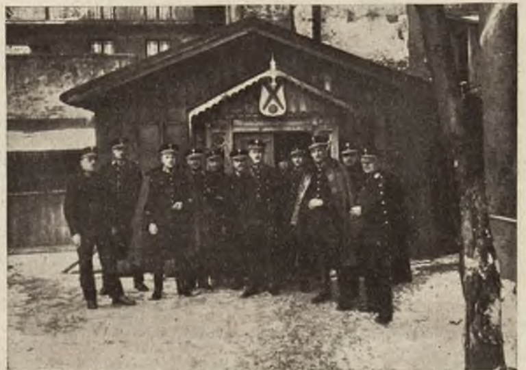
d) Kręgielnia Policji Państwowej miasta Lwowa.