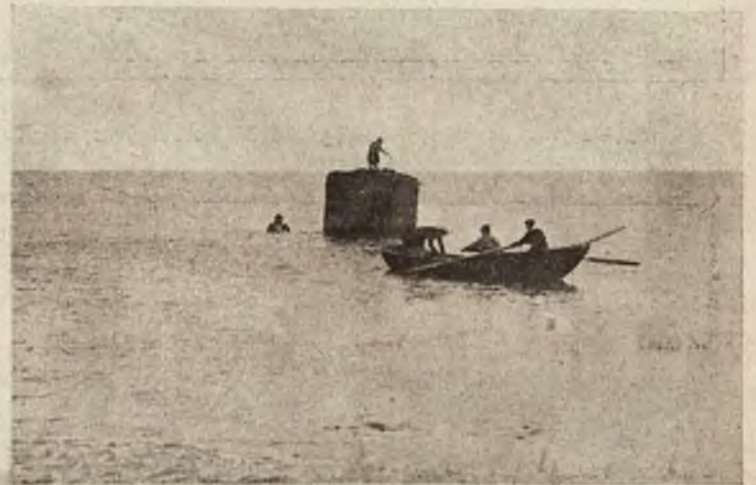
Zakładanie bomby pod łódź podwodną U. 20.