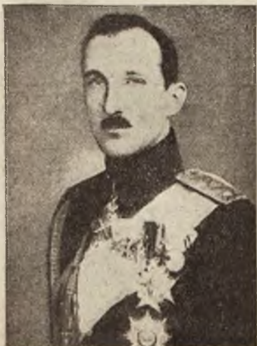
Ciężko chory król Borys bułgarski.