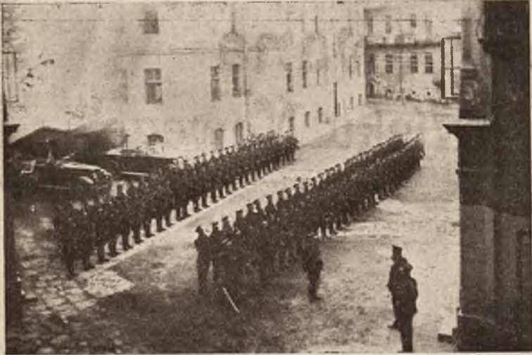
Tydzień policjanta we Lwowie: a) Ćwiczenia kompanij szkolnych.