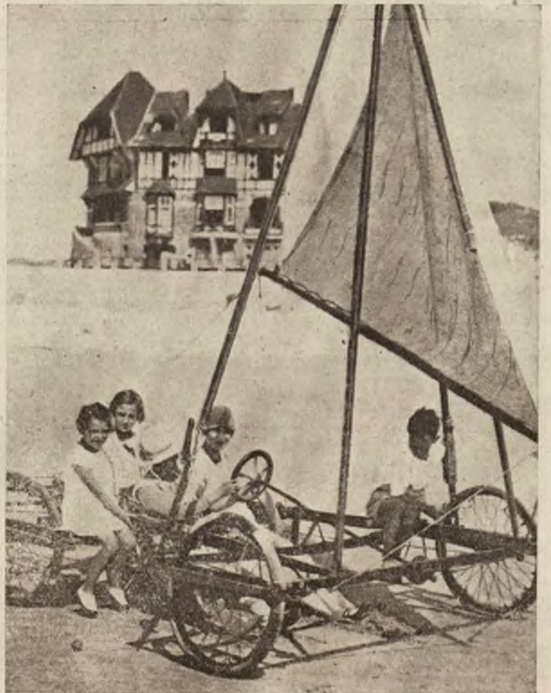
Jacht na kołach jako rozrywka w miejscowościach kąpielowych nad morzem francuskim.