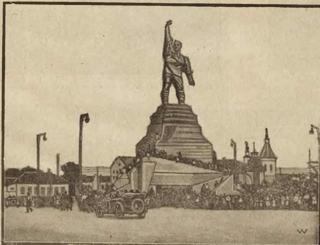
Raid samochodowy rosyjski: Przejazd samochodów przez Bachmut na Ukrainie.