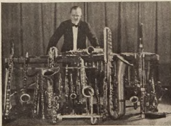
Największy jazz-band nowojorski.