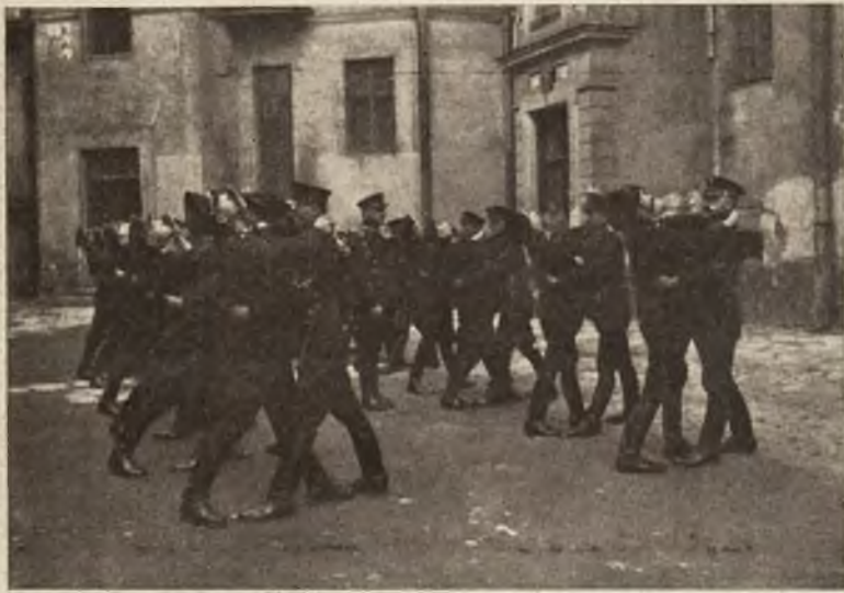
c) Ćwiczenia szkolne Policji Państwowej: „Chwyty japońskie“.