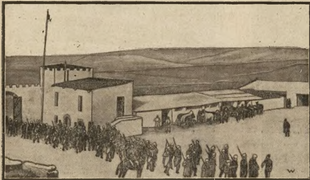
Z placu boju w Syrii: Wojska franc. w miejscowości Soueida, atakowanej przez Druzów.