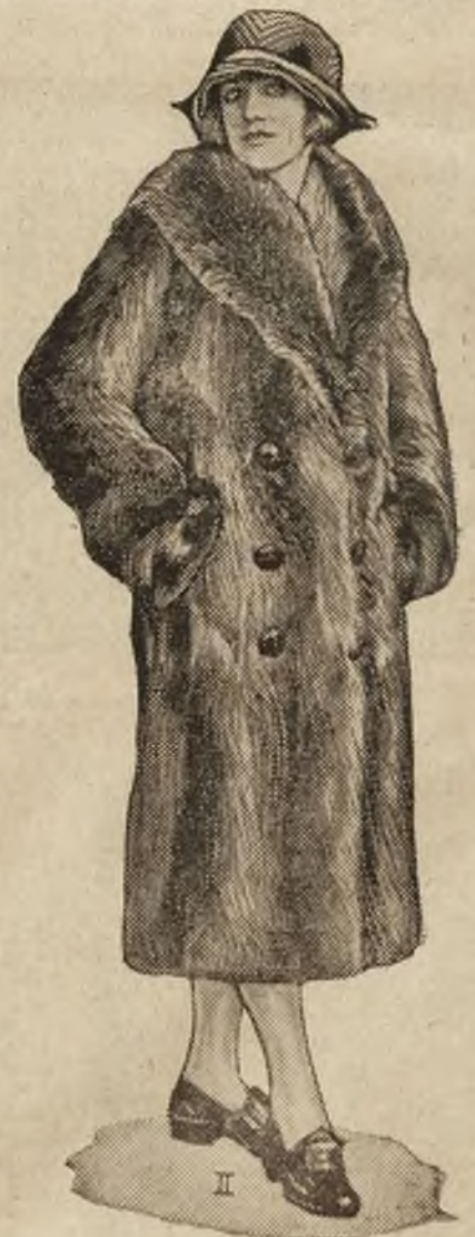
Modne futra: 1) sobolewe futro; 2) płaszcz futrzany w stylu paltota męskiego.