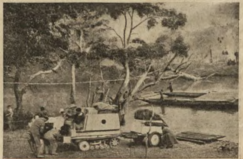
Wyprawa franc. samochodami przez Afrykę środkową: samochody przepływają się na tratwie przez rzekę pod równikiem.