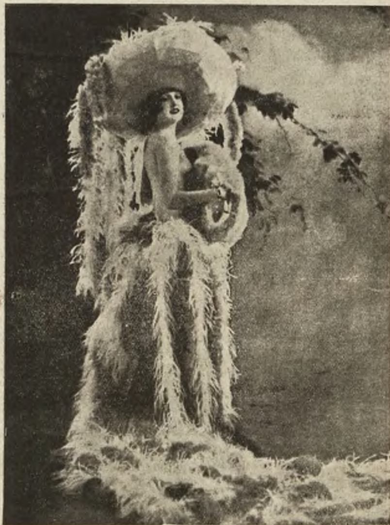
Raj kobiet: Endja Mogoul, gwiazda music-hallu w Berlinie, w fantastycznym kostjumie z strusich piór i rajskich ptaków.