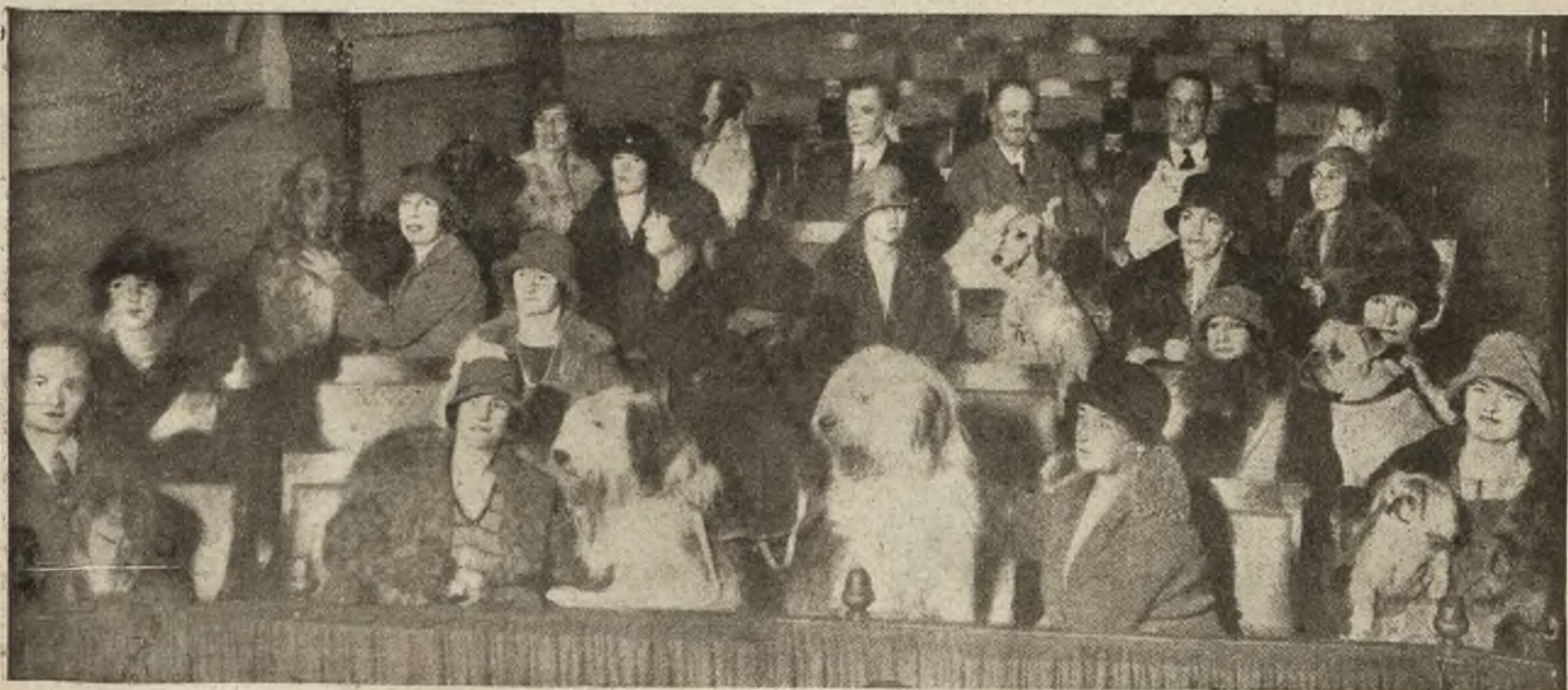
Teatr dla psów w Londynie: Parter w czasie przedstawienia (pokaz specjalnego filmu dla psów).