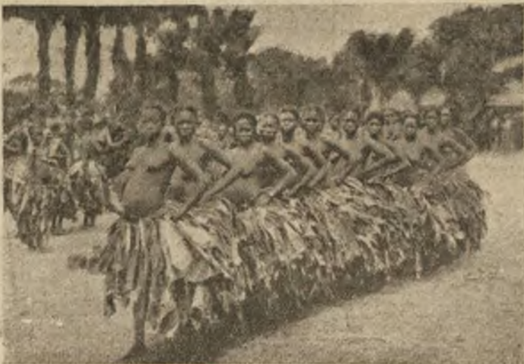
Egzotyczne tancerki: Tancerki murzyńskie w Bambili (Kongo belgijskie) w czasie tańca na wolnym powietrzu.