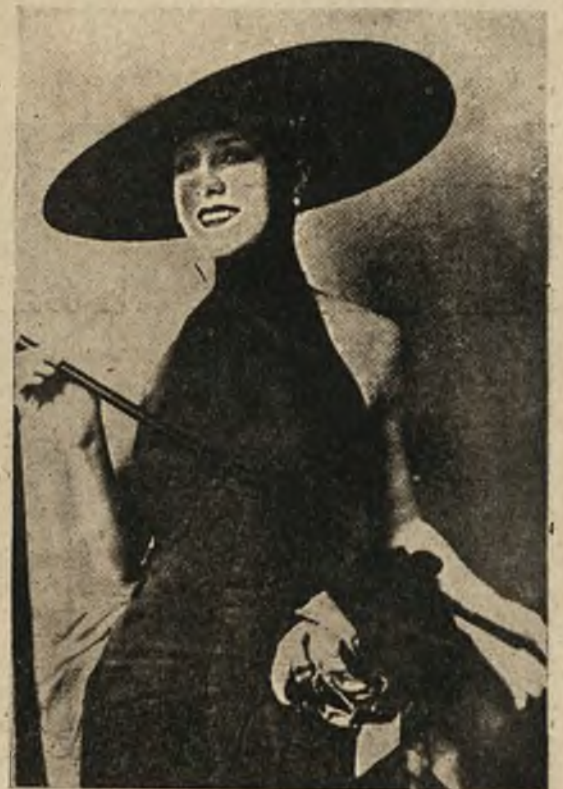
Najnowsza „sensacja“ nowojorska: Kostjum wampirowski artystki Normy Shearer.