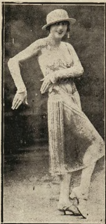
Z music-hallów par. Gina Palermo, gwiazda film. występuje jednocześnie na scenie kab. „Mayol”.