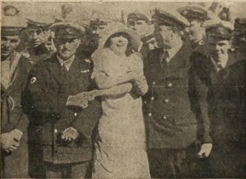
Angielscy oficerowie statku „Capetown“ krążącego po oceanie Spokojnym w odwiedzinach u znanej artystki filmowej Colleen Moore w Hollywood.