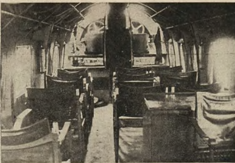
1) Dreagnouth powietrzny: Olbrzymi samolot angielski, który poraz pierwszy odbył niedawno podróż z Francji (Bourget) do Londynu. 2) Wnętrze dreagnoutha powietrznego, urządzone dla 20 pasażerów.