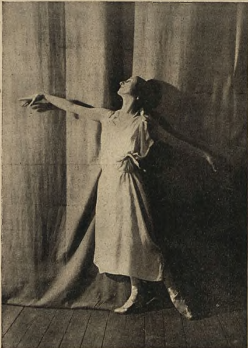
Słynna rosyjska tancerka, Anna Pawłowa, wyjeżdża do Afryki i Australii.