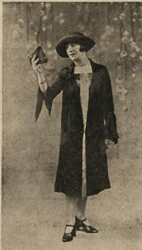
Najmodniejszy płaszczek wieczorowy.