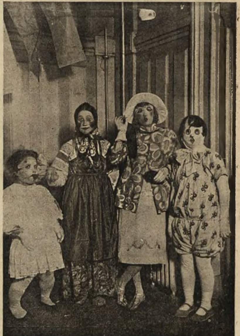
Wielki bal artystów-malarzy polskich w Paryżu: Kilka oryginalnych masek.