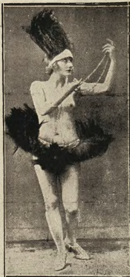
Z music-hallów paryskich: Ginette De'ly, słynna tancerka, występuje w music-hallu par. „Mayol”.