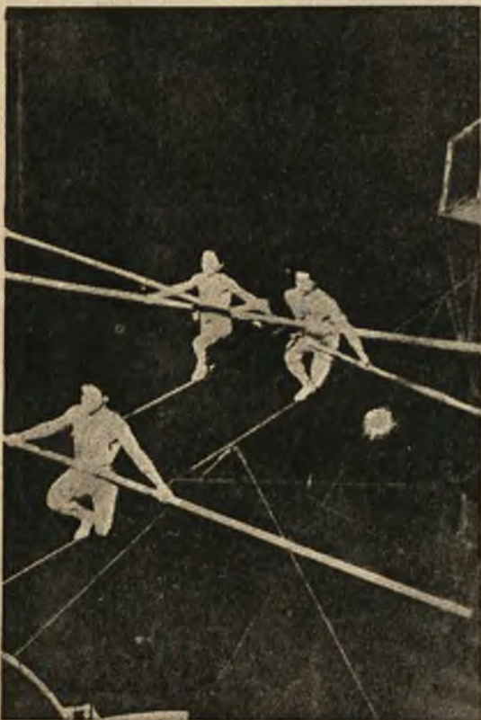
Karkołomne sztuczki linosków na 15 mt. wys. Dziecko w środku balansuje na drążku, spoczywającym na plecach dwóch linoskoków.