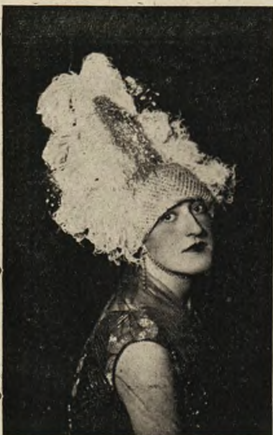
Modne nakrycie głowy do wieczorowych tualet.