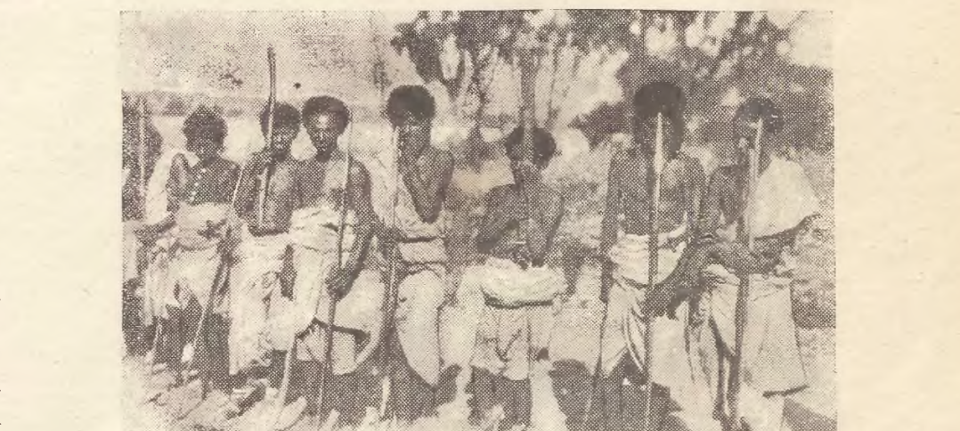
Dwa sąsiadujące ze sobą szczepy murzynskie w kolonii włoskiej Eritrea pokłóciły się ze sobą i zagroziły sobie wydarciem wojny. W związku z tem szczepy zarządziły mobilizację