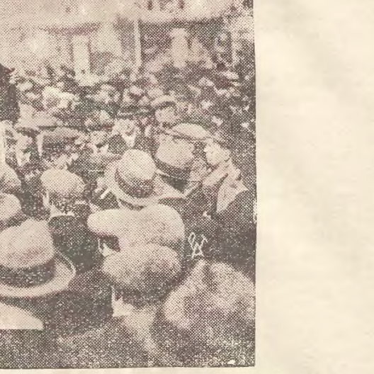
Wśród ludności żydowskiej w Londynie, szerzy się niesłychanie gwałtowna agitacja...