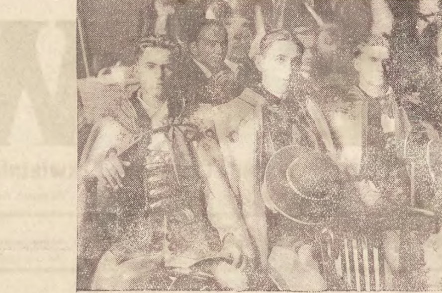
W dniu dzisiejszym rozpoczęły się w Warszawie uroczystości, związane z 10-leciem istnienia warszawskiego Ogniska Związku Podhalan przy bardzo liczny udział delegatów Związku Ognisk z całego Podhala. Na zdjęciu naszym widzimy 3-ch delegatów z Podhala w charakterystycznych strojach góralskich.