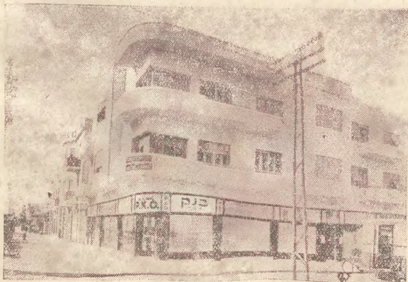
W dn. 14 bm. odbyło się uroczyste otwarcie oddziału PKO w Tel - Awiwie (Palestyna) w obecności konsula R. P., przedstawicieli władz i licznych zaproszonych gości. Zdjęcie nasze przedstawia lokal PKO przy ul. Allenby, głównej arterji Tel - Awiwu.