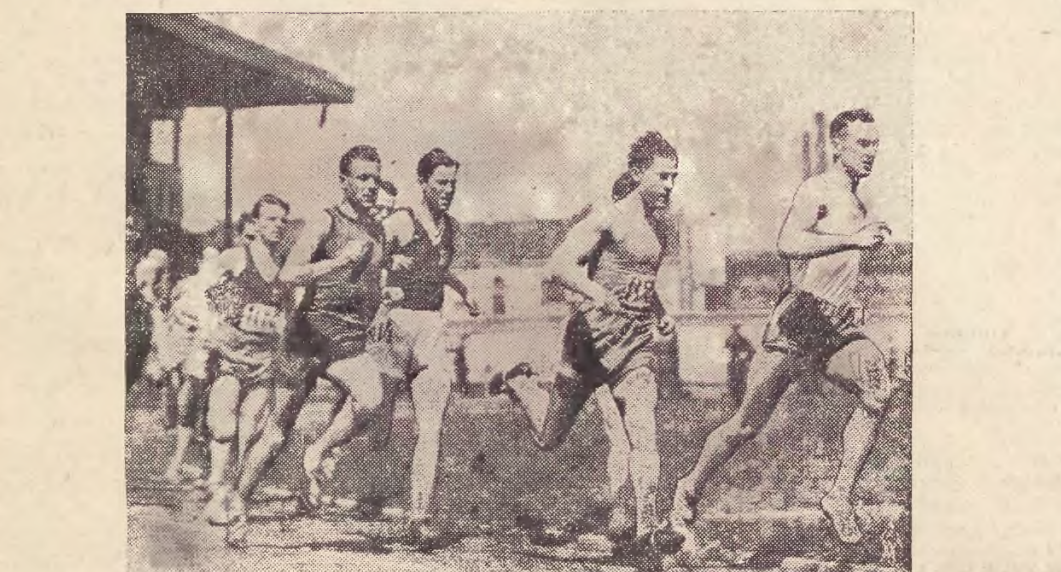
W ubiegłą sobotę i niedzielę odbyły się w Warszawie na stadionie Legii zawody lekkoatletyczne o mistrzostwo Warszawy. Na zdjęciu na szawie start do biegu na 1500 m.

Rada Polskiego Związku Wydawców Dzieników i Czasopism, stwierdzając wzmożenie się propagandy, skierowanej przeciwko całoci i niepodległości Rzeczypospolitej Polskiej, uchwała jednomyslnie na posiedzeniu w dniu 30 maja 1933 r. zwrócić się do Zarządów Zw. Wydawców w państwach Europy i Ameryki z następującym wzywaniem: