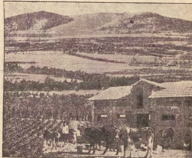
Widok na osiedla Emeku i góry Gilboa, dziś gdy pola i osiedla kibucowe wyrosły na błotach.

Jego własny dawny kibuc? — Nie istnieje. — Cały się rozpadł. Najpierw wyrzucono komunistów. „Bo chcieli tworzyć swoje rosyjskie porządki” — dowiaduję się. Potem podzielono się na „lewych” i „prawych”. Potem część odeszła: jest teraz w jednym dużym kibucu pod Hedera. Z tem wszystkim gospodarka rolna szwankowała. „Kibuc, widzi pan, funkcjonuje dobrze wtedy, jeżeli wszyscy jego członkowie są przekonani z tą samą ideą. Wszyscy — i tą samą. Inaczej wszystko się rozpada samo”.