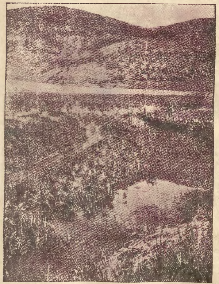
Widok Emeku z roku 1923. Bagna wypełniały wtedy całą dolinę aż po widne w dali góry Gilboa. Taki widok przedstawia jeszcze kilka małych już dolin na północ-wschód od Emeku. Są to doliny, do których kolonizacja żydowska nie dotarła.

nej „władzy”, są tylko „funkcjonariusze”). Stanowią oni zazwyczaj ciało kolegjalne, mają i własne funkcje. Główną figurą jest „ekonom” zarządzający całokształtem spraw gospodarczych, sekretarz, którego zadaniem jest utrzymanie kontaktu ze światem, załatwianie spraw „polityki zagranicznej” kibucu, dalej skarbnik (ta funkcja, zwykle czysto buchalteryjna, łączona jest nieraz z funkcją ekonomy). Do tego dochodzi dwóch ludzi, których zadaniem jest rozkładanie godzin pracy na poszczególne gałęzie gospodarcze i przydzielanie kibucników do tych robót. Osobno od tego wszystkiego stoi t.zw. sołtys, który reprezentuje na terenie kibucu władzę gminną, czynnik administracyjny, już podporządkowany władzom krajowym.